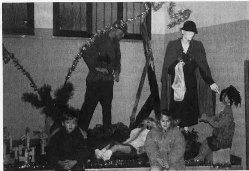
»Sarajevske jaslice« v Nabrežini