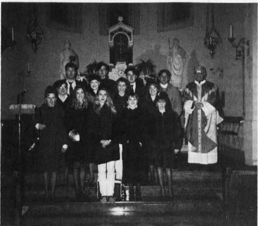
V Števerjanu se je v mesecu decembru zbral letnik 1972 in proslavil svojih 20 let z mašo

jenju alkoholikov, stike ima s podobnimi ustanovami tudi v Sloveniji. Poleg strokovnega dela se posveča tudi politiki in je občinski svetovalec za SSK v gorškem občinskem svetu. Čestitamo!