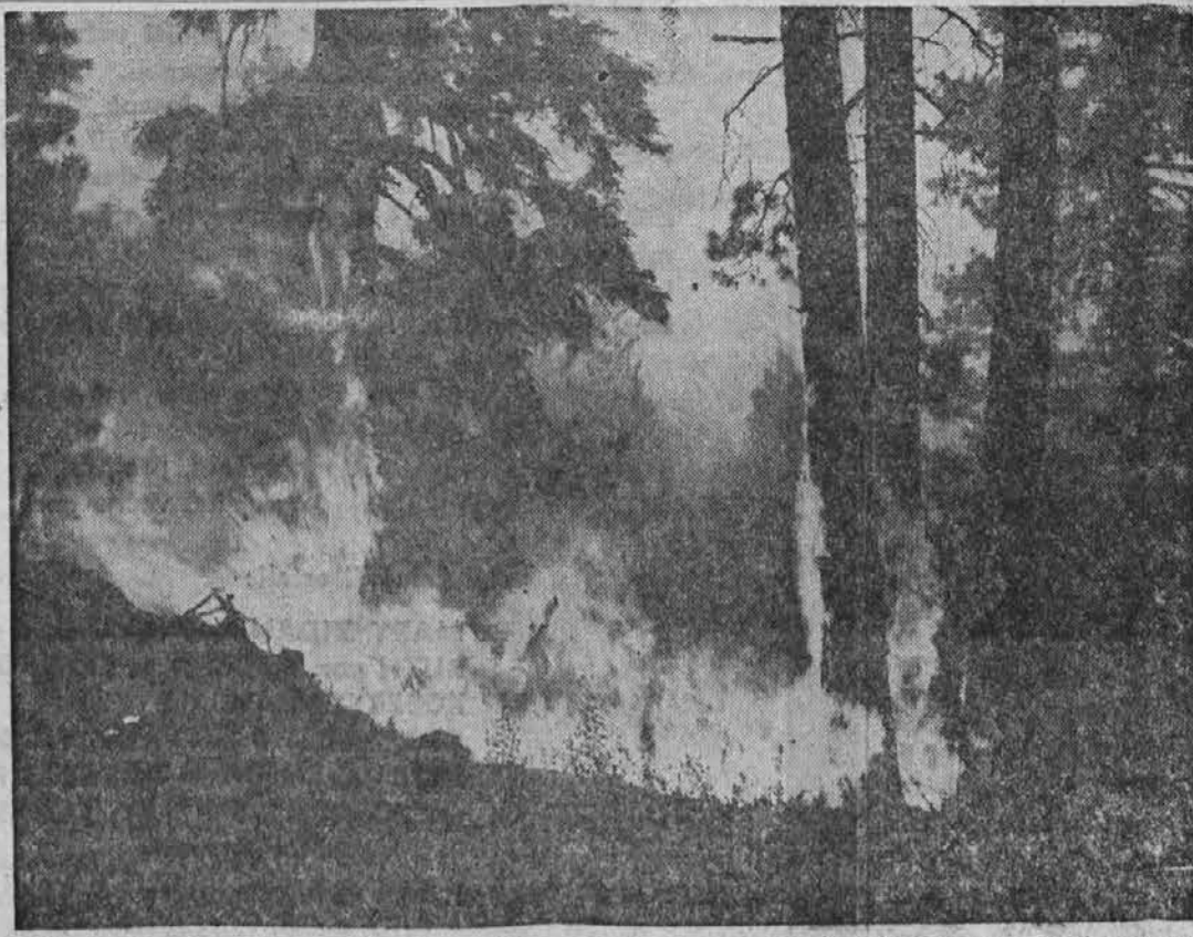
ONE IN THOUSANDS—Last year 155,000 fires roared through America's forests. They destroyed recreational areas, timber, watersheds, wildlife. What caused these fires? 9 out of 10 were caused by carelessness . . . pure and simple. Won't you be careful this year? Extra careful? Remember—only you can prevent forest fires. This message sponsored by: