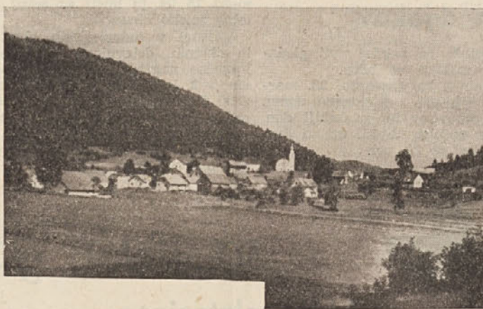
Pogled na Drago

Kakor smo zvedeli, bomo še letos dobili lepo asfaltno cesto do Zlebiča od Dolenje vasi. Sredstva za asfaltiranje ceste bo prispevala republika. Za prebivalce teh krajev bo novourejena cesta velikega pomena, ker bo možen hiter in varen prevoz, saj bodo nekatere dele ceste tudi zravnali.