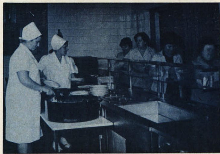
Malica v Libni.

Zgodi se, da namesto pravilnega slovenskega izraza uporabljamo udomačeno besedo. Tako kroži-