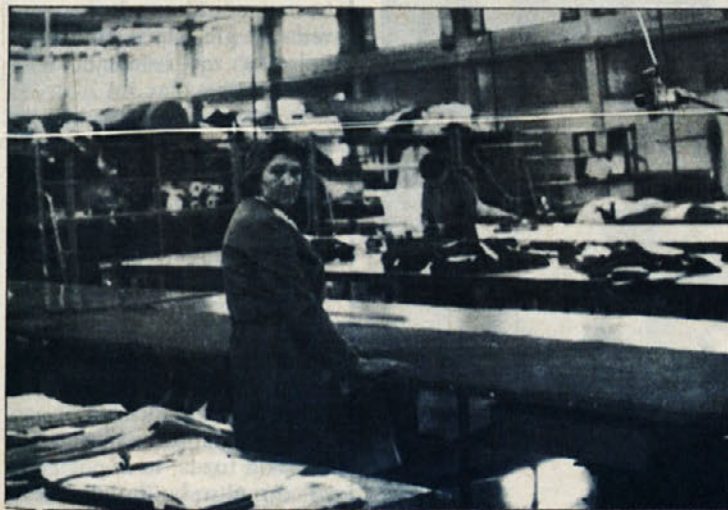
V krojilnici tozda Tip-Top.