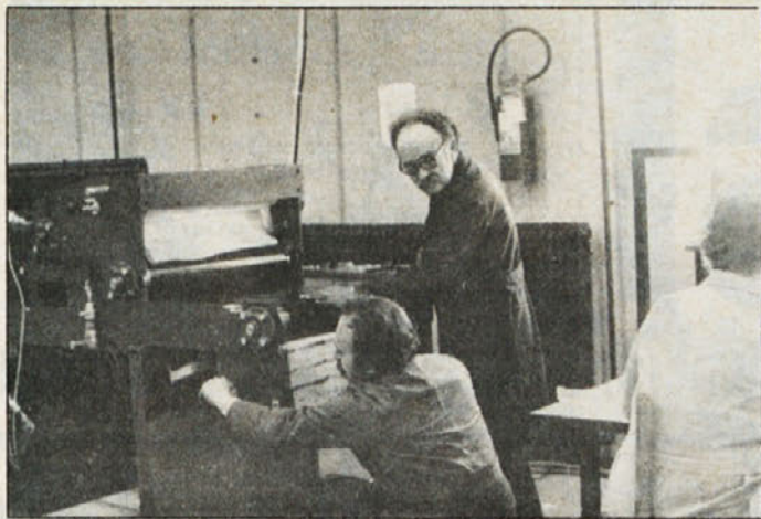
Za naše vzdrževalce je dela vedno dovolj. Posnetek je iz Delte.