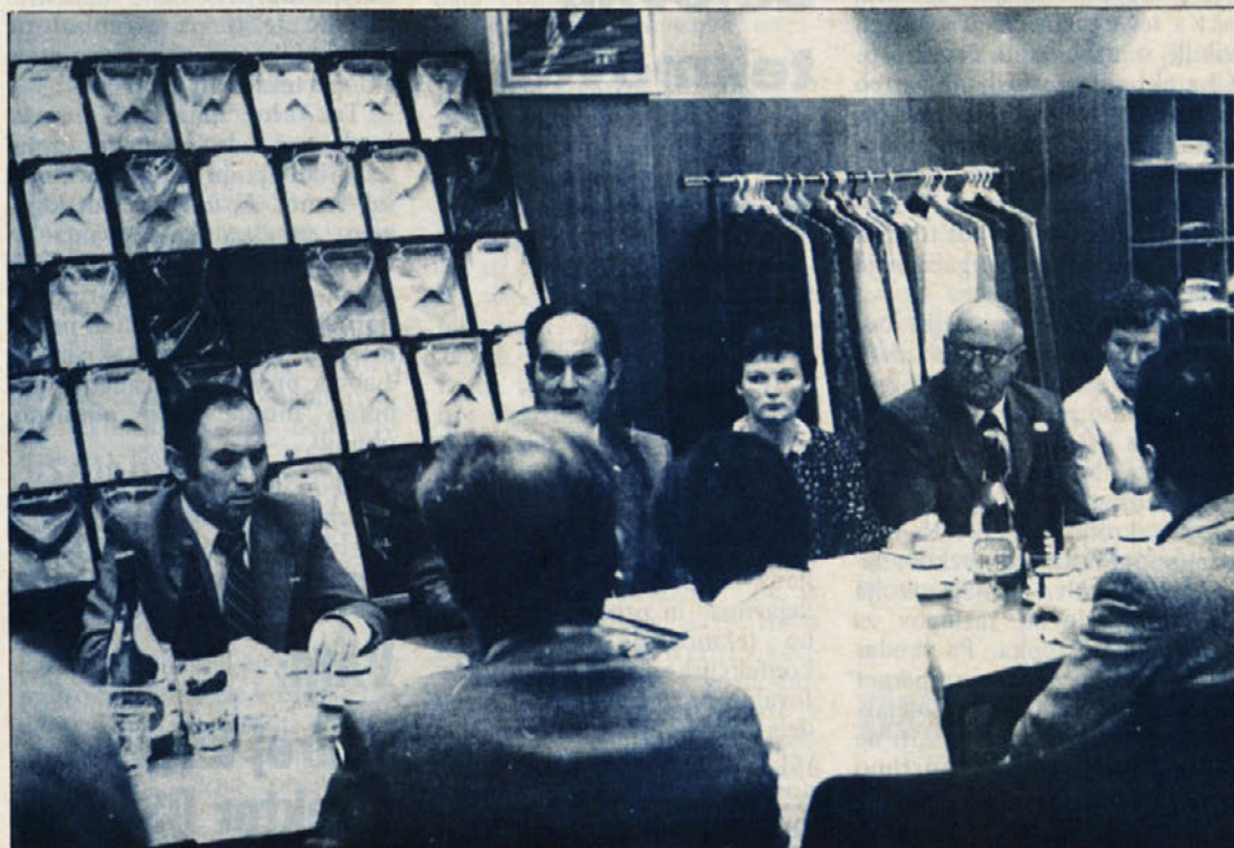
S skupne seje delavskega sveta delovne organizacije in poslovnega odbora, ki je bila v Ljubljani.

Pomembno vprašanje, o katerem je spregovoril delavski svet, je samoupravni sporazum o združevanju dela in sredstev na osnovi fonda federacije za realizacijo programa za rekonstrukcije, razširitev in modernizacijo predilniških in tkalskih kapacitet. Kot že imepove, gre za nove kapacitete metražerjev. Med prioritetskimi delovnimi organizacijami je naveden tudi naš velik dobavitelj iz Gostivara, zato je seveda pristop k sporazumu tudi v našem velikem interesu. Kako pomembno je področje zdravstvenega varstva in zakona o invalidskem in pokojninskem zavarovanju, je ponovno pokazala razprava o omenjenih točkah. Delegati so