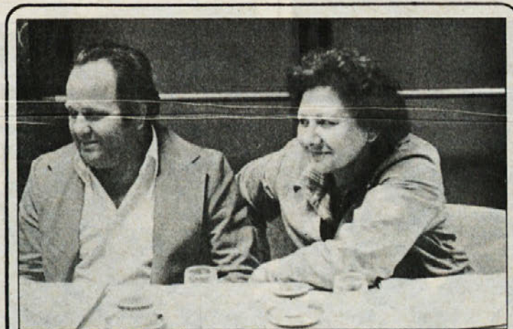
Delegata tozda Tip-Top na delavskem svetu delovne organizacije.