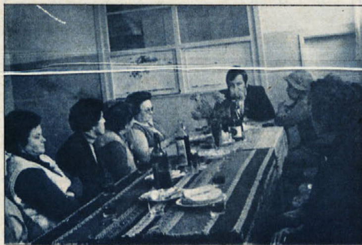
Srečanje upokojencev Temenice je vedno prijetno.

Za strokovno izpopolnjevanje delavcev velja še zaostri funkcionalno izobraževanje, ki nudi sveže in poglobljeno dograjevanje znanj, je prilagojeno času in zahtevam in tako zagotavlja strokovnost in aktualnost.