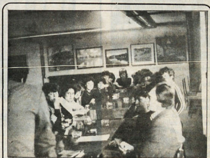
Tako so se v Delti zbrale bodoče šoferke. Tozda je skupaj z združenjem šoferjev v Ptujju organizirala predavanja iz teoretičnega znanja, ki je potrebno za šoferski izpit.