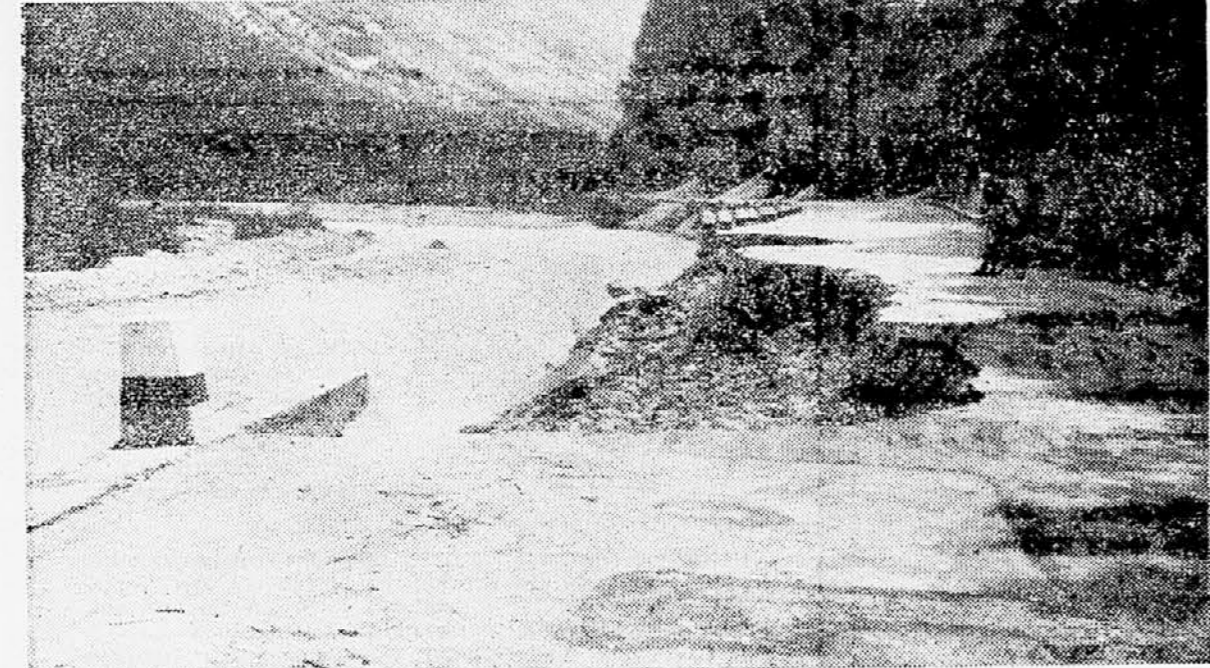
Ena izmed večjih okvar ceste Kobarid—Cedad

gostov. Vsak dan je pred jamo pisana družina avtomobilov in avtobusov iz raznih držav. Pred vhodom v jamo je kiosk, kjer si domači in tuji turisti lahko marsikaj kupijo, odprli pa so tudi dobro založeno okrepčevalnico. Morda bi bilo prav, če bi pred jamo ali kjerkoli v Postojni prodajali tudi tuje časopise. Zaradi velikega prometa so moral podreči tržnico in tako so uredili vsaj zasilen parkirni prostor. V sezoni pelje vsak dan skozi Postojno 96 avtobusov v obe strani, in sicer rednih, da o izrednih sploh ne govorimo. Tudi pred bencinsko črpalko bodo vgradili še en rezervoar in je delo že v polnem teku. Pri novem parkirnem prostoru ureja podjetje »Mestne trgovine« sodobno delikatesno trgovino, vsi gostinski obrati pa so nabavili nove aparate in preuredili svoje lokale. Ker je dobava piva omejena, bi pričakovali, da bo vsaj coccake ali pa oranžade dovolj, toda zgori se, da mnogokrat zmanjka tudi tega. To pa je toliko bolj čudno, ker ima Postojna svoj sodavičarski obrat, in tega res ne bi smelo manjkati. Postrežba v gostinskih lo-