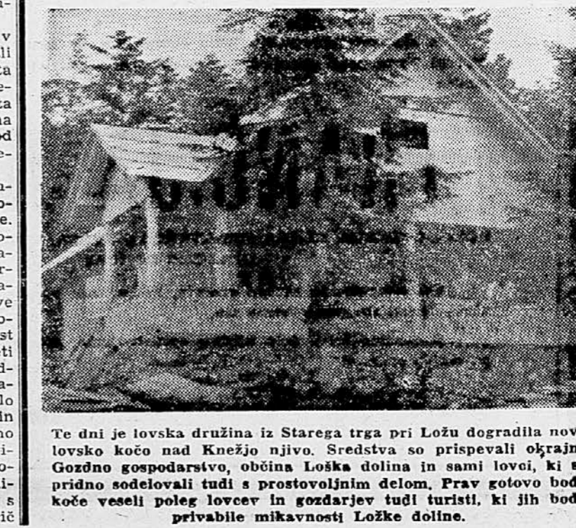
Te dni je lovska družina iz Starega trga pri Ložu dogradila novo lovsko kočjo nad Knežjo njivo. Sredstva so prispevali okrajno Gozdno gospodarstvo, občina Loška dolina in sami lovci, ki so pridno sodelovali tudi s prostovoljnimi delom. Prav gotovo bodo kočje veseli poleg lovcev in gozdarjev tudi turisti, ki jih bodo privabile mikavnosti Loške doline.

Te dni je prispela v Dobrno počitniška kolonija iz Subotice, ki šteje 100 otrok. Zdravstveno ogroženim otrokom je šesttedenski oddih preskrbela tamkajšnja organizacija Rdečega križa. Otroci se bodo dobro počutili v prostorih, ki jim jih nudijo vodstvo osemletke.