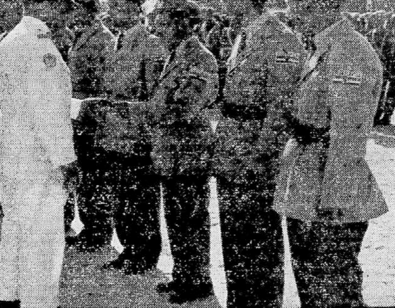
Poveljnik sil OZN v Egiptu general Burns je izročil oficirjem in vojakom jugoslovanskega odreda v Egiptu odlikovanja. Na sliki: general Burns odlikuje z medaljo OZN oficirje in vojake jugoslovanskega odreda v Egiptu. Jugoslovanski odred je prvi, ki je sprejel ta odlikovanje.

Chamoun je danes na tiskovni konferenci izjavil, da Libanon ne bo zaprosil za tujo vojaško intervencijo izven OZN. Dodal je tudi, da je spopad v Libanonu nevaren za mir in stabilnost na Srednjem vzhodu. Ko so ga vprašali, če bo odstopil, ako na predsedniških volitvah 24. julija ne bo izvoljen, četudi mu mandat poteče šele 24. septembra, je odgovoril negativno. Poudaril je tudi, da predsedniške volitve