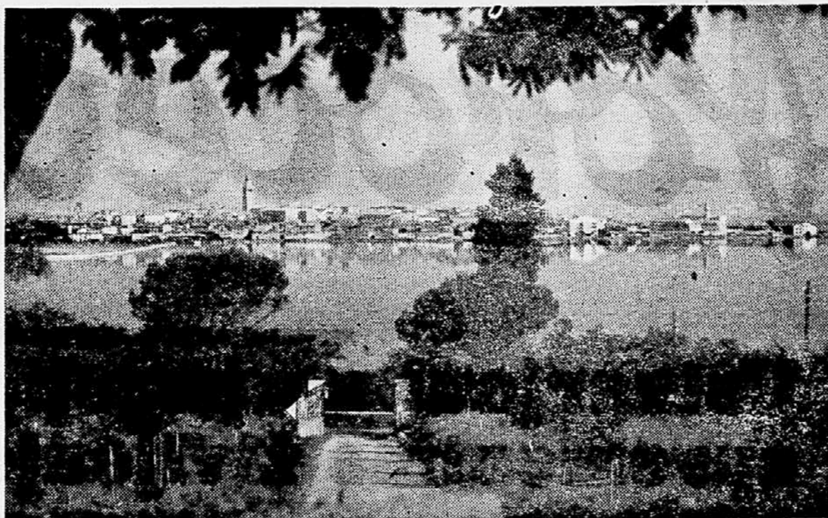
Pogled s Skoocjana proti Kopru je v jutranjih urah, ko je morje mirno, še posebno lep.