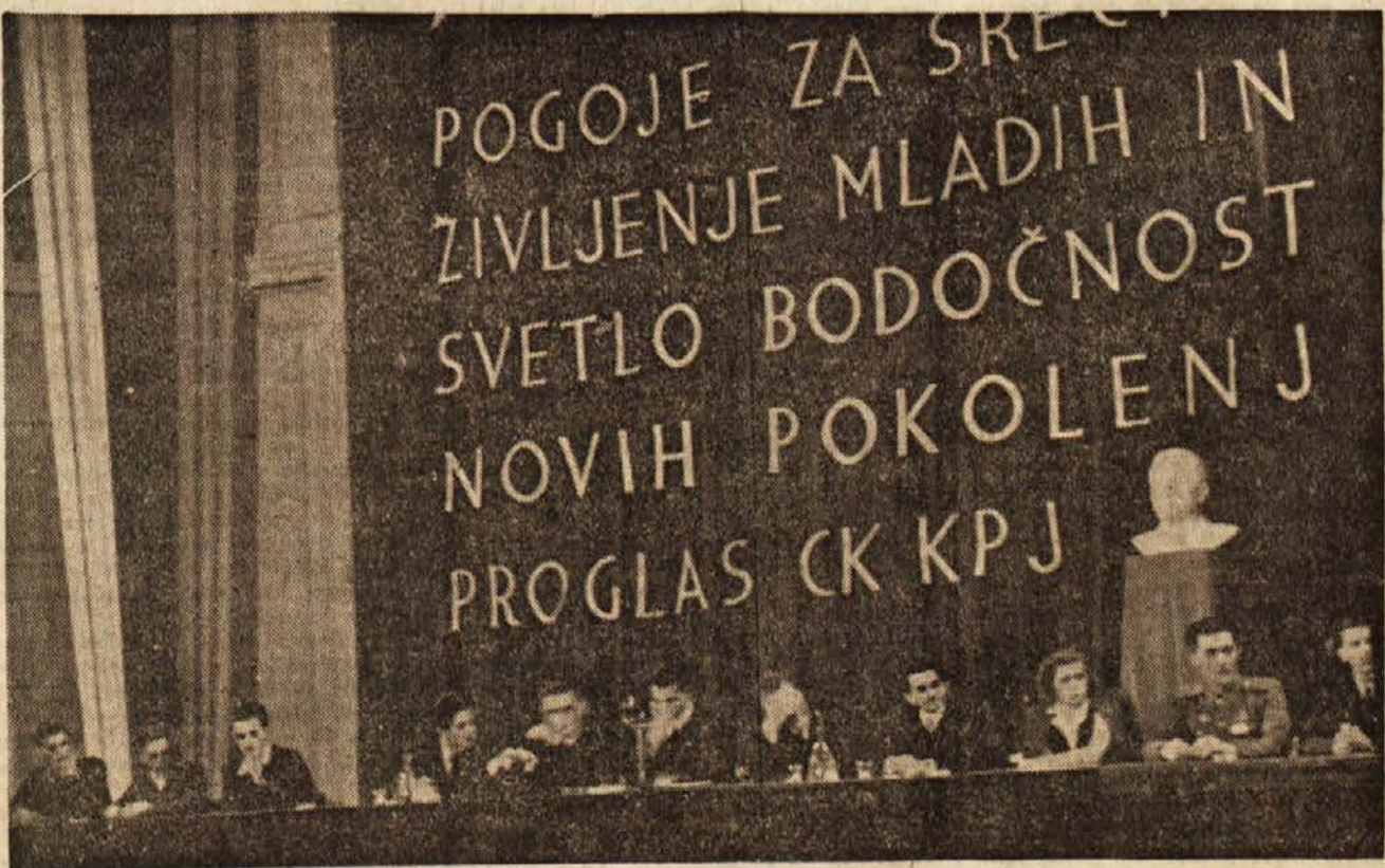
Delovno predsedstvo III. kongresa LMS