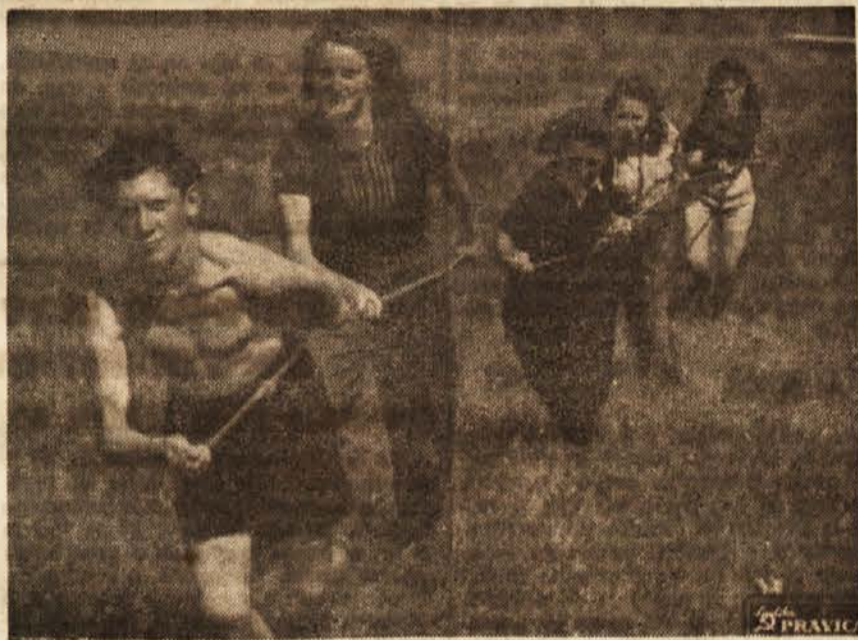
Gojenki in gojenke pri vlečenju z gumo

Popoldne se nadaljuje vaje na »Vrabec«. Grupe se ponovno razvrstijo po letališču, le četrta je ostala pred hangarjem. Pri predpoldanskem vlečenju z