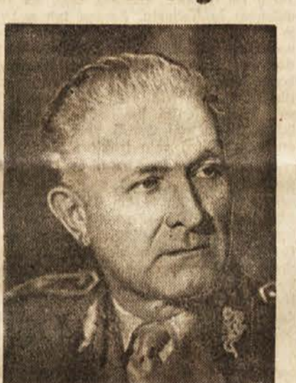
Minister narodne obrambe armijski general Ludvik Svoboda

Komandant češkoslovaškega letalstva divizijski general Alois Viherek je bil rojen leta 1892 v Slezijski. Pred prvo svetovno vojno je absolviral višjo industrijsko šolo, 1927 pa višjo letalsko šolo v Parizu in tečaj za višjo komandante. Leta 1915 je nastopil vojaško službo v avstro-ogrski vojski, potem pa je kot ujetnik v Rusiji leta 1917 stopil v češkoslovaško legijo.