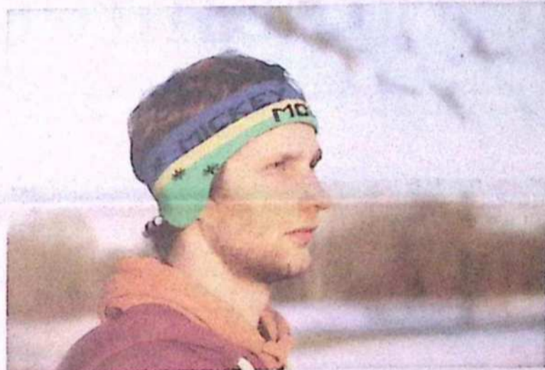
Lani v Radencih

o Balkancih in na splošno o tujcih, kot to recimo velja za Štajersko, kjer to najbolj občutiš. Moram reči, da je Dunaj najbolj toleranten do tujcev.« Življenje na Dunaju je sicer nekoliko dražje od življenja v naši prestolnici, vendar hkrati odlično z vidika ponudbe dogajanja in površin za pre-