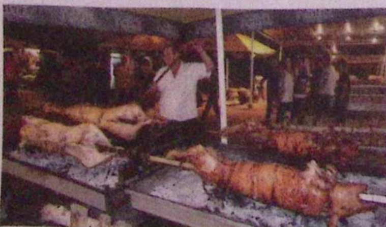
Obiskovalci so pojedli največ odojkov, jagenjčkov, mesa z žara in svatbenega zelja.

Na največjem etnofestivalu na Balkanu in tudi širše se je tudi letos trlo ljubiteljev trobent in dobre kulinarike, med njimi veliko Slovencev in Pomurcev. To je moja in sploh prva reportaža za Pen s tega romanja na Balkan. Tja sem se odpravil s skupino prijateljev z radgonskega konca. Če že drži, da ni pravi musliman tisti, ki se vsaj enkrat ne udeleži hadža – tradicionalnega romanja v Meko, potem gotovo drži tudi, da ni pravi Srb, ki se nikoli ne udeleži »Dragačevskega sabora trubačev« v Guči. A ko se tega največjega etnofestivala na Balkanu in tudi širše udeležiš enkrat, enostavno ne moreš odnehati. Na stotisoče Srbov in tujcev z vsega sveta komaj čaka vroč avgust, ko spet »romajo« proti tej vasi z okoli 2500 prebivalcev na jugu srbske Šumadije. Po prepričanju mnogih, ki so se vsaj enkrat udeležili tega dogodka, je v Guči (najbližje večje mesto je Čačak) vsako leto najbolj nora »žurka« na Balkanu, ki mnogim pomeni enostavno »doživeti Gučo – in umreti«.