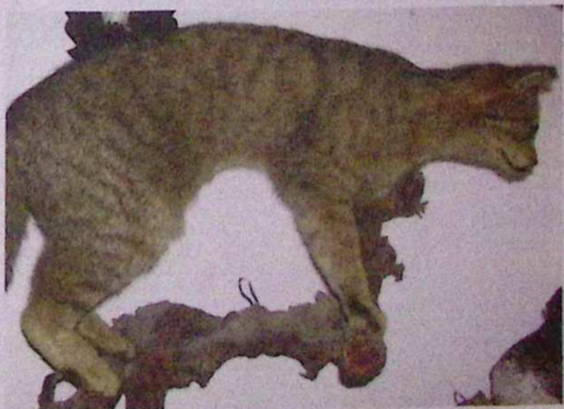
Kustečeva tigrica iz Laz pri Dolnji Bistrici je potrdila, da tudi v Orlovščeku živijo divje mačke.

mačke, predvsem križance z divjimi mačkami. Teh v Sloveniji ni malo. Zanesljivo lahko ugotovimo pripadnost divji vrsti le z anatomskim merjenjem in primerjanjem črevesa. Strokovnjaki ugotovijo pripadnost eni ali drugi vrsti tudi s primerjanjem sklepnega dela spodnje čeljusti. Drugi, manj zanesljivi razpoznavni znaki za divjo mačko so še: temna, v premeru okoli dva centimetra velika lisa nad prsti zadnjih nog; šopki bele dlake med blazinicami šap; smrček rožno rjave barve oziroma rdeče barve; z dlako porasle ušesne školjke (notranjost