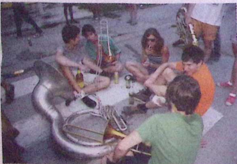
Festival trobentačev vsako leto obišče tudi veliko mladih iz vse Evrope. In pravi so najpogosteje popivali kar na pločnikih in travnikih.