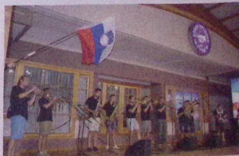
Slovenski trobentači iz Postojne so poželi glasno aplavze.