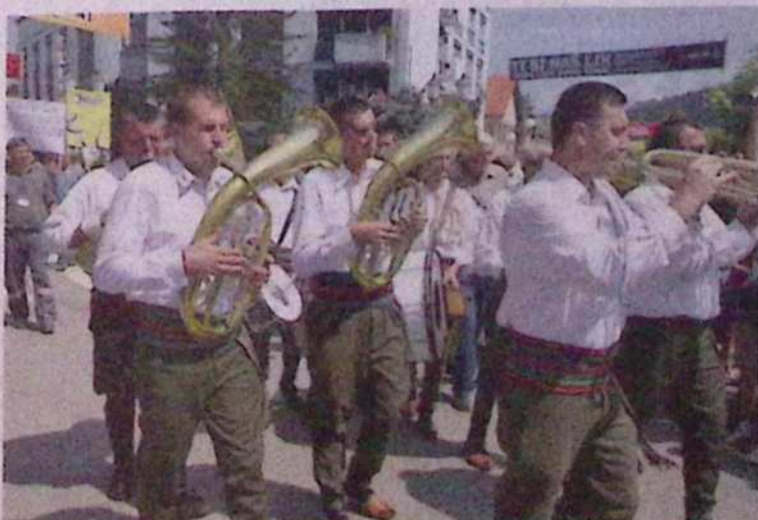
Guča je resnično ena in edina.