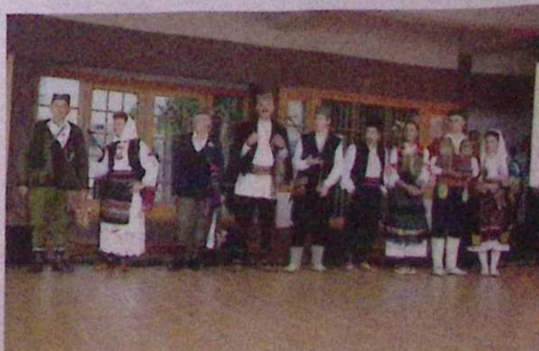
V Guči skrbijo tudi za ohranjanje kulturne in zgodovinske dediščine, v tem primeru narodnih noš.