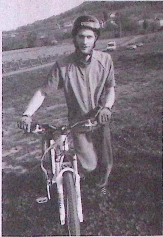
V avstrijskem kraju Pichla leta 2007