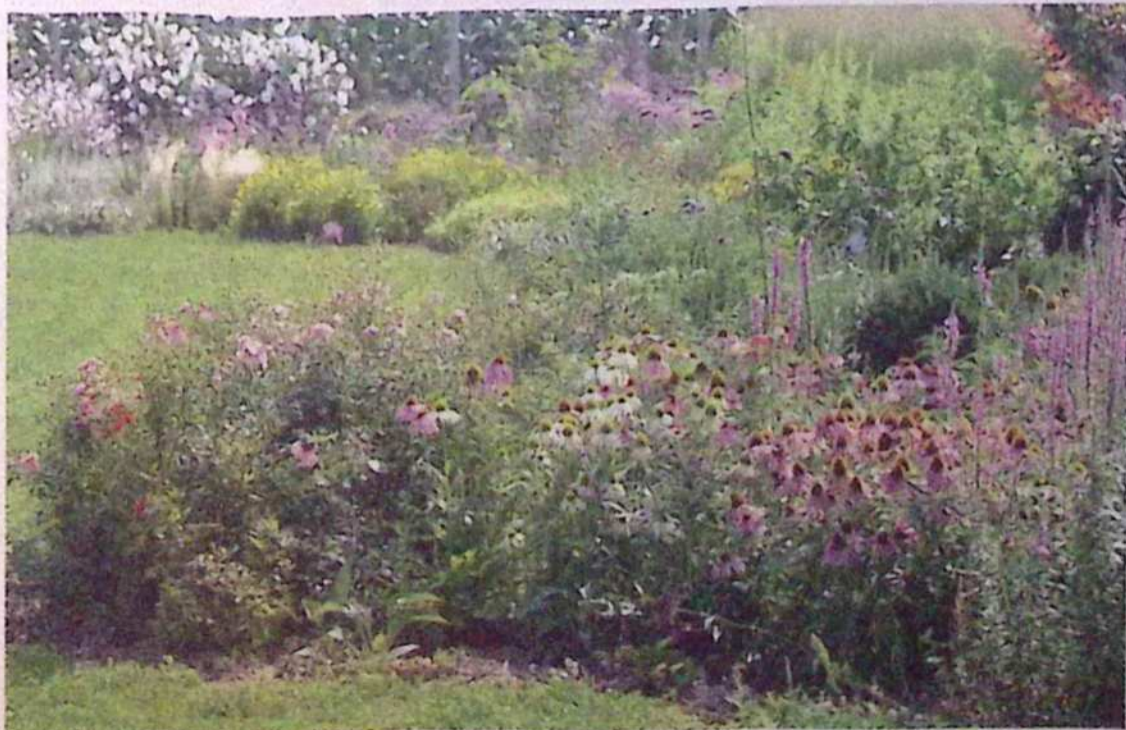
Da so barviti prizori v enakih niansah zanimivi, so zaslužne trajnice: ameriški slamnik, peroskia, rman, sporiš, gaura, kozmoja, konjska griva ...

trov, se opazi lastničina zbirateljska strast, vendar je vse ubrano umeščeno v njen vrt. Vse rastline so izpostavljene močnemu soncu na južni legi, zato zasaja strukturne rastline, ki bodo zadrževale vetrove, in obenem marsikatero rastlino obvarovale pozebe.