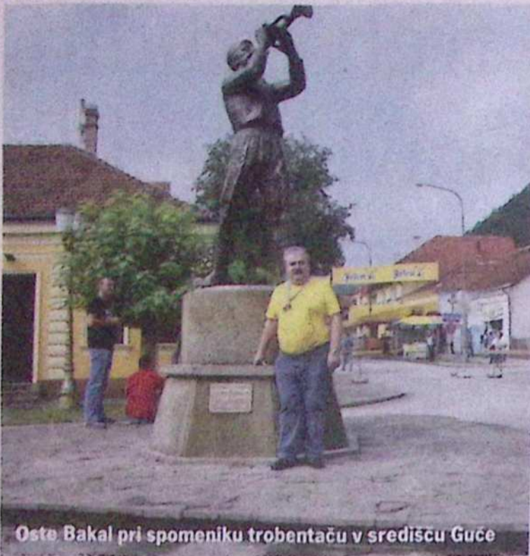
Oste Bakal pri spomeniku trobentaču v središču Guče