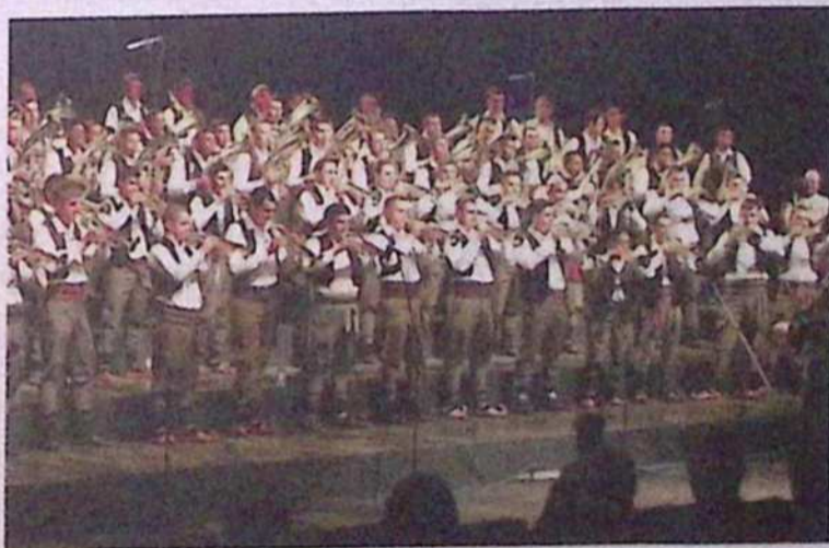
Svetovna prestolnica trobente je gostila kar 1080 nastopajočih trobentačev.