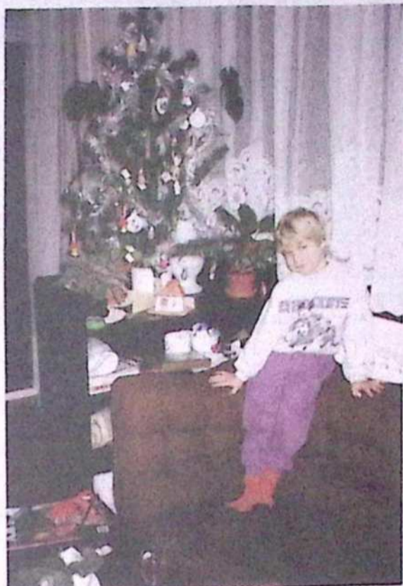
Pri petih letih za božič v Murski Soboti

Najprej se je odpravil v Avstrijo, kjer je delal tri leta. Na začetku je živel v Gradcu in nato na Dunaju, kjer je delal pri montaži kuhinj, ter v kraju Zillertal, kjer je sodeloval pri opremljanju hiš in hotelov. Država se mu je v teh letih prikupila. »Avstrija mi je zelo pri srcu, tudi narod se mi zdi zelo prijazen. Predvsem Tirołci nimajo očitnih predsodkov