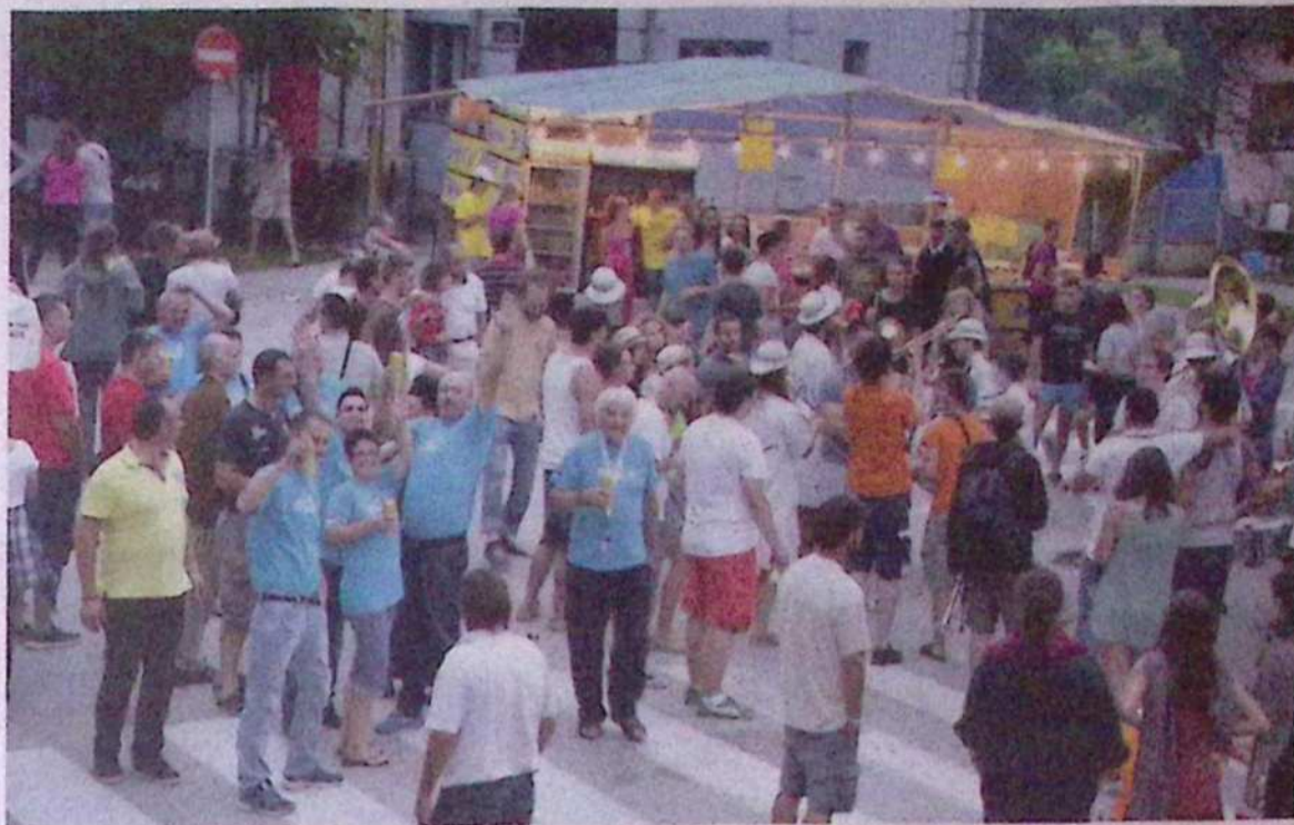
Gibanje po prizorišču je predvsem zvečer in ponoči omejeno in se v gneči težko prebijaš. Zato je najbolje, če imaš v roki kaj za odzejanje, kot so imeli Pomurci v enotnih modrih majicah.