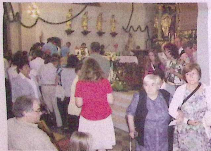
Že približno tisoč let romarji prihajajo v turniško versko središče. Navada je, da gredo ljudje okoli glavnega Marijinega oltarja in si pri njej izprosijo milosti, zdravja, sreče in zadovoljstva, denarja in še kaj.