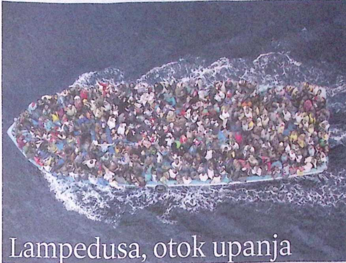
Lampedusa, otok upanja

Počitnice so, večina ljudi iz Evrope se v teh mesecih napoti na obale, najamejo hotelske sobe, apartmaje ali vile, uživajo v morju, plavajo, zvečer gledajo zahod sonca, v mesečini se kopajo goli v kakšnem zalivu, tečejo po peščeni plaži, poslušajo šumenje školjke, gledajo daleč proti obzorju, kjer se stikata morje in nebo. Po počitnicah se vrnejo v svoj kraj, na delovno mesto in še nekaj časa so rjave barve, s spomini na morju, kjer še dalje plivkajo valovi in odnašajo ali prinašajo intimna čustva, ljudske usode.