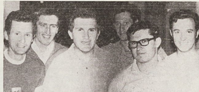
Naša namiznoteniška ekipa