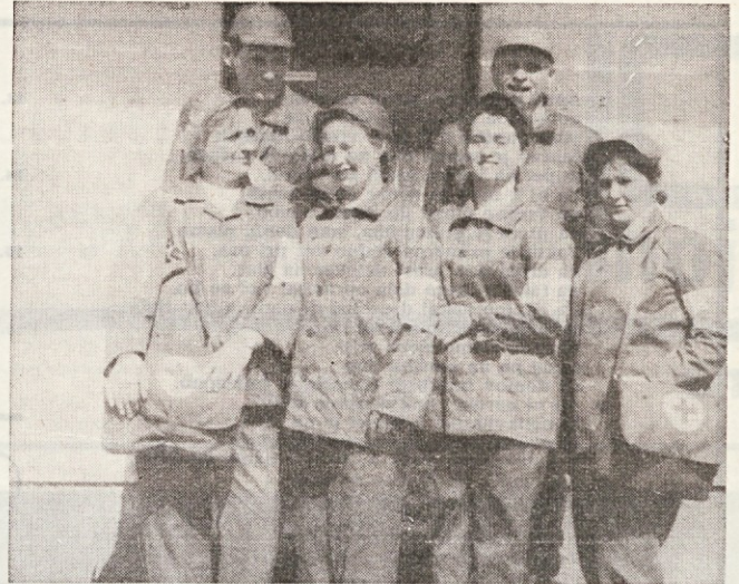
Tekmovalna ekipa civilne zaščite podjetja »Hoja« je v konkurenci ekip ljubljanskih podjetij zasedla petnajsto mesto