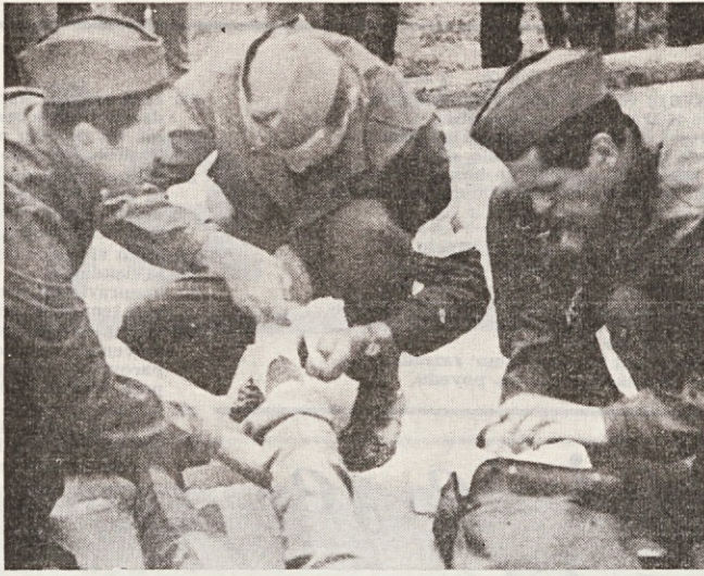
Ekipa prve pomoči iz SVEA se je na občinskem tekmovanju v Zagorju odlično odrezala in zasedla drugo mesto.