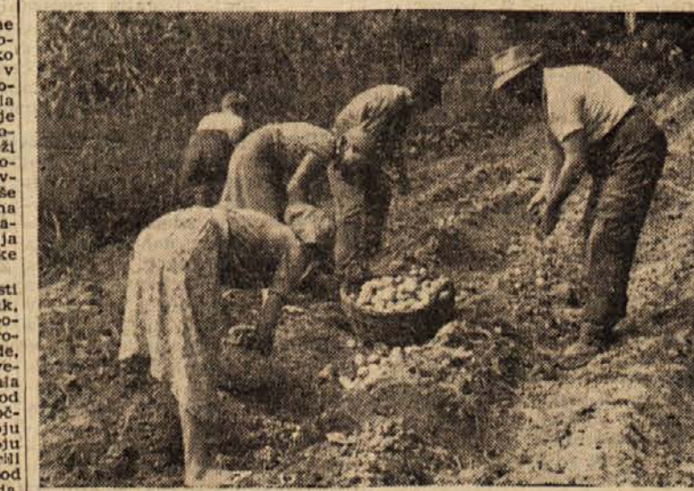
Krompir je letos zelo dobro obrodlil, čeprav mu je deževno vreme ponekod škodovalo. No, kjer je preveč gnul, so ga bolj zgodaj izkopali. Letošnje vreme pa je bilo naravnost idealno za krompir v prodnati zemlji

Pravočasna škropljenja proti peronospori omogočajo in zagotavljajo zelo zadovoljive uspehe tudi pri zatiranju drugih nevarnih bolezni in škodljivcev. Tako n. pr. dodatek kaloidnih žveplanih pripravkov, kot je »Cosana« k bordojski brozgi, zlasti in omejuje oidij vinske trte, pa tudi pršice okorinoze in erinoze ter bolj šiри na vinski trti in sadovnjakih. Pravočasno škropljenje omejuje ali popolnoma preprečuje širjenje nove glivične bolezni »Phomes«, ki povzroča sušico kabrnkov, kakor so pokazali vsi dosedajni poskusi in raziskovanja. L. J.