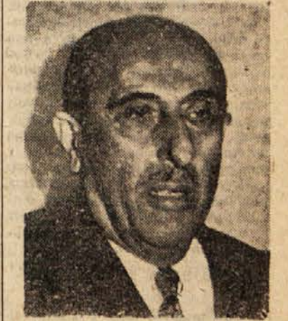
Sukri El Kuatli, novi predsednik Sirije

Kuatli je v prizadevanju, da bi potolažil svoje politične nasprotnike, pred nekaj dnevi napovedal potrebo po največjem upoštevanju upostavitve socialne pravičnosti in zboljšanja življenjskega standarda posameznikov. Da bi si pridobil