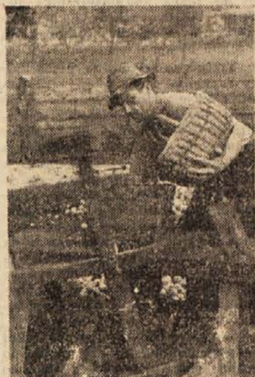
Sadni mlin v Beli krajini

Od vinogradništva živi pri nas skoro 100.000 družinskih članov. To je 7% vsega slovenskega prebivalstva, ki živi z intenzivnim delom na komaj 2,5% naših kmetijskih površin. En slovenski hektar rodnega vinograda je vreden eden do ena in pol milijona dinarjev, kar predstavlja samo za 10.000 ha naših najboljših vinogradov vrednosti od 100 do 150 milijard dinarjev.