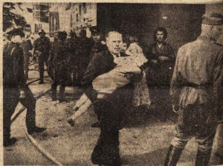
Prvega septembra je v velikem hotelu na Dunaju izbruhnil velik požar. Pri tem so štirje Rusi in štirje člani dunajske požarne obrambe izgubili življenje. Inozemski časopisi so poročali, da so mnogi sovjetski uradniki pokazali pri reševanju mnogo poguma. Naša slika prikazuje enega izmed visokih funkcionarjev, ko je rešil otroka pred smrtjo.

V bližini Sidi — Bou — Zida v Tunisu je kobra piliela velbloda. Lastnik je velbloda ubil, da bi mu prihranil muke. Nesreča pa je hotela, da mu je šla v glavo misel, da bi bilo dobro prodati velblodje meso prebivalcem velbloda vasi. Skrajni val so se zastrupili z mesom. En otrok je umrl, 260 vasičanov pa so prepeljali v bolnišnico.