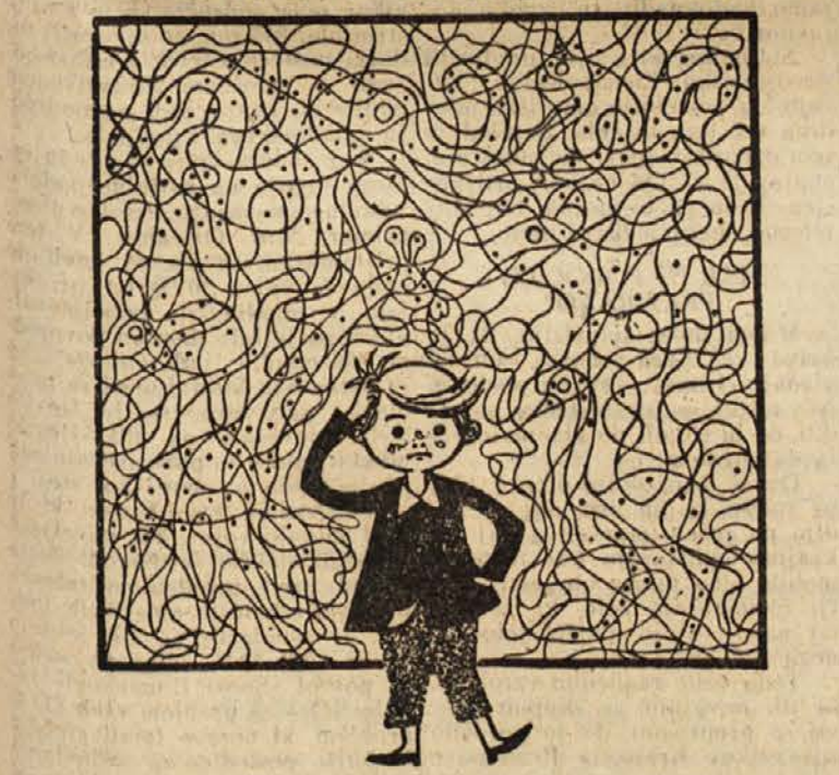
Vse ploskve, označene s pikami, pobarvaj. Dobili boste kar majhen živalski vrt: slona, veverico, psa, miš, žirafa in noja.