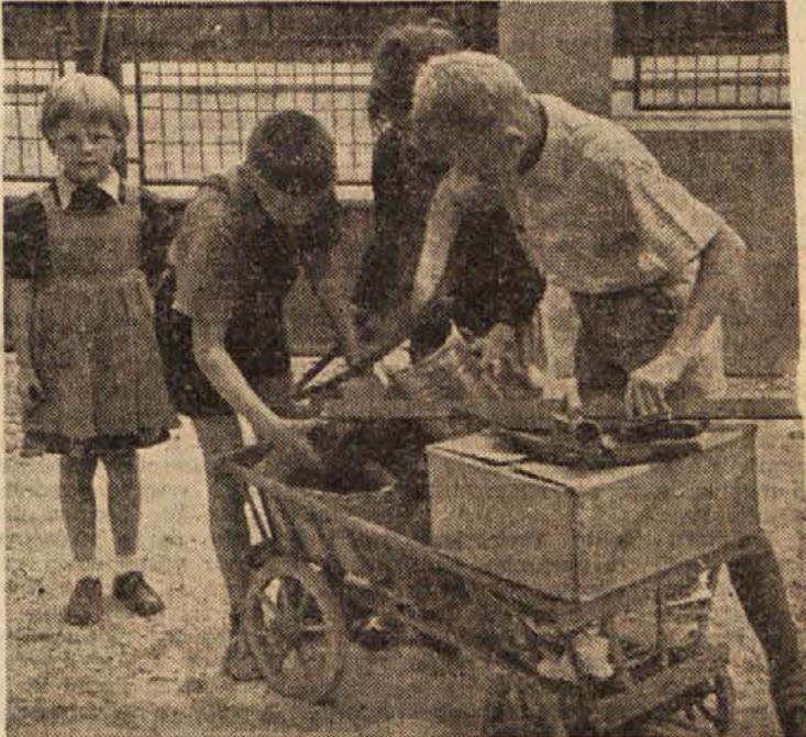
Med počitnicami smo pridno nabirali staro železo, so povedali otroci, ki jih vidite na sliki. Morda so si za denar, ki so ga zaslužili, kupili zvezke in druge šolske potrebščine