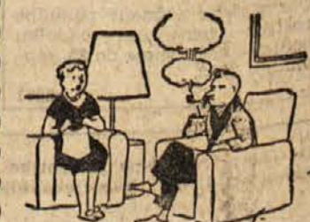
»Ah, že spet misliš na politiko!«