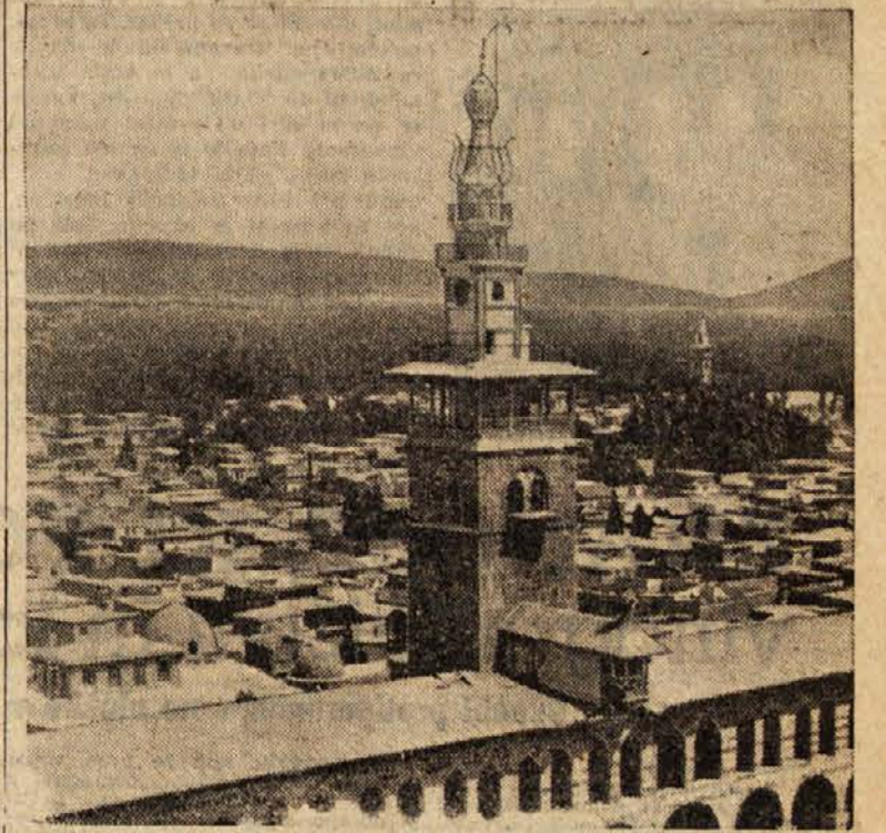
Pogled na Damask