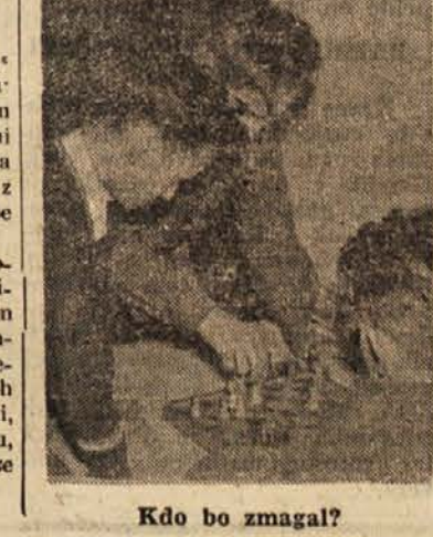
Kdo bo zmagal?

»Ljudje so zares nespametni,« pravi medved slonu, »kaj vse zahtevajo od nas živali! Jaz moram plesati, kakor mi godejo, jaz, resni medved! In oni dobro vedo, da takšne bedarije niso v skladu s mojim dostojanstvom. Zakaj bi se sicer smejali?« »Tudi jaz plešem, kakor mi godejo,« mu odgovori slon, »in mislim, da sem prav tako resen in vreden spoštovanja, kakor ti. Vendar se gledalci nikoli niso norčevali iz mene. Na njihovih obrazih sem videl le občudovanje. Verjemi, medved, ljudje se ne smejejo temu, ker plešeš, marveč temu, kako se pri tem opraviš obnašaš.« Lessing.