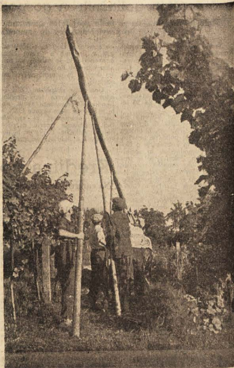
Elektrifikacija viničarij na posestvu v Zavrču

Treba pa bi se bilo pogovoriti o proizvodnji petiota, ki ga ljudje imenujejo tudi »kanigalileja«. Petiot so vinogradniki v vseh časih in v vseh krajih delali vedno za svoje potrebe. Vinski mošt so prodali ali pa so iz njega pridobili vino. Petiot pa so pripravili tako, da so na tropine nalili vodo ter dodali sladkorja. Ta sladkor je na tropinah prevrel, nato pa so vse skupaj ponovno stisnili. V času težkega plasiranja vina tega petiota vinogradniki niso upali nikdar prodajati za vino, marveč so ga uporabljali samo za lastne potrebe. V letih pomanjkanja vina pri nas pa so deloma proizvajalci, deloma pa tudi nekateri podjetja izkoristila to staro vinogradniško prakso za povečanje vinskih količin, kar je vredno graje. Edino petiot torej je brezvestni konkurent vinogradnikom, zato bi bila prepoved njegove proizvodnje koristna ali njegova prodaja ne bi smela imeti vinske oznake. JAK.