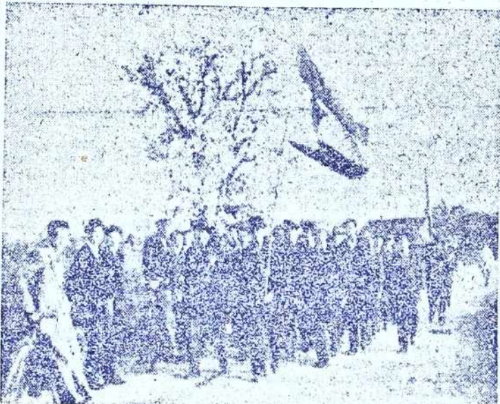
V začetku maja so se zbrali po vseh sektorjih sohoškega okraja frontovci, namenjeni v gozdne brigade. Brigadirji teh brigad zdaj zmagujejo na Jelovici in na Pohorju. — Na sliki: Prva prekmurska brigada odhaja v gozdove.

Moderen mlin, ki bo lahko vsak dan zmel 3 vagone žita, gradimo v Metkoviču v Dalmaciji. Obenem gradimo tam tudi skladišče, kjer se bo lahko shranilo 500 vagonov moke.