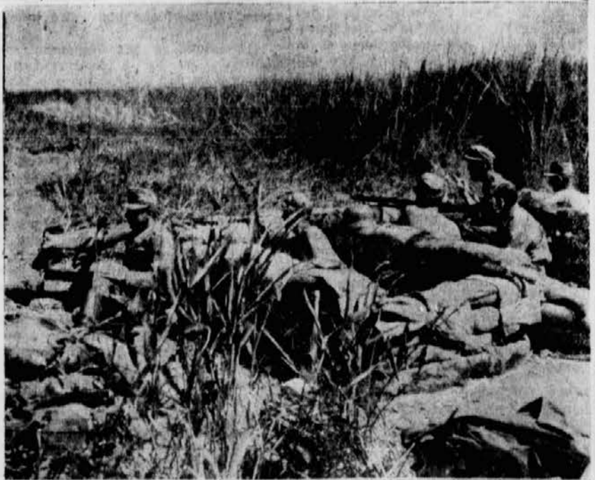
Im Sumpfböden des Kuban-Brückenkopfes

England ist also aus politischen und wirtschaftlichen Gründen gezwungen, auf den Bestand einer starken und leistungsfähigen Handelsflotte auch in Zukunft großen Wert zu legen. Es sieht sich aber in diesem Bestreben je länger desto mehr behindert und zurückgedrängt durch die Vereinigten Staaten, die unverhüllt und wiederholt den Anspruch angemeldet haben, die größte Handelsflotte der Erde zu besitzen. Man könnte vielleicht der Meinung sein, dieser Anspruch ließe sich einer anglo-amerikanischen Wirtschaftsgemeinschaft zuliebe auf ein für England erträgliches Maß herabschrauben. Einer solchen Lösung stehen indessen die Sorgen der Vereinigten Staaten im Wege. Es ist ihnen in den Friedensjahren bekanntlich nicht gelungen, die zeitweise auf 17 Millionen Menschen angewachsene Arbeitslosenrate zu beseitigen oder auch nur ausreichend zu senken. Der Mißerfolg auf diesem Gebiet ist ein Grund für die Kriegstreiber der Regierung in Wa-