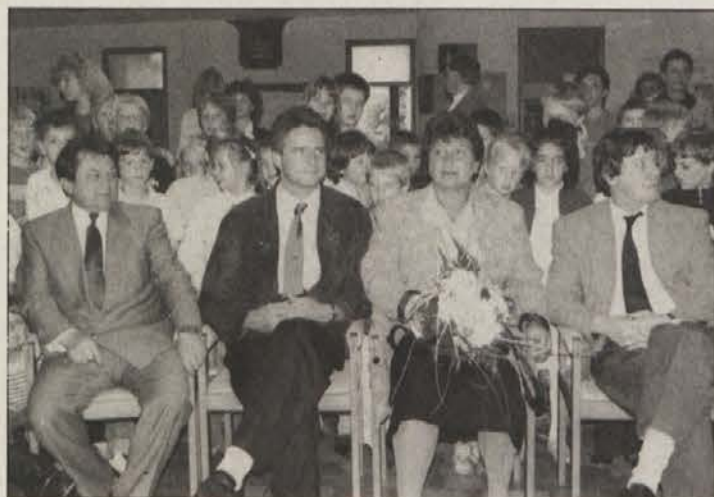
Ministrica Hawliček je obiskala tudi kotmirško šolo.

V ostalem pa je ministrica menila, da želi razvijati manjšinsko šolstvo: „Šolstvo narodne skupnosti ne sme propasti zaradi finančnih razlogov. Vesela sem, da je bilo v zadnjem času razvitih več novih učnih pripomočkov. Prav v tej smeri nameravam tudi v bodoče podpirati razne dejavnosti!“