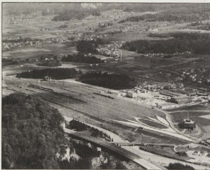
Pogled na 40 tirov ranžirnega kolodvora Brnca.