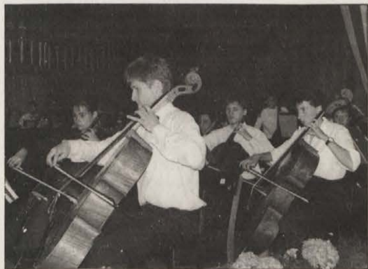
Mladi glasbeniki med koncertom.