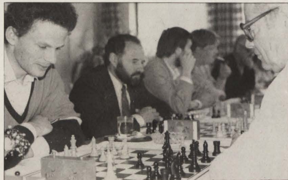
Korošci in Primorci med prijateljskim dvobojem na štiriinšestdesetih poljih.