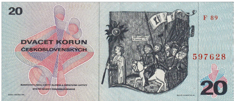
Figure 1: Representation of the Hussite general Žižka in the codex Antithesis Christi et Antichristi from the turn of the 15th century and on the reverse of the 20 Czechoslovak crown banknote.