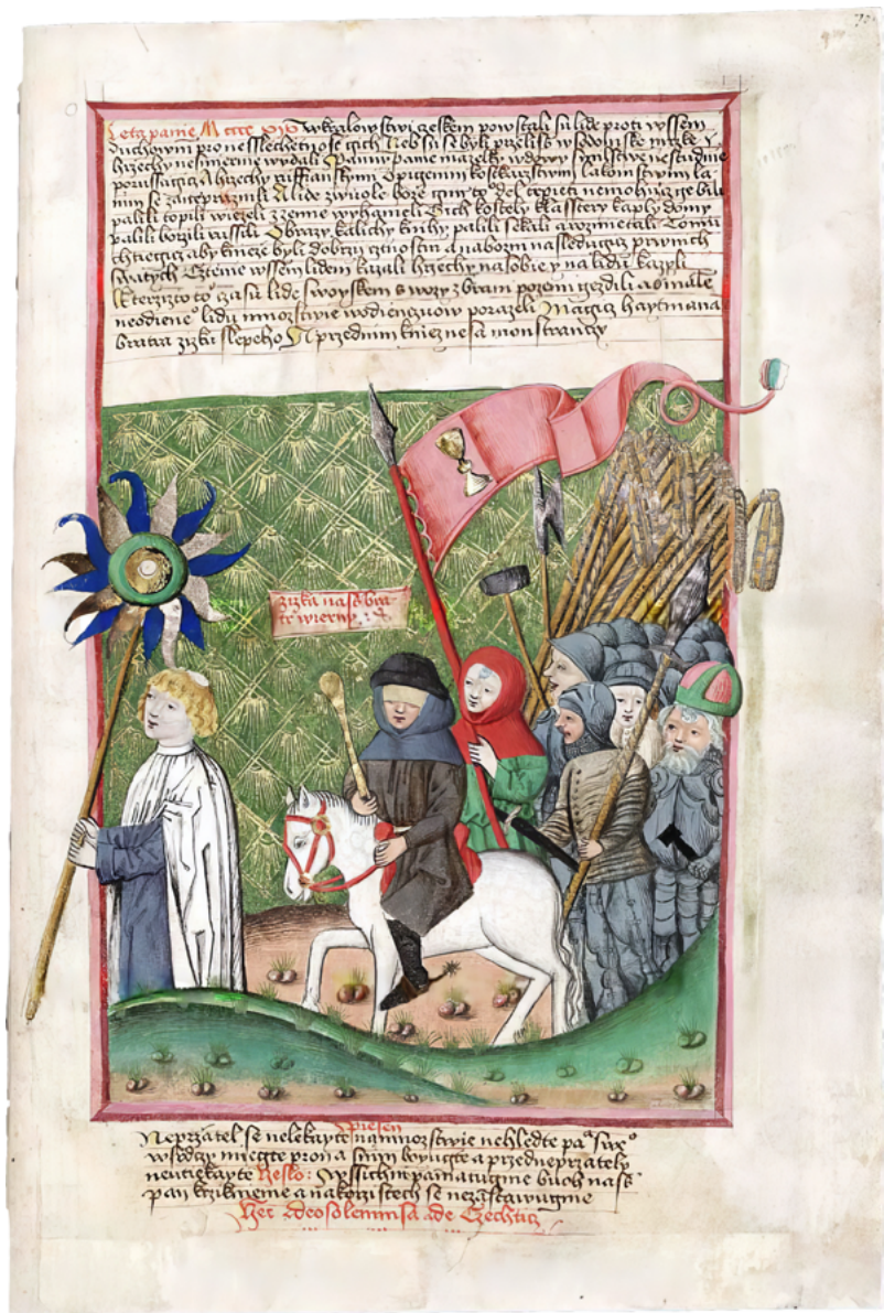
Slika 1: Upodobitev husitskega generala Žižka v kodeksu Antithesis Christi et Antichristi s preloma 15. stoletja in na hrbtni strani bankovca za 20 čehoslovaških kron