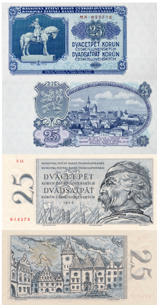
Slika 2: Žižka na bankovcih komunistične Čehoslovaške Figure 2: Žižka on the banknotes of communist Czechoslovakia.

Toda: ideološki krmarji zgodovinarskega dela se v epohi komunističnega totalitarizma po navadi niso imeli ne časa ne volje minuciozno muditi ob prav vseh meandrih in rokavih zgodovinskega toka, zlasti ob takih ne, katerih nepristrana kritična analiza bi utegnila marksistični tezni pogled na zgodovino razkriti kot