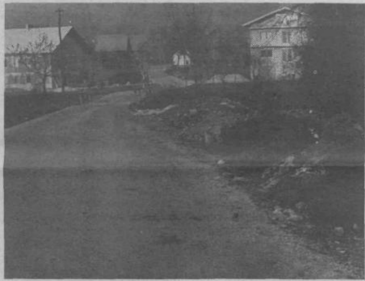
Ob cesti, ki pelje na Lipoglav, je tole divje odlagališče smeti

Organi SDK so pri krivcih nalezeli na hud odpor in nerazumevanje. Le-ti so jih na vse mogoče načine skušali ovirati pri delu, kar je razvidno tudi iz uradnega zapisnika inšpektorja