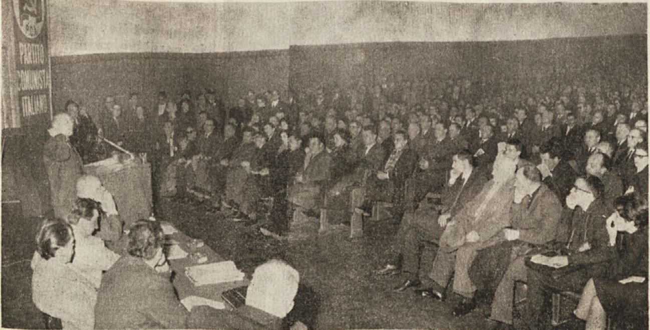
Zaključni del deželne konference KPI je bil v kinu «Arcobaleno», kjer je govoril tudi član osrednjega vodstva KPI tovariš Giancarlo Pajetta

O deželni konferenci komunistov poročamo tudi na 3. 4. in 6. strani.