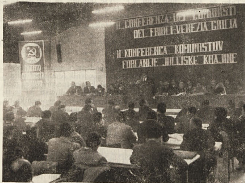
Tovariš Silvano Bacicchi bere tajniško poročilo

Toda povezovanje z «atlantsko politiko», proglašanje zve-