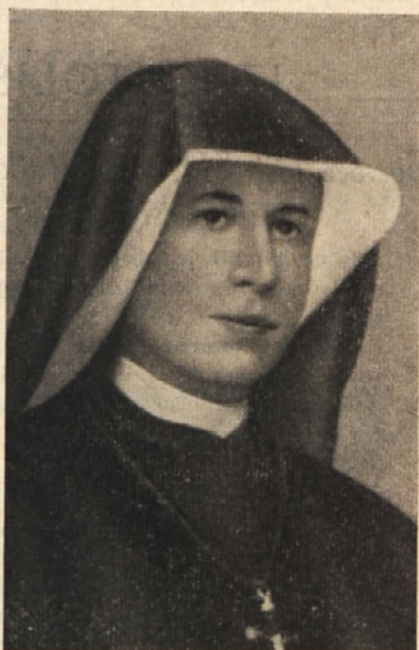
S. Marija Favstina Kowalska

Sestra Faustina je bila iz zelo preproste kmetijske družine. Njena vzgoja na domu je bila zelo pomanjkljiva; le za silo je znala čitati in pisati. Toda že izza nežne mladosti se je odlikovala v pobožnosti in previdnosti. Ker je čutila veselje do redovniškega poklica, je z 20. letom starosti vstopila v samostan redov-