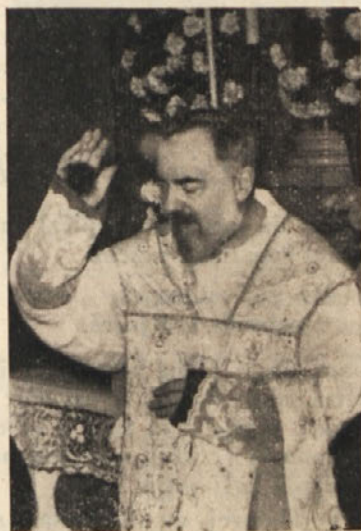
Pater Pij med sv. daritvijo

Vožnja, ki je trajala nekaj čez eno uro, ni bila dolgočasna, kajti pogovori potnikov o patru Piju so bili tako zanimivi, da jih je bilo vredno poslušati. Nekateri so o njem vedeli povedati čudovite stvari. Med drugim sem tudi izvedel, da nekateri že kmalu po polnoči gredo čakati pred vrata samostanske cerkvice, kajti