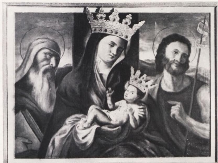
V MOLITVI PRED MILOSTNO PODOBO SVETOGORSKE KRALJICE