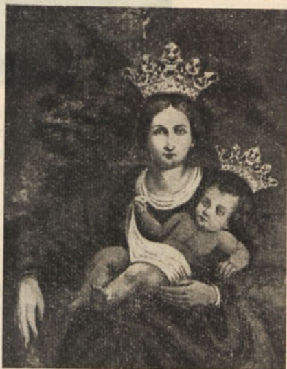
Mati Božja na Kostanjevici

L. 1811 je Marmont, guverner ilirske province, Kostanjevico izročil frančiška-