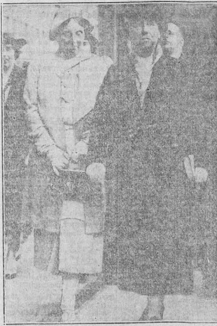
Nizozemska kraljica Vilhelmina (na desni), ko je nedavno prispela v Anglijo, namenjena, da na Škotskem preživi mirne počitnice. Spremljala jo je njena hči, princezinja Julijana (na levi).