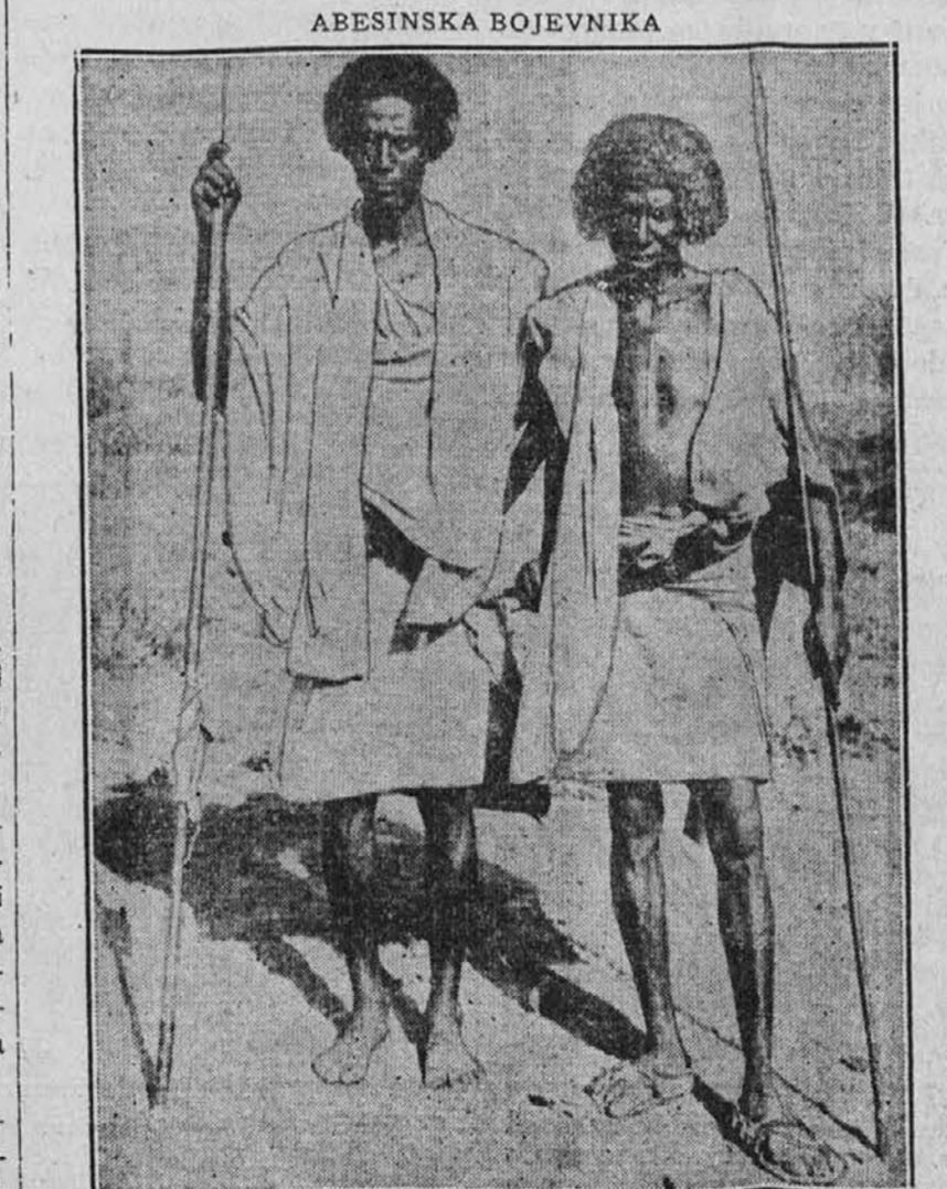
Dva možakarja, iz kakoršnih je sestavljena abesinska armada, s katero si bodo pogledale italijanske čete iz oči v oči. Kakor kaže slika, sta oborožena samo s sulicami, toda trdi se, da bo njih junaštvo daleč odtehalo vse italijanske moderne priprave.

"Amer. Slovenec je dediščina naših pionirjev in te dediščine ne damo iz rok prej, kot na smrtni postelji ameriškega lovenstva."