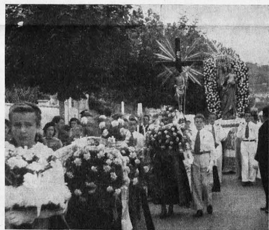
Prizor z vsakoletne procesije s kipom rožnovenske Matere božje v Barkovljah. Letos bo to nedeljo 6. oktobra takoj po peti sv. maši, ki se prične ob 7. uri zjutraj.