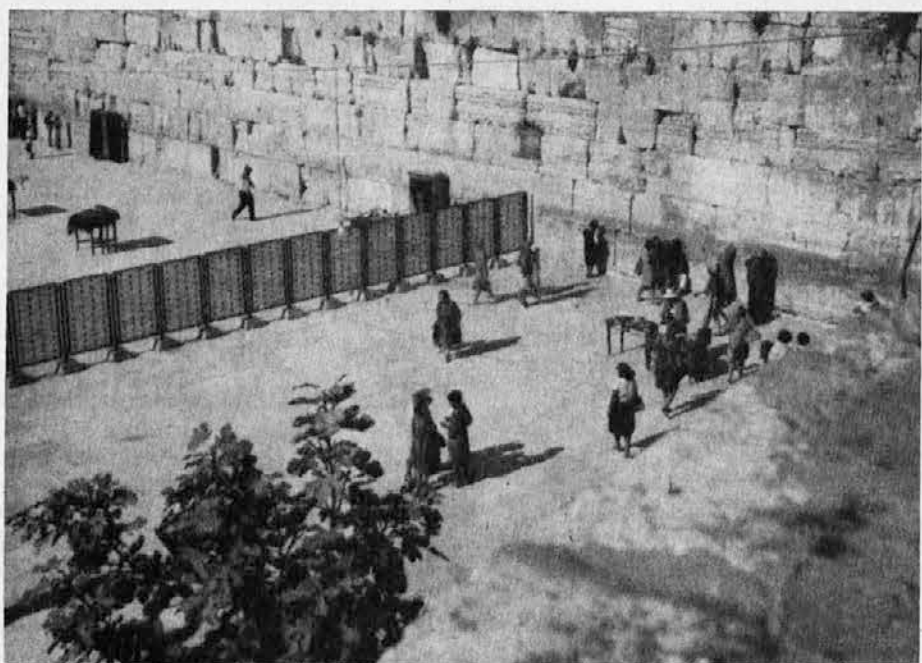
Zid objokovanja v Jeruzalemu — Ženski del