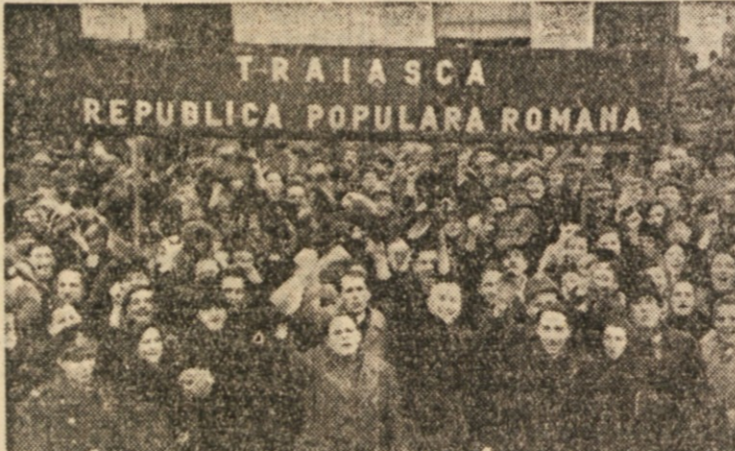
TEDE V SLIKAH: ROMUNI NAVDUŠENO MANIFESTIRAJO NA ULICAH BUKARESTE OB PROGLASITVI REPUBLIKE, ENAKE MANIFESTACIJE SO SE VRSILE PO VSEH MESTIH IN TRGH.

to tam čaka kotel ministe ali polente, če ni bilo mogoče boljše- ga, pa tudi čaka vina včasih Stari borci, stari veterani, ko so bili na Barke, so menili, da so v roju. Seveda, Barčan je prav tak človek kakor sem jaz ali pa ka- kor si ti, ubožec, ki za svoje grehe berš te vrsilce. Bili so trenutki, ko je kipeł od navduše-