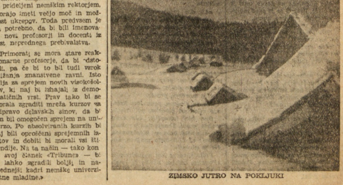
ZIMSKO JUTRO NA POKLJUKI