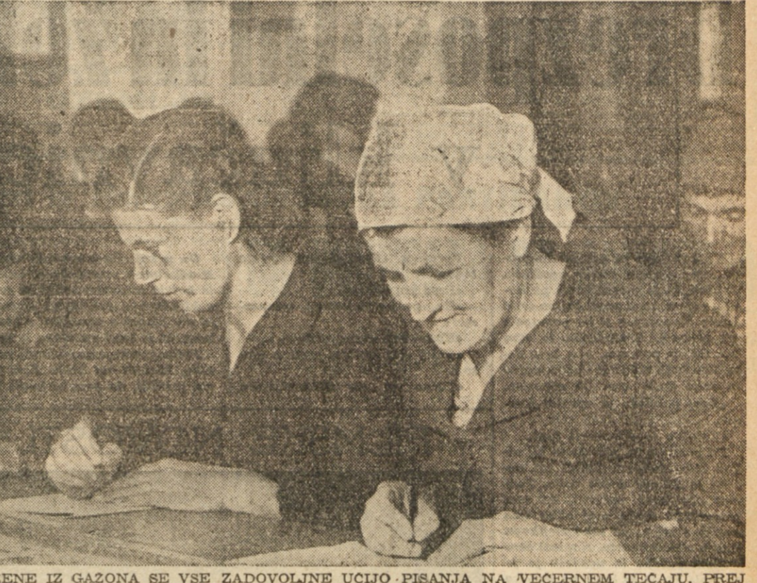
ZENE IZ GAZONA SE VSE ZADOLJIVNE UCLJO PISANJA NA VEČERNEM TEČAJU. PREJ VSEGA TEGA NISO MOGLE, KER SO NOC IN DAN MORALE GARATI, KER JE GOSPODAR ZAHTEVAL POLOVICO PRIDELKA, KI JIM SEDAJ VES OŠTANE.