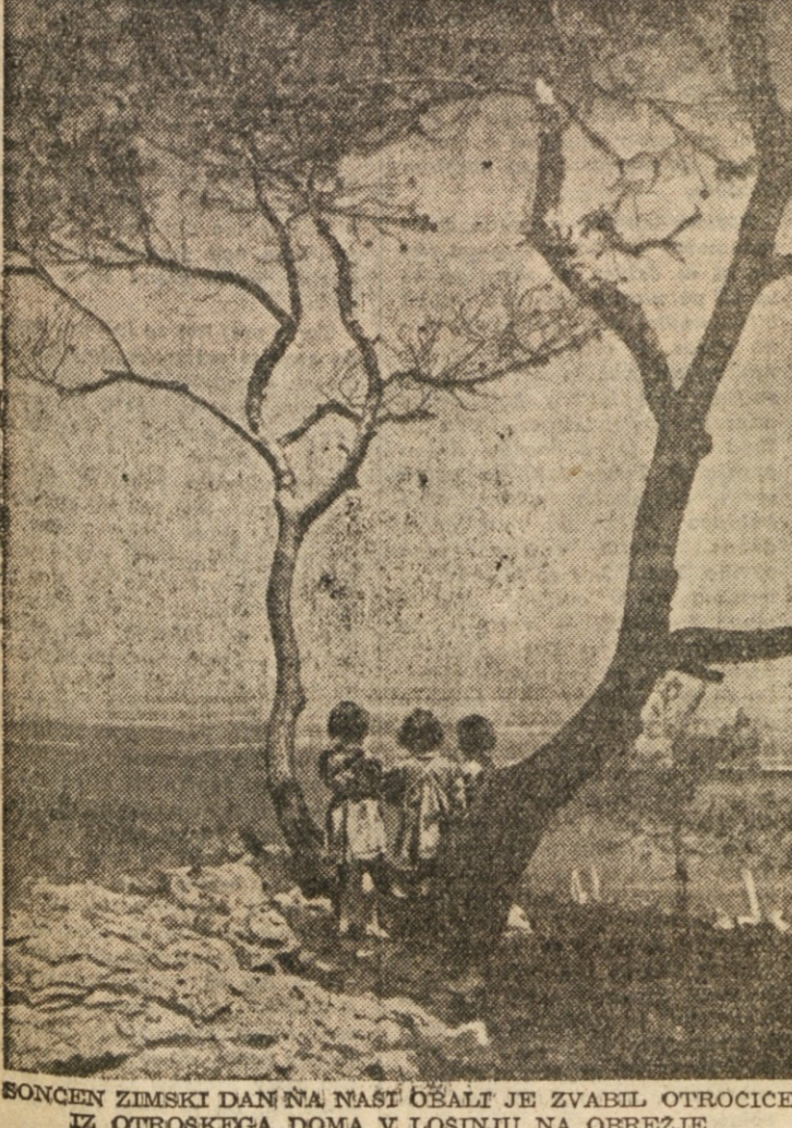
SONCEN ZIMSKI DAN NA NAST OBALTI JE ZVABIL OTROČICE IZ OTROSKEGA DOMA V LOSINJU NA OBREZJE.

zadruge (Sageto), katero so ustanovili bivši koloni. V prvem primeru so ustanovili zadruge mali posestniki, s tem da so združili svojo zemljo, mrtve in živ inventar ter začeli zemljo obdelovati skupno, skupno gojiti govedo, prasice, itd. V drugem primeru so pa bivši koloni sklenili obdelovati del nezadelejnega zemljišča, ki jim je pripadel po agrarni reformi, skupno poseljujejo se pri tem in tudi za obdelavo svoje privatne zemlje, skupnega mrtvega in živčnega nezadelejnega inventarja. Na vsaki način je v prvem primeru zadruška zavest dosegla naj-