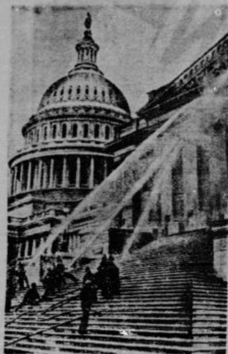
Četnik v gosti... tem se že zdaj pripravlja na nove gospode. Gostje so nastopili s svojimi brizgalnkami, da bodo puščje Capitola tem bolj prenosili za Roosevelta in njegove.