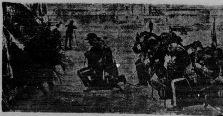
Mussolini pred Neznanim vojakom v Rimu

Kakor v vseh državah imajo tudi v Rimu grob neznanega vojaka, ki se nahaja ob vmožju ogrmejnega spomenika Viktorja Emanuela I. Vse važnejše parade se vrše na tem prostoru. Tudi Mussolinijevo stanovanje je v bližini (v palači bivšega avstrijskega poslanika).