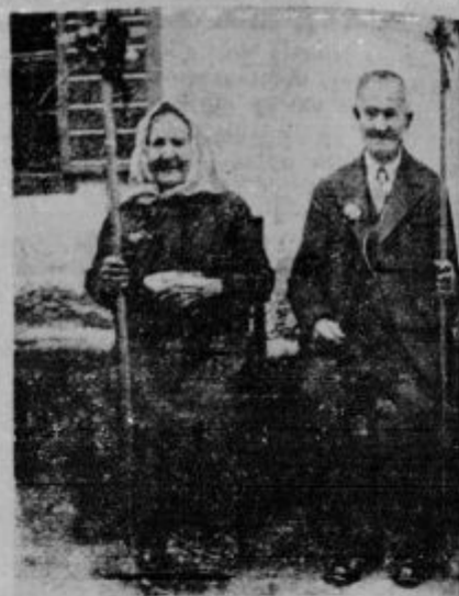
Zlata poroka (Ločica na Vranskem)

Kljub enoletnemu močnemu prometu se cesta, ki je prekrita z jeklenimi ploščami, ni še prav nič pokvarila. — V Ameriki so namreč zgradili cesto, ki je rešila problem neizrabljivosti prometnih cest. Za podlogo so postavili jeklene plošče, ki so tesno med seboj povezane, v spranje pa je vlit beton. Tudi beton se ni izrabil, ker ga plošče varujejo. Tako ne morejo kolesa voz in avtomobilov niti malo upogniti ceste. Ta način graditve je sicer drag, pa se vseeno izplača, če izračunamo vse ogromne stroške za popravila navadne ceste.