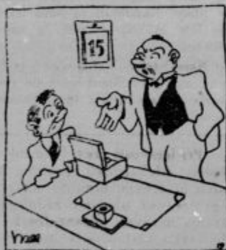
Sel... v bagajni manjka 100 dinarjev. Samo ti in jaz imava ključ do nje. — Učenec: »Potem pa predajam, naj vsakdo od nasu dveh vplača po 50 Din... zadeva naj ostane skrivnost med...«