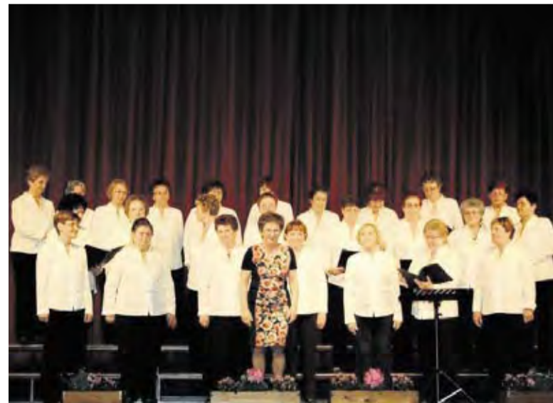
Ženski pevski zbor Stane Habe

kulturnih društev, zelo dobro poje veliko pevskih zborov, ki program črpa po tako iz zakladnice slovenske narodne pesmi kot pesmi domačih in tujih