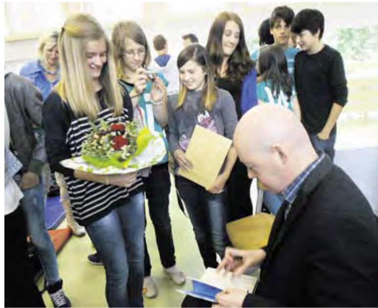
John Boyne podpisuje knjige na OŠ Rodica