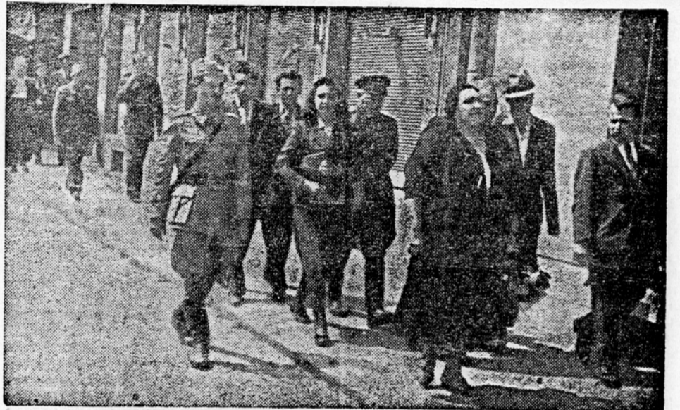
Kijevski umetniki na ljubljanskih ulicah

VSE DOHODKE TEGA KONCERTA SO SOVIJETSKI UMETNIKI NAMENILE RANJENCEM JUGOSLOVANSKE ARMADNE