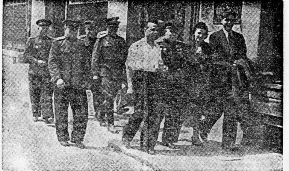
Kijevski umetniki na ljubljanskih ulicah

enotne delavske strokovne organizacije. Te so danes tista naša armada, ki naj mobilizira, ki naj združi vse delavstvo brez razlike, vse poštene delavce, vse proletarce, vse nameščence, in jih organizirano povede v borbo za utrjevanje naše svobode.