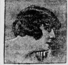
Zakaj sem izbrala „Jaky“ za odstranjev nepotrebne dlačice.