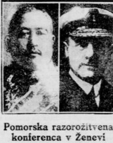
Pomorska razorožitvena konferenca v Ženevi

Bridgeman (Anglija, zgoraj levo), Gibson (USA, desno), admiral Saito (Japonska, spodaj levo) in admiral Jellicoe (Avstralija, desno).