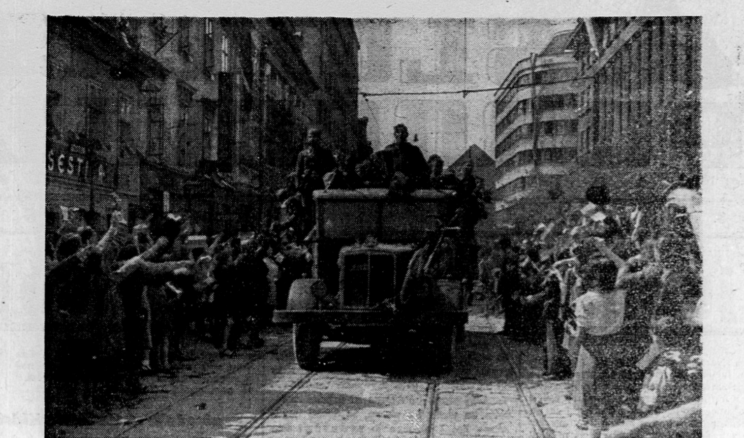
Tako je zmagovita Narodna vojska osvobodila Ljubljano