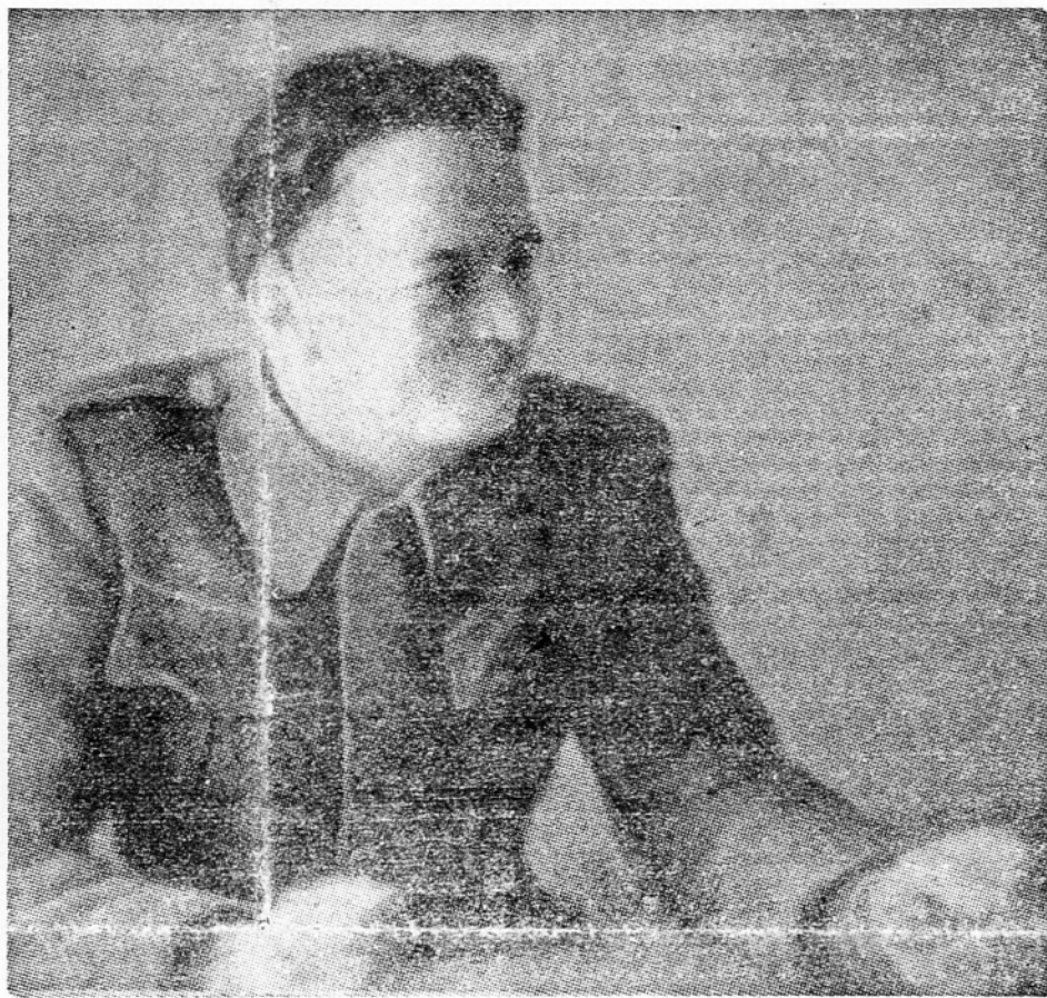
Boris Kidrič predsednik prve narodne vlade Slovenije

Tovariši in tovarišice! Bela Ljubljana! Verjemite mi, da nisem še nikoli v svojem življenju govoril tako težko kakor bom govoril danes. To pa zato, ker me ni še nikoli v življenju navdajal občutek tako popolne sreče kakor me navdaja danes. Občutek tiste popolne sreče, ki lahko navdaja človeka samo takrat, kadar vidi osvobojeno tako ponosno, tako hrabro narod kakor je naš, kadar vidi tako ponosno, tako hrabro njegovo prestolnico, kakor je naša bela Ljubljana.