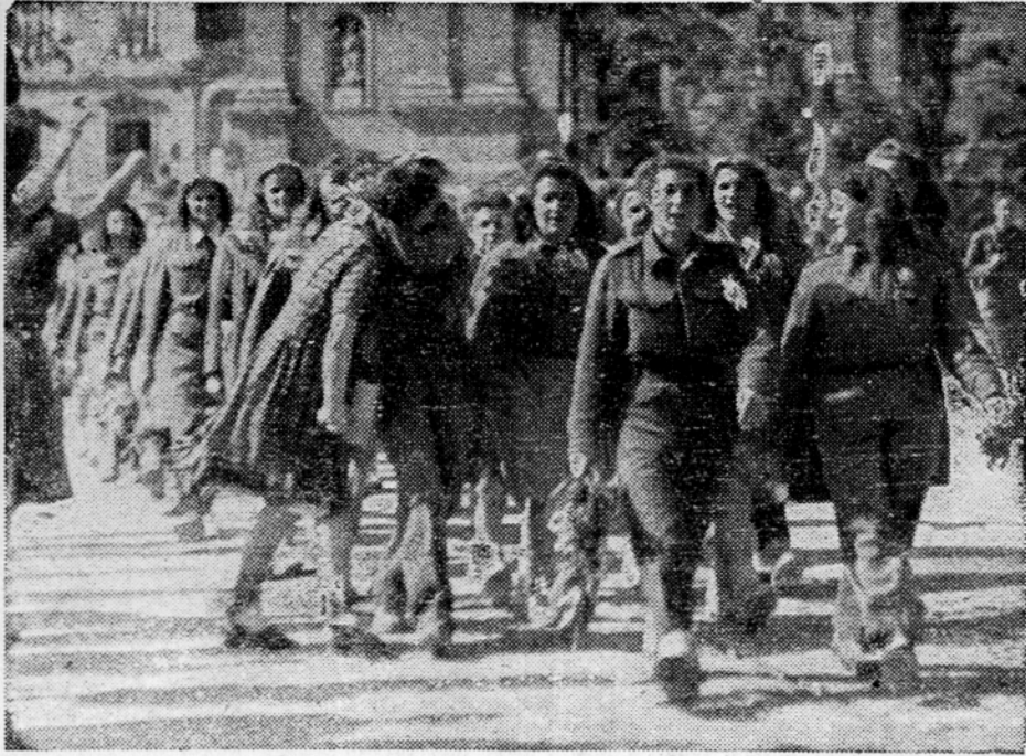
Štrumni koraki naših prvih partizank na osvobojenem tlaku ljubljanskih ulic

Ljubljana, 10. maja. Ljubljana je še dalje vsa v prazničnem razpoloženju. Po silnem opoju dneva vstajenja se je ob nastopu policijske ure umirila. Bajna večerna slika: vsa Ljubljana spet v lučeh, nič več ni bilo treba zatemnjevanja. Radio pa nam je poskrbel za zdravo in sočno domače razvedrilo. Srečne smo se to prvo noč počutili ob za-vesti, da je resnično zavladal mir in da smo v skrinem varstvu naše hrabre vojske, ki se je razmetila po vsej Ljubljani in zastražila vse mestne okraje. Noč, kakršne smo doživljali pred leti. Kako daleč je vse to že za nami! A saj še nikoli ni bilo tako, kakor je zdaj, naša sreča je šele zdaj popolna.