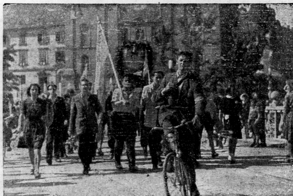
Mladina na pohodu skozi Ljubljano: za podobo maršala Tita, vodnika v bodočnost