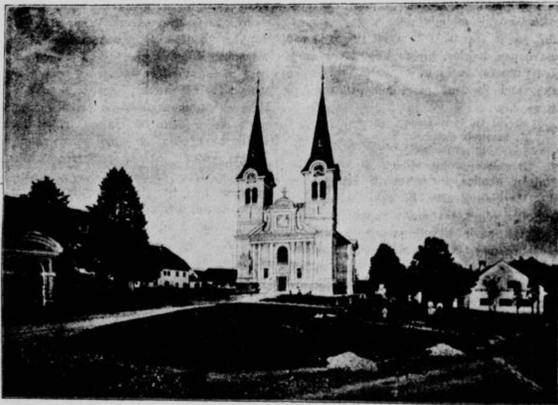
Nova cerkev pri Devici Mariji v Polju.

25letnici. Dva č. g. župnika sta pred kratkim