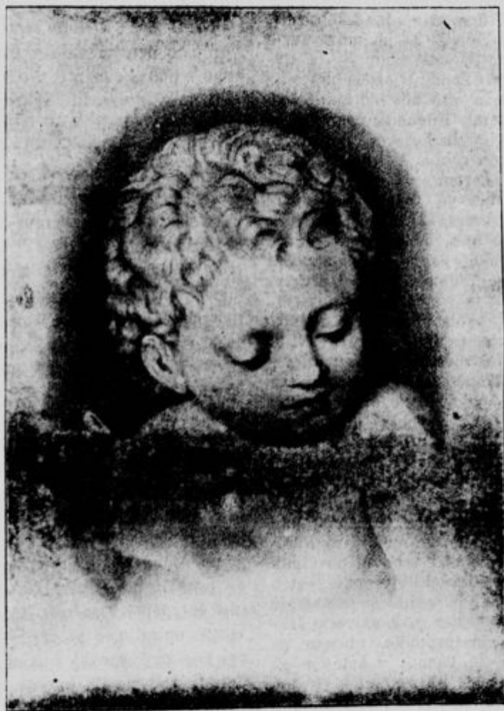
„In Detetu je bilo danò ime Jezus.“

Bolgarski knez Ferdinand je po dolgem odlašanju le sprejel ostavko Karavelovega ministerstva, ki ni imelo več v sobranju zaupanja. Sostavo novega kabineta je poveril Danjevu, ki je res v primeroma zelo kratkem času rešil svojo nalogo. Predsedstvo in zunanje zadeve je prevzel sam