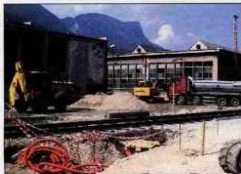
Območje nekdanjega Fiproma v stečaju že komunalno urejajo.

evropskega denarja. Komunalno urejanje naj bi bilo končano prihodnje leto, potem pa bo sledila druga faza projekta, v kateri bodo začeli obnovo objektov in gradnjo novih. To fazo bo vodil poseben konzorcij, ki deluje po načelu javno-zasebnega partnerstva, poleg Občine Jesenice pa ga sestavlja še enajst gospodarskih družb. Po načrtih naj bi v južnem delu območja prostor dobile mestotvorne dejavnosti, kot so knjižnica, izobraževalno središče, razvojni center, muzejaki kompleks in tržnica. V severnem delu območja pa bodo poslovne prostore dobile gospodarske družbe.