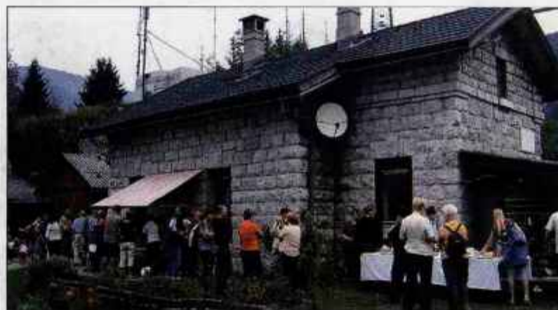
Udeleženci dneva odprtih vrat pred hišo komune Žarek

O načrtih pa pravi, da nameravajo do zime v lopah