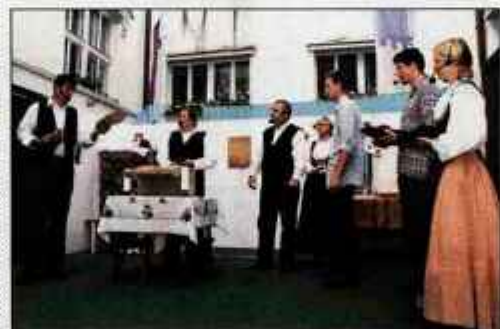
Celovška komisija je sprejela vajenca in vajenko med pomočnike.

akrobacije s štrikolesnikom, mlade je čakal zabavišni park, predstavljali so se lokostrelci, kinologi in športni plezalci, v mesto pa so se pripeljali tudi vozniki starih motorjev in avtov. Nastopili so člani folklorne skupine Karavanke, Pihalni orkester Tržič, razne plesne in glasbene skupine. Tržičski gasilci so pripravili kar dve veselici. Ob tako pestrem programu so ostali obiski vidnih političnih osebnosti kar malo v senci sončne nedelje.