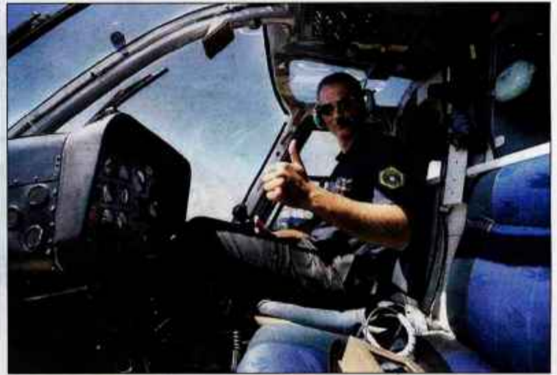
Letalske posadke slovenske policije so na Brniku v stalni pripravljenosti.

Nadzor rizičnih prireditev pa je samo ena od nalog LPE. "V prvi polovici leta je bilo naše delo povezano predvsem z nalogami v okviru predsedovanja Slovenije Svetu EU. Po zaključku teh nalog se je ravno začela poletna turistična sezona, v kateri se močno poveča število potreb po uporabi policijskih helikopterjev. Po eni strani gre za nadzor prometa iz zraka, po drugi strani pa se poveča opravljanje humanitarnih nalog, to je helikopter-