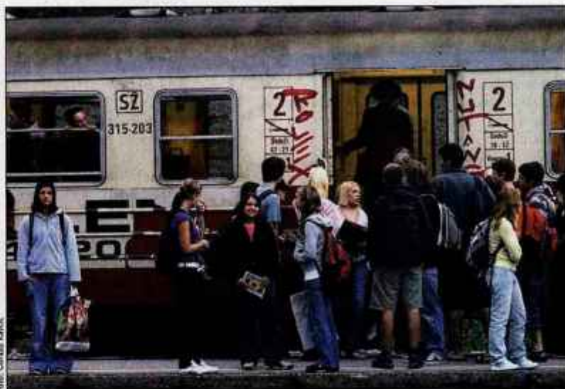
Medtem ko avtobusi ponavadi dijake pripeljejo bližje šoli, pa so vlaki cenovno ugodnejši.

Vozovnica od Kranja do Ljubljane stane 3,60 evra za avtobus in 2,10 evra za vlak. Vendar pa dijakom tako pri prevozih z avtobusi kot vlaki ponujajo številne ugodnosti, uveljavljajo pa lahko tudi subvencijo k ceni mesečne vozovnice. Dijaki, ki so upravičeni do subvencioniranja prevoza, morajo oddati vlogo, ki med drugim vsebuje podatke o socialnem položaju upravičenca, oddaljenosti kraja bivanja od kraja šolanja, možnosti bivanja v dijaškem domu ter višino štipendije in dodatka za prevoz. Pri Slovenskih železnica ponujajo tudi možnost izpolnitve e-vloge za subvencionirano šolsko vozovnico. "Dijaki, vajenci in študenti lahko na naši spletni strani izpolnijo elektronsko