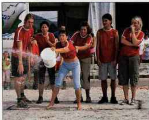
Ekipa Jezerkega med lovljenjem vode v vedro

Na veselih igrah gorenjskih občin v Žirovnici se je že tretjič najbolj izkazala ekipa z Jezerkega.