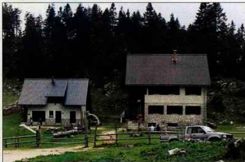
Dom na Menini planini

Nadaljujemo naprej po levi cesti, kar je mruka, saj je hoja po makadamu mukotrpna. Če boste dobro opazovali, boste občasno zasledili