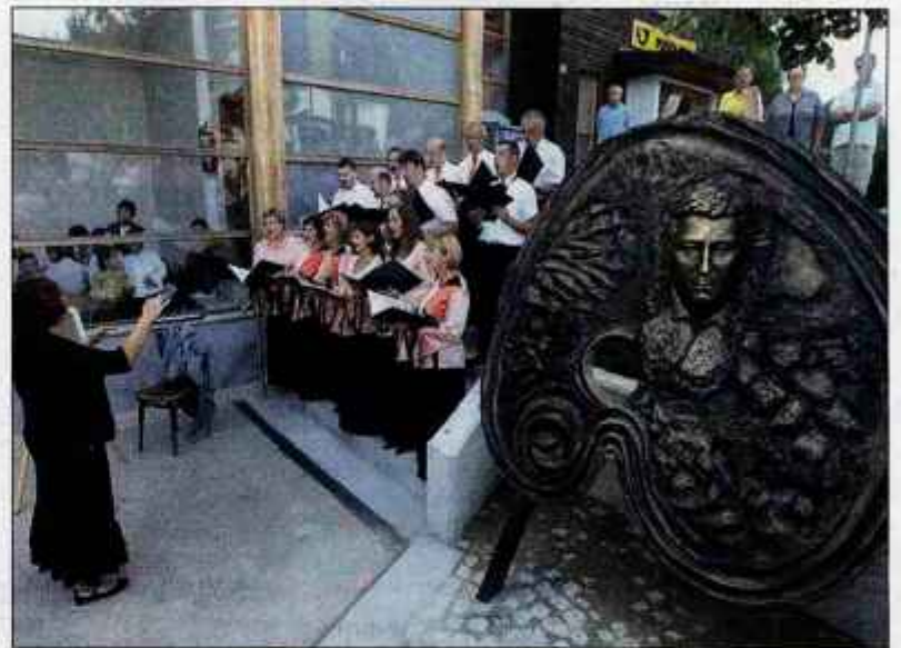
Spomenik Matevžu Langusu pred domom krajanov v Kamni Gorici