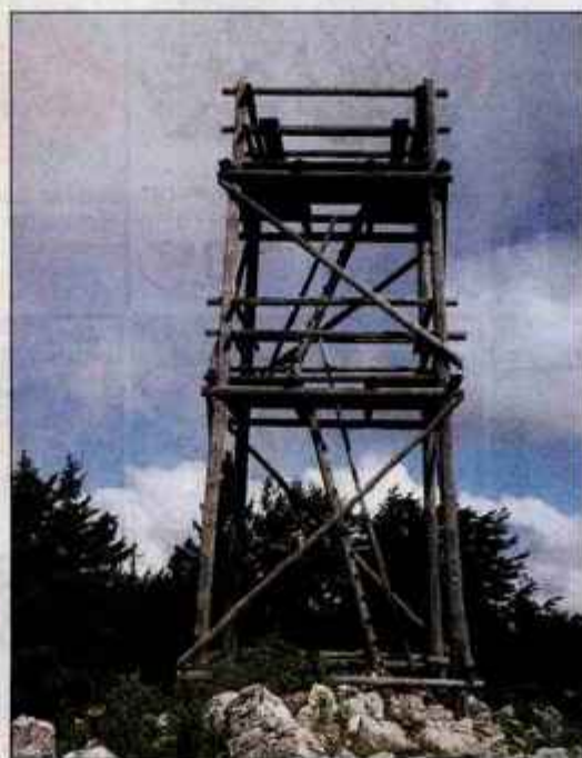
Razglednik na vrhu Vivodnika