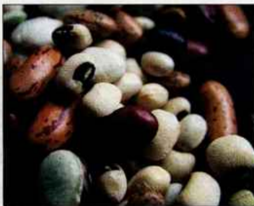
Glede na barvo in velikost zrn danes razlikujemo več kot petsto sort fižola.

Ljudska medicina zoper revmo težko najde boljše zdravilo od fižolovih luščin. Priporoča prevretek iz fižolovih luščin, ki ga pijemo dvado trikrat na dan ter kopel v vodi, v kateri smo skuhalih fižolove luščine. Po kopanju moramo leči v posteljo in se dobro segreti, tako da se močno preznajimo. Proti sladkorni bolezni na drobno narežemo dvesto gramov fižolovih luščin in jih kuhamo v enem litru vode na šibkem ognju približno pol ure. Pustimo stati čez noč, nato precedimo in pijemo po en kozarec vsake pol ure. Za lažje mokrenje kuhamo petdeset gramov luščin petnajst minut v pol litra vode, pustimo prevretek stati tri ure, nato precedimo in pijemo trikrat na dan pred jedjo. Proti vnetju ledvic pa zmešamo pet žliček na drobno narezanih luščin in ero žličko na drobno narezanega peteršilja ter listov in cvetov rmana. Mešanico prelijemo s šeststo grammi vrele vode, pustimo pokrito dve uri, nato precedimo in pijemo po dvesto gramov trikrat na dan pred glavnimi