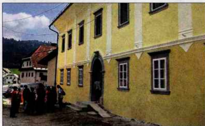
Veličastna pristava loških gospodarjev v Žireh s fasado dobiva končno podobo.

Novi Muzej Žiri, kjer bodo na ogled najprej postavili čevljarstvo in čipkarsko zbirko, se danes že ponaša z novo fasado, ki končno kaže, kako veličasten objekt stoji v Žireh. Pred delavci je v teh dneh še montaža oken v prvem nadstropju, restavriranih stopnic in svetil, sledila bosta še zadnji oplesk in vgradnja tlakov. Pečelinova zagotavlja, da je za Muzej Žiri pripravljena tudi vsebina, za katero pa bo potrebnega še nekoliko več časa. V prtiličju bo sprejem-