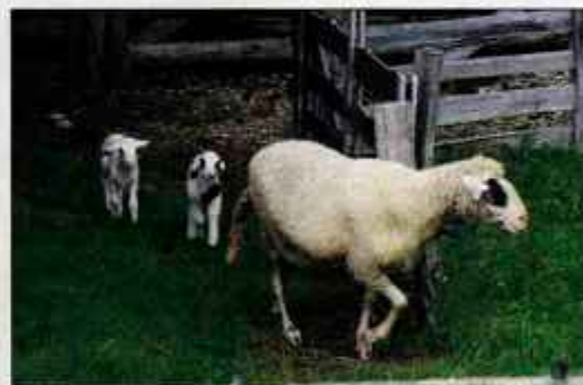
"Lej, dva backal!" Vskandanjik na planini Biba.

lahko obledele markacije, ki jim sledite. Šli boste mimo nekaj vikendov in po približno 45 minutah hoje, prestopili prvo lesno. Na vaši desni strani bo pašnik, vi pa hodite po levi strani pašnika, skozi smrekov gozd. Tukaj pozor! Markacij ni. Na koncu gozda pridete do zaraščenega travnika, kjer pa je vidna stezica, ki jo uporabljajo planinci. Sledite stezi in pridete na večjo stezo, kjer se markacije znova pojavijo. Sledite poti, ki je občasno prava goščava. Naj vam zaupam, da boste do vrha Vivodnika vsaj 12-krat prestopili lese pašnikov, kjer pa, ko sem jaz tam hodila, ni bilo nobene živine. V zadnjem delu se pot vije čez pašnik, sledi kratek del gozda, markacije so ves čas dobro vidne, potem pa spet pri-