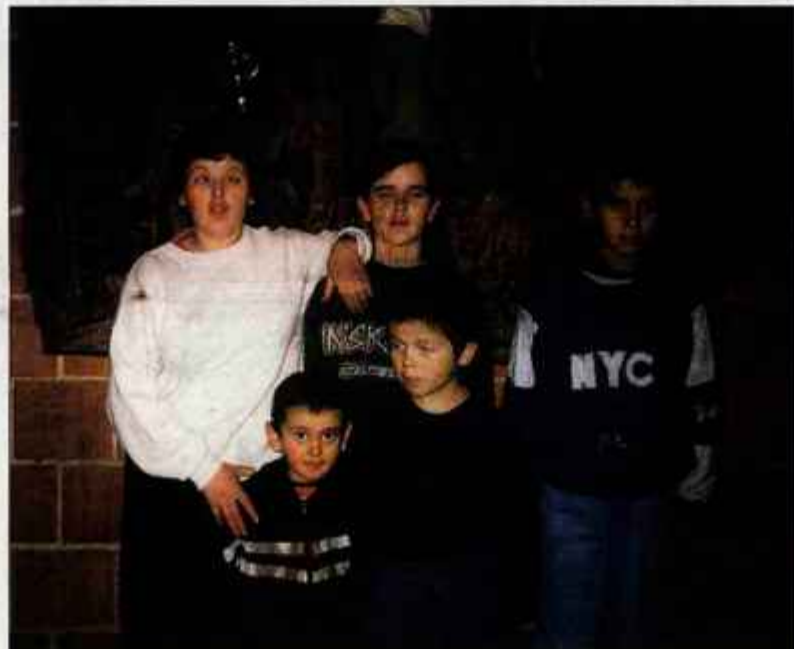
V družini s sedmimi otroki je kar pet otrok slepih (na fotografiji dva starejša otroka manjkata). Operacija v Sloveniji bi jim lahko vrnila vid.