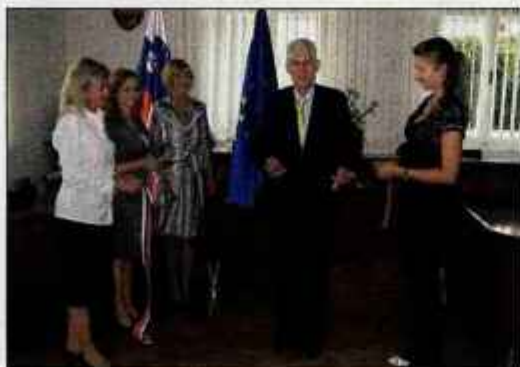
Minister Lovro Šturm je izpostavil prizadevanja za organiziranje dela sodišč na skupni lokaciji.

V zadnjih štirih letih so v sodniški stavbi zamenjali tudi vse pisarniško pohištvo, kupili detektorska vrata in drugo varnostno opremo, v prihodnjih tednih pa bodo uredili še varnostno razsvetljavo in prenovili stopnišče.