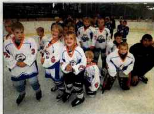
Predstavilo se je vseh sedem selekcij HK Triglav Kranj. Najmlajši obiskujejo hokejsko šolo.