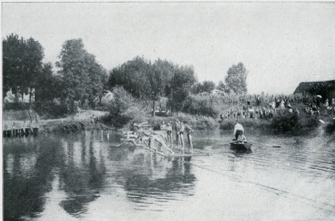
Plavalne tekme na Ljubljanici: Start juniorjev.

Tekma je potekla v najlepšem soglasju, brez nesreč, protestov ali kakih drugih incidentov. Obvladal jo je pravi tovariški sportni duh.