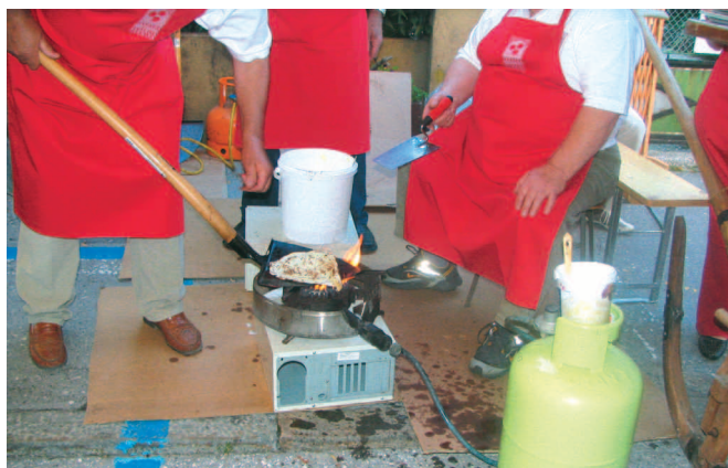
Lopata in »kela«, tokrat kot kubarsko in ne židarsko orodje