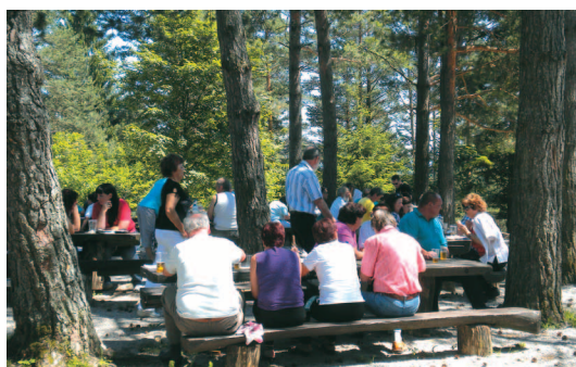
Vsem je prijala borova senca pri koči v Zelšah

Iz cerkve krenemo v naravo, na piknik pri zelški lovski koči. Druženje se ob zvokih ansambla Jelen in dobrotah iz Glaž'kove kuhinje nadaljuje vse do noči. Zbranim še enkrat zapoje Notranjska, pesem dve pa urežejo tudi njeni Jesenski listi s pevci.