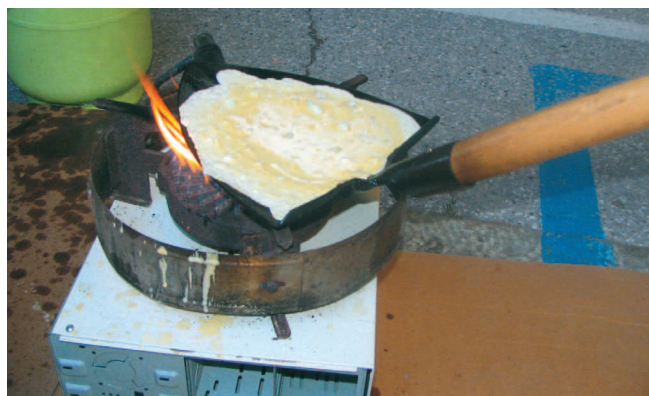
Še malo, pa jo bo treba obrniti