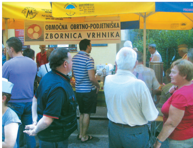
Gneča za palačinke in odlični golaži je bila velika