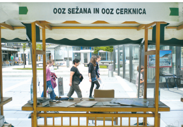
Stojnica OOOZ Cerknica in Sežana je le za trenutek samevala, da jo je sekretarka lahko fotografirala

Skupna vrednost programa je tako dobrih 65 milijonov evrov. Namen povečanja sredstev je nadaljnje spodbujanje ustvarjanja novih zaposlitvenih možnosti s spodbujanjem podjetništva, in sicer v obliki subvencij za samozaposlitev in neprekinjeno ohranitev samozaposlitve za obdobje najmanj dveh let. Podatka o predvideni višini subvencij nismo zasledili.