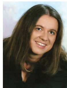
Pripravlja Barbara Grum Vogrin