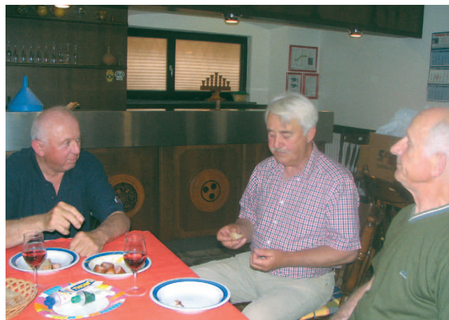
Malica za kuharje med pripravami (dobra kranjska klobasa)