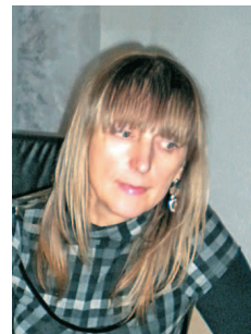
Pripravljala Silva Šivec