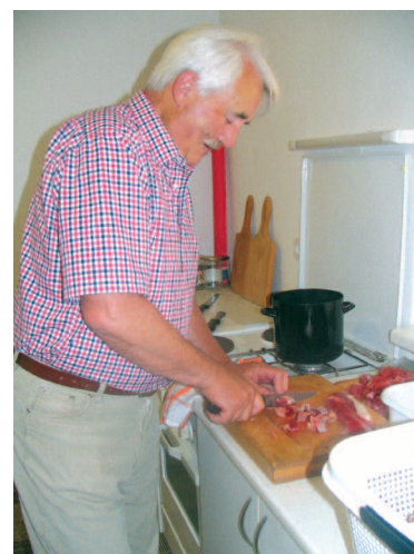
Narezano mora biti tako, da bo ravno prav za žličo

Obrtniški golaž so obiskovalci zelo pohvalili po videzu, vonju in okusu. Res je moral biti dober, saj so kotel nazadnje še s kruhom pomazali, da ga skoraj ni bilo treba pomivati.