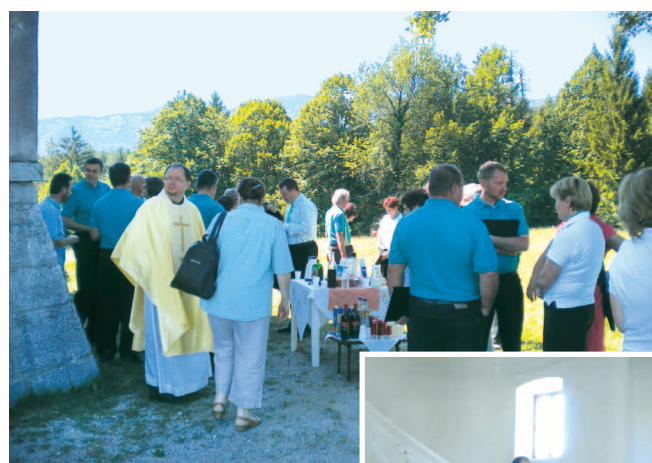
Vsak po svoje se ljudje pripravljajo na slovesno bogoslužje