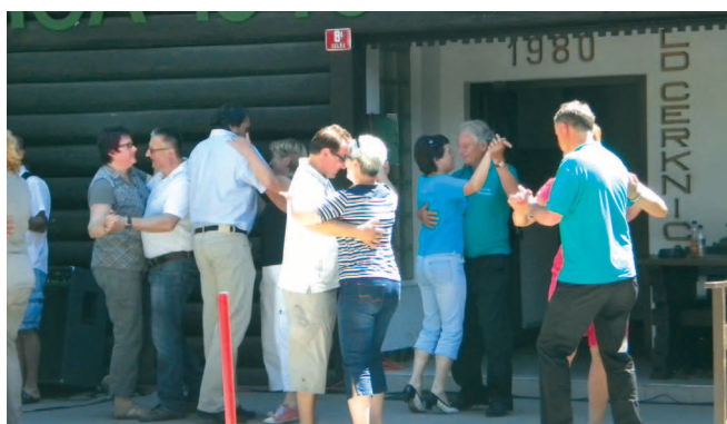
Kljub žares toplemu vremenu so se mnogi prešerno zavrteli ob iskriivi glasbi