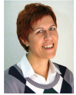
Pripravlja Irena Dolgan