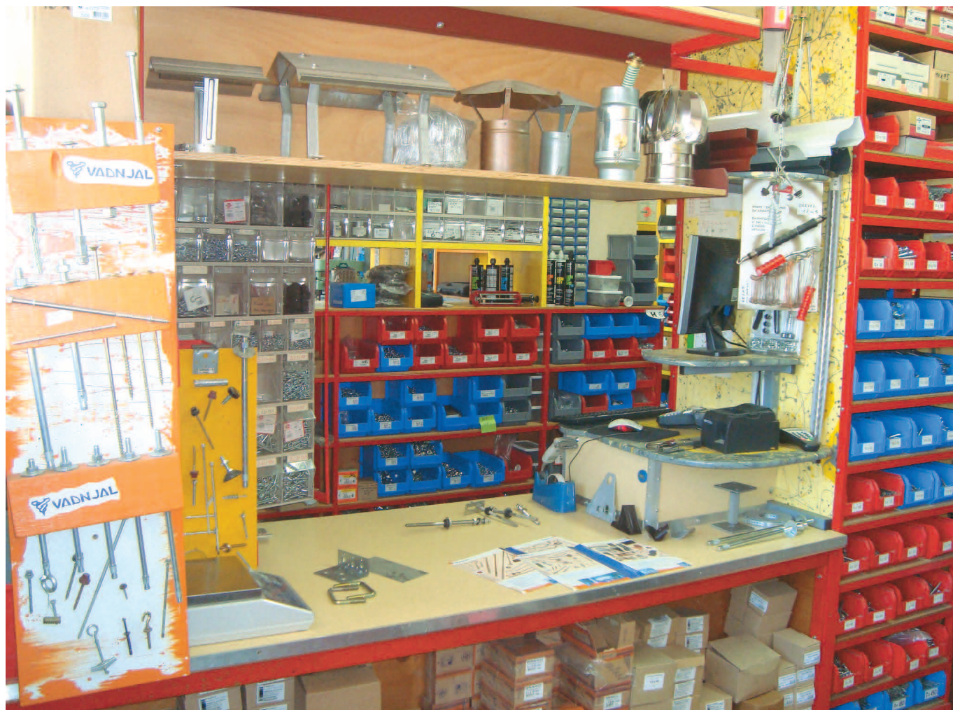
Trgovina Vadnjal nudi najrazličnejše izdelke za gradbeništvo, tudi take, ki jih je drugod težko najti.

Pridite. Jeseni začnemo peti novo pesem »Notranjske«