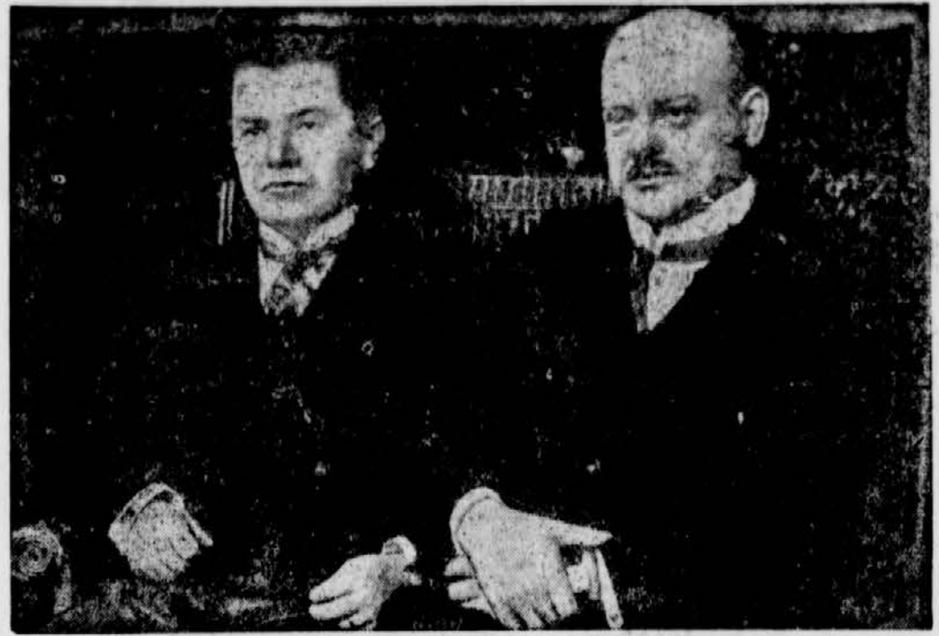
Woldemaras und Stresemann im Auswärtigen Amt.