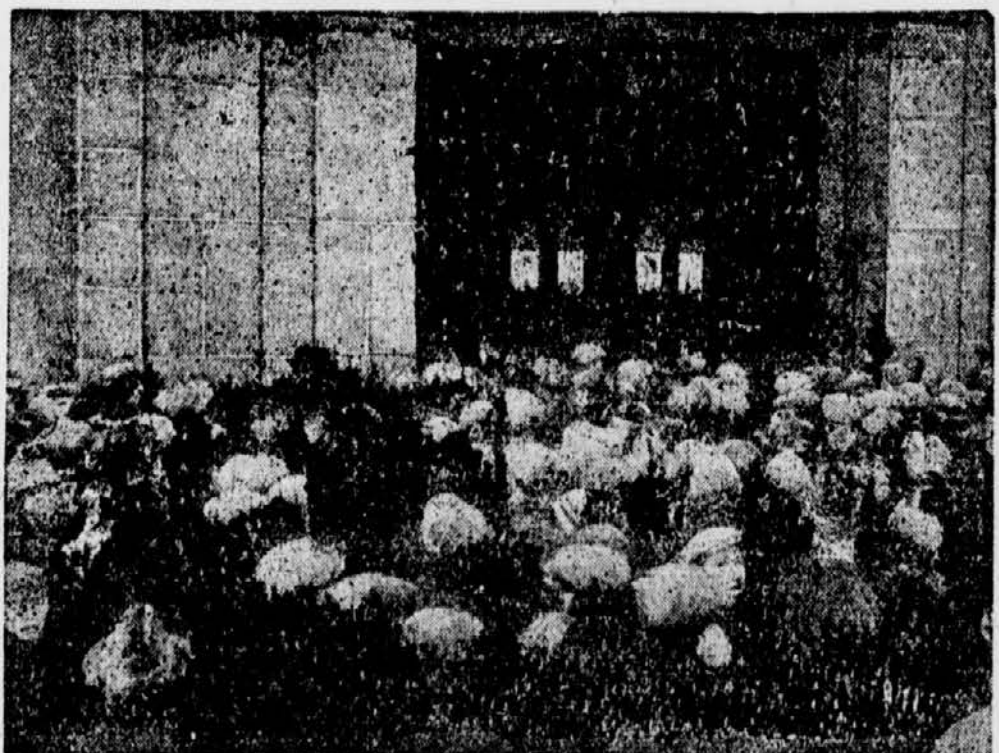
Das Publikum nimmt für die beiden Bergarbeiter Driscoll und Rowland Partei, die den Boyer Lewis ermordet haben sollen und in Cardiff (Wales) hingerichtet wurden.