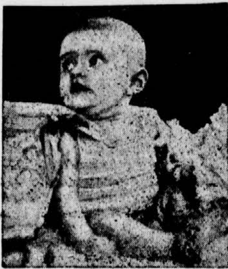
Romano Mussolini, der jüngste Sohn Mussolinis.