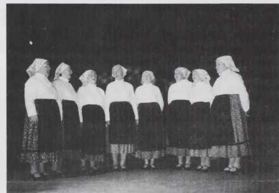
Ljudske pevke iz Monoštra

Nastopajoči so bili tak vözrik-tani, vözravnjani v svoji nošaj, ka bi je leko vöpostavili v izložbe (kirakat). Tak plesalci kak goslarge pa pevke so z düšom pa srcaum dali naprej svoje zanimive, z indašnji časov erbane naute, plese. Takšnoga reda mi furt tau na pamet pride, ka so naši starci, predniki