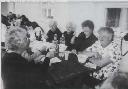
Gulaš se je zatok dobro pršiko

- 6. majaša sta meli edno prireditiv. Tau je že nej samo srečanje, pripovedjanje bilau, že ste malo naprejstapili pa ste kulturni dvečerak organizirali.