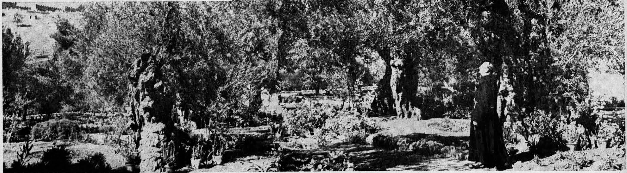
Oljski vrt Getzemani še iz Jezusovih časov