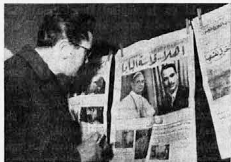
Tako pisavo človek samo gleda

Ob koncu je napravil nad vsemi prisotnimi veliko znamenje križa ter počasi stopal po stopnicah. Še enkrat je zablestel njegov rdeči plašč v ozadju beline zrakovplove, nato je zginil v notranjost.