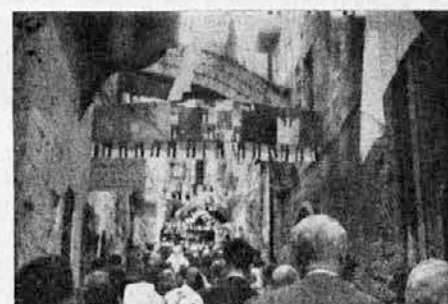
»Via dolorosa« okrašena za papežev prihod

Začetek nereda na trgu pred Damaščanskimi vrati so povzročili ravno fotoreporterji.