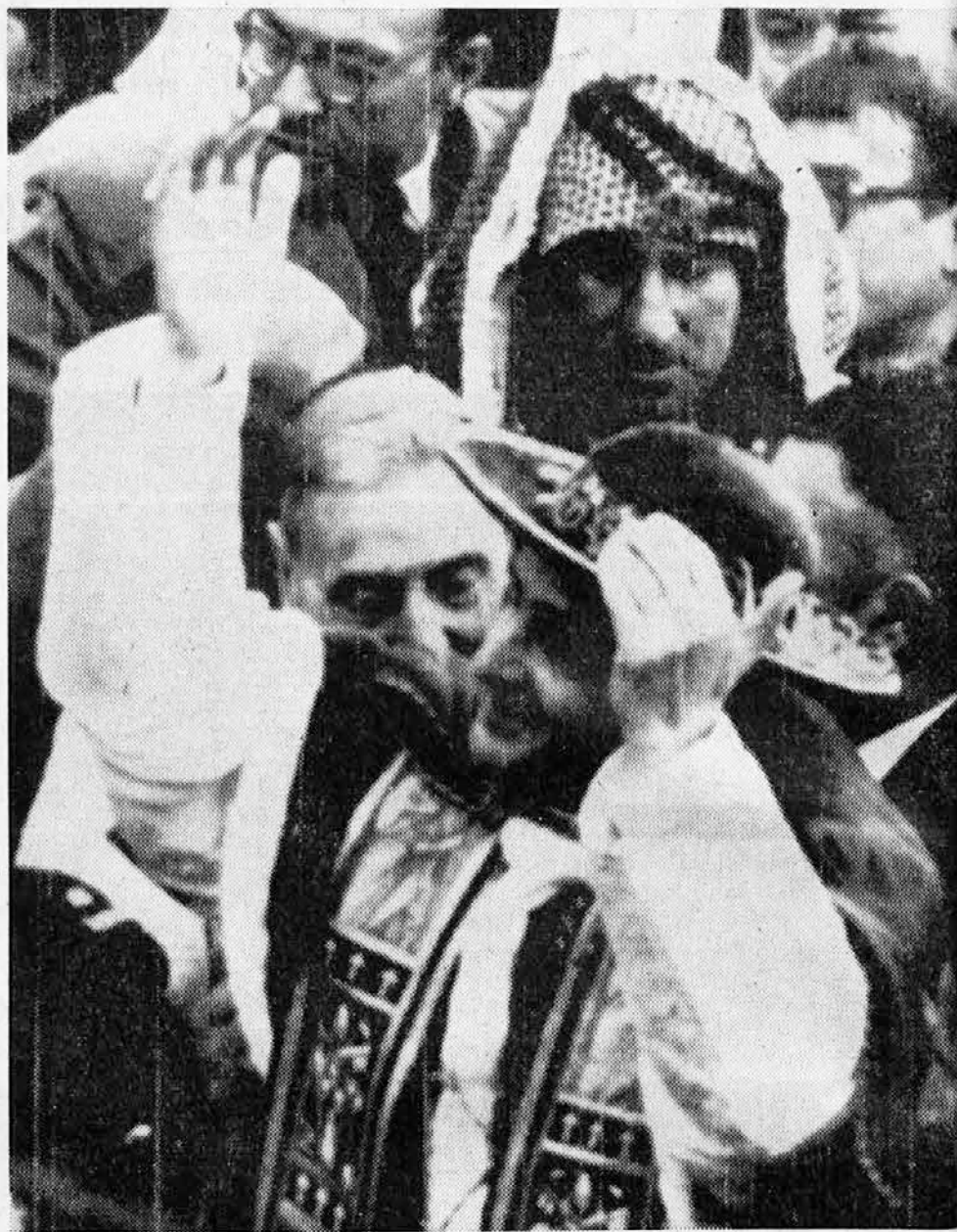
Sv. oče v množici Arabcev (zgoraj) in Judov (spodaj)