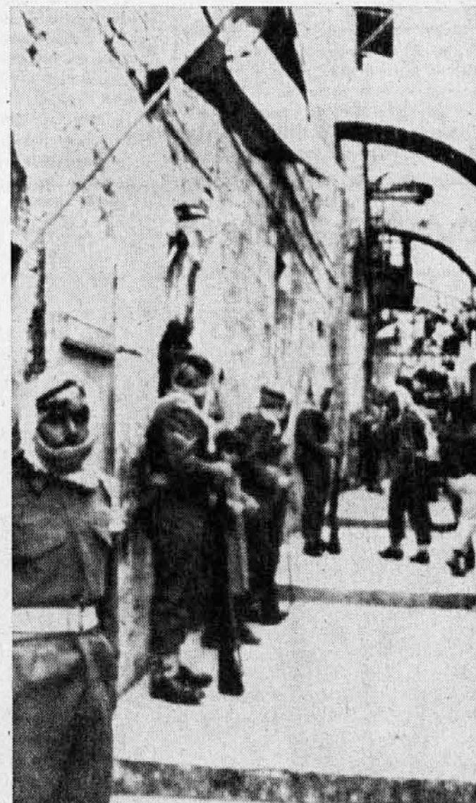
Časna straža jordanskih vojakov ob križevem potu, koder bo stopal papeški sprejeto

Število prisotnih časnikarjev in fotoreporterjev v Sveti deželi v času obiska sv. očeta priča, s kakšnim zanimanjem je sledil ves svet temu edinstvenemu dogodku; vsaka druga novica v svetu je stopila v ozadje. Odsotni so bili le časnikarji z onstran železne zavese.