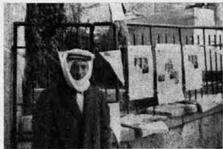
Za izreden dogodek - izredna prodaja listov

Na raznih slavolokih je bilo mogoče brati podobne napise: Pozdravljeni, prinašavec miru!