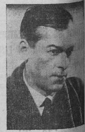
igralce glavne vloge