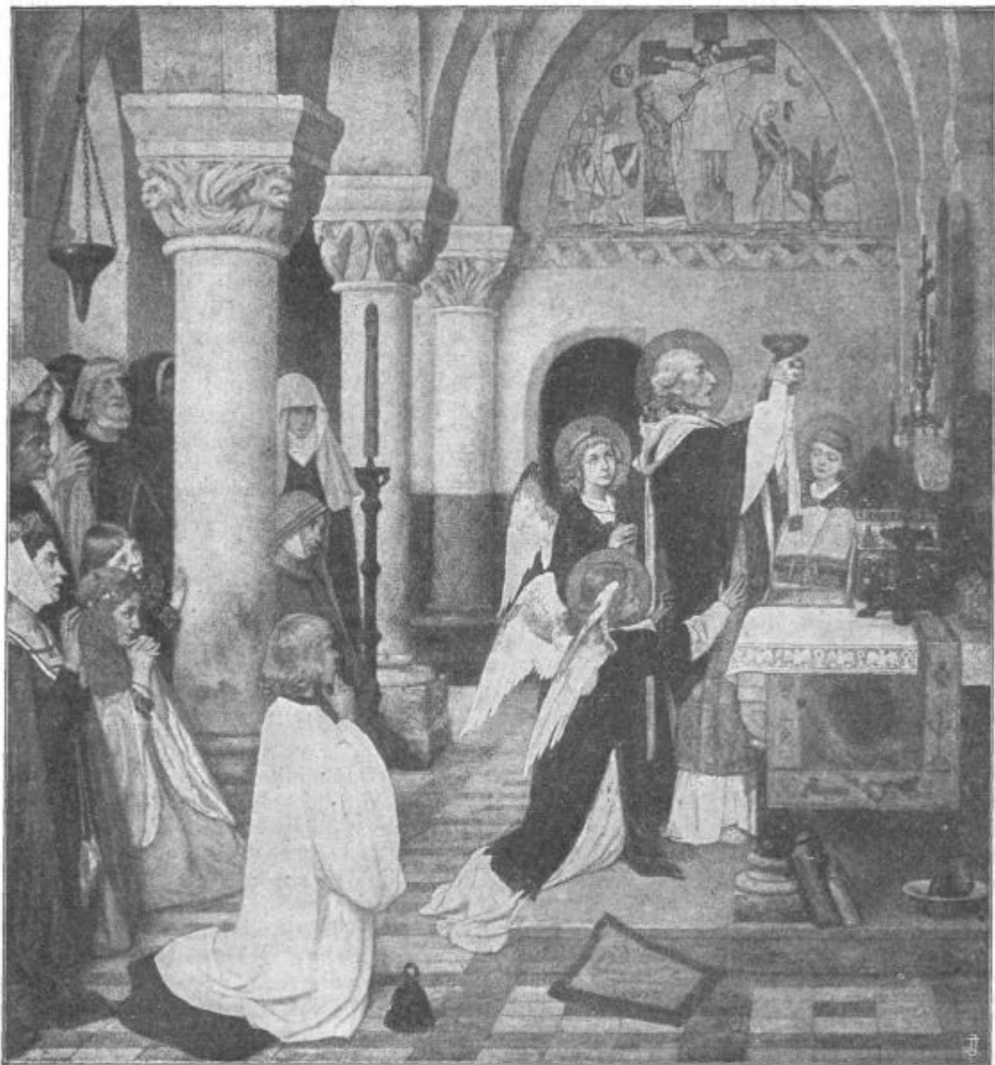
Molim te, presveta Rešnja Kri Jezusova, zame prelita na križu.

zapovedljivo delavce v svoje okrilje. Kje je veliko življenje, kje se odigrava usoda človeštva? Kdo, ki bi površno gledal, bi mislil; tam kjer se razvija življenje s takim šumom. A ni res. Vse tekanje, bobnanje