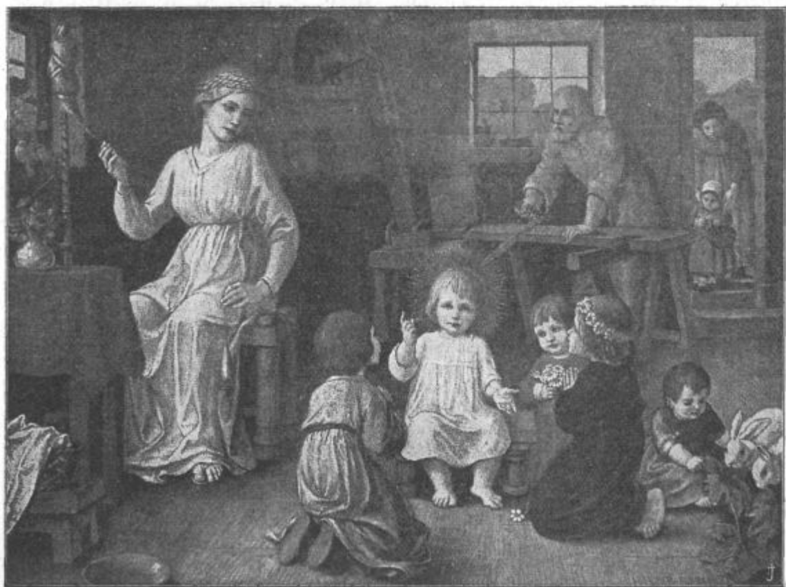
Dete pa je rastle, vedno bolj polno modrosti...