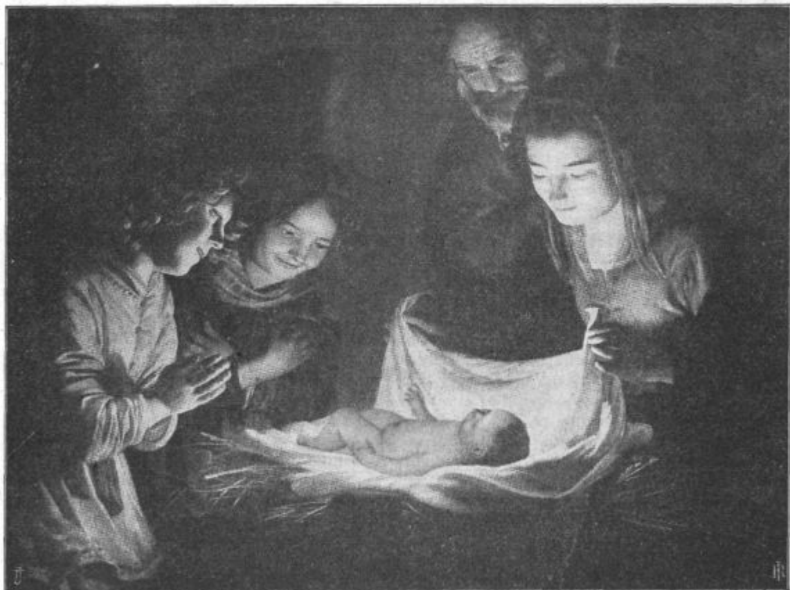
Devica je porodila sina prvorojenca in ga položila v jaslí.

revni in grešni človeški rod. Verno srce vidi v slabotnem in siromašnem betlehemskem Detetu svoje bogastvo in nebesa. A danes jih je mnogo tudi po slovenskih do-