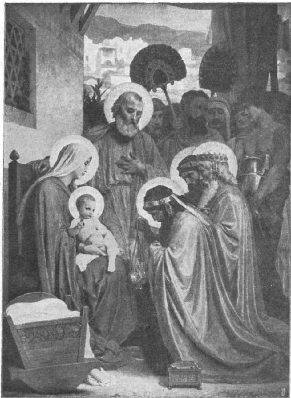
Ugledali so Dete z Marijo, njegovo materjo, ter ga molili; in odprli so svoje zaklade in mu darovali zlata, kadila in mire.