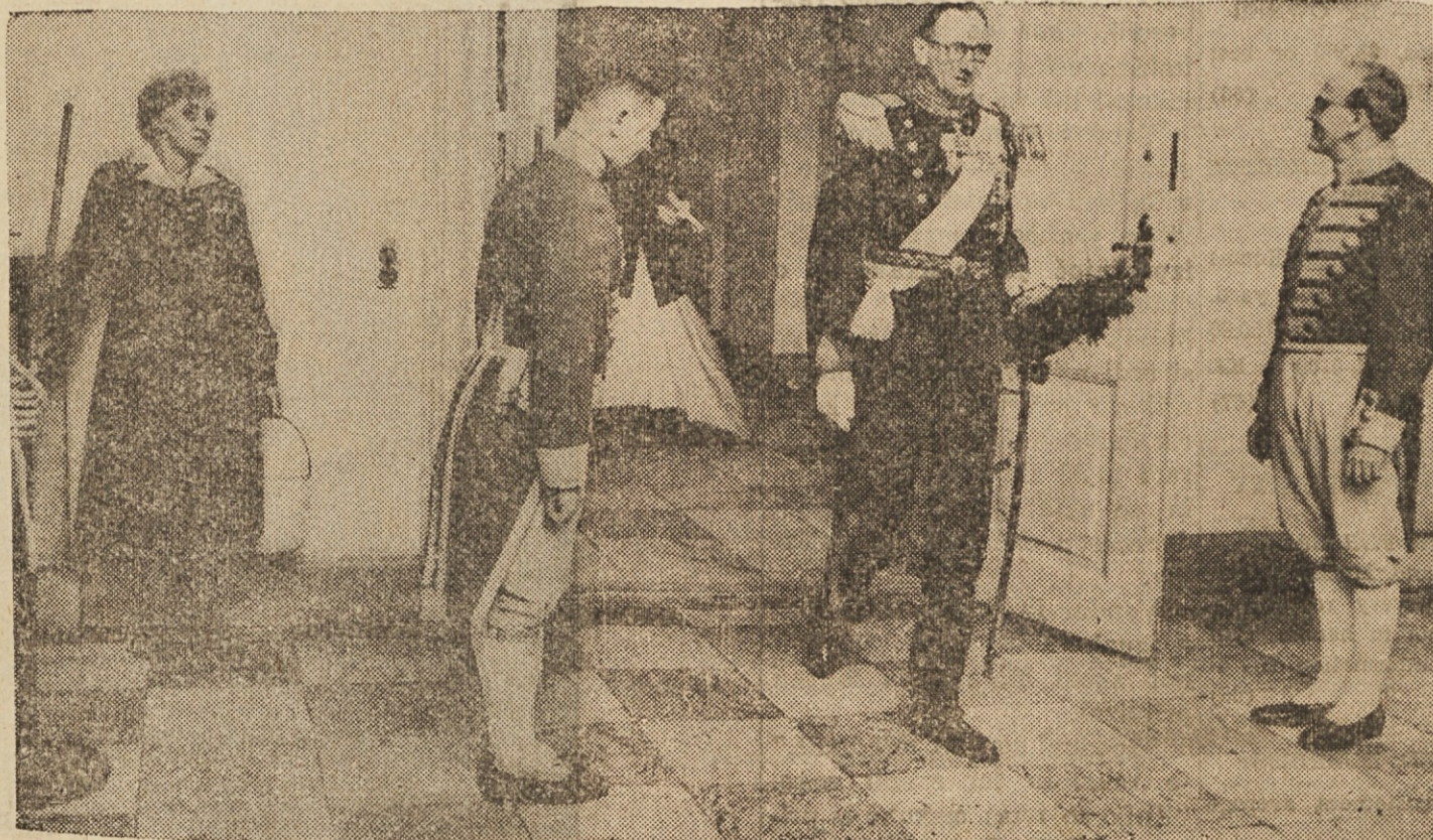
SPADA NUJNO ZRAVEN? Z metlo in kanglo v rokah se je tudi čistilka postavila v pozor, ko je stopil v krajero palačo v Kopenhagenu na Danskem princ Knud v slovesni uradni obleki.

UPSON REALTY 499 E. 260 St. RE 1-1070 (68)