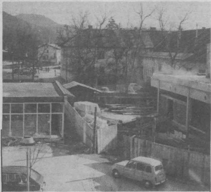
Poslopje nove trgovine že dobiva svojo podobo.