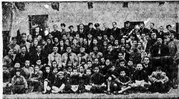
Чланство и управа Соколског друштва котор

Primer Tuzle trebali bi da slede i ostali naši krajevi, a sokolstvo će biti sretno, ako bude svoj potpis moglo da daje na odluke ovakve sadržine, u društvu sa bilo kojim udruženjem, bez obzira, ko u njemu sedi, ili kojoj stranci pripada. Pred odbranom otadžbine prestaju sve razlike mišljenja.