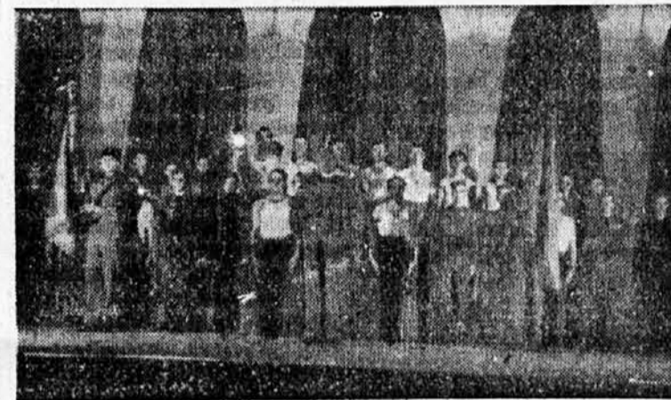
Лива слика „Чувачемо Југославију“, изведена у друштву Сарајево-Матика

Сokolско друштво Бреза одржало је академију уочи празника докзавши да ово друштво