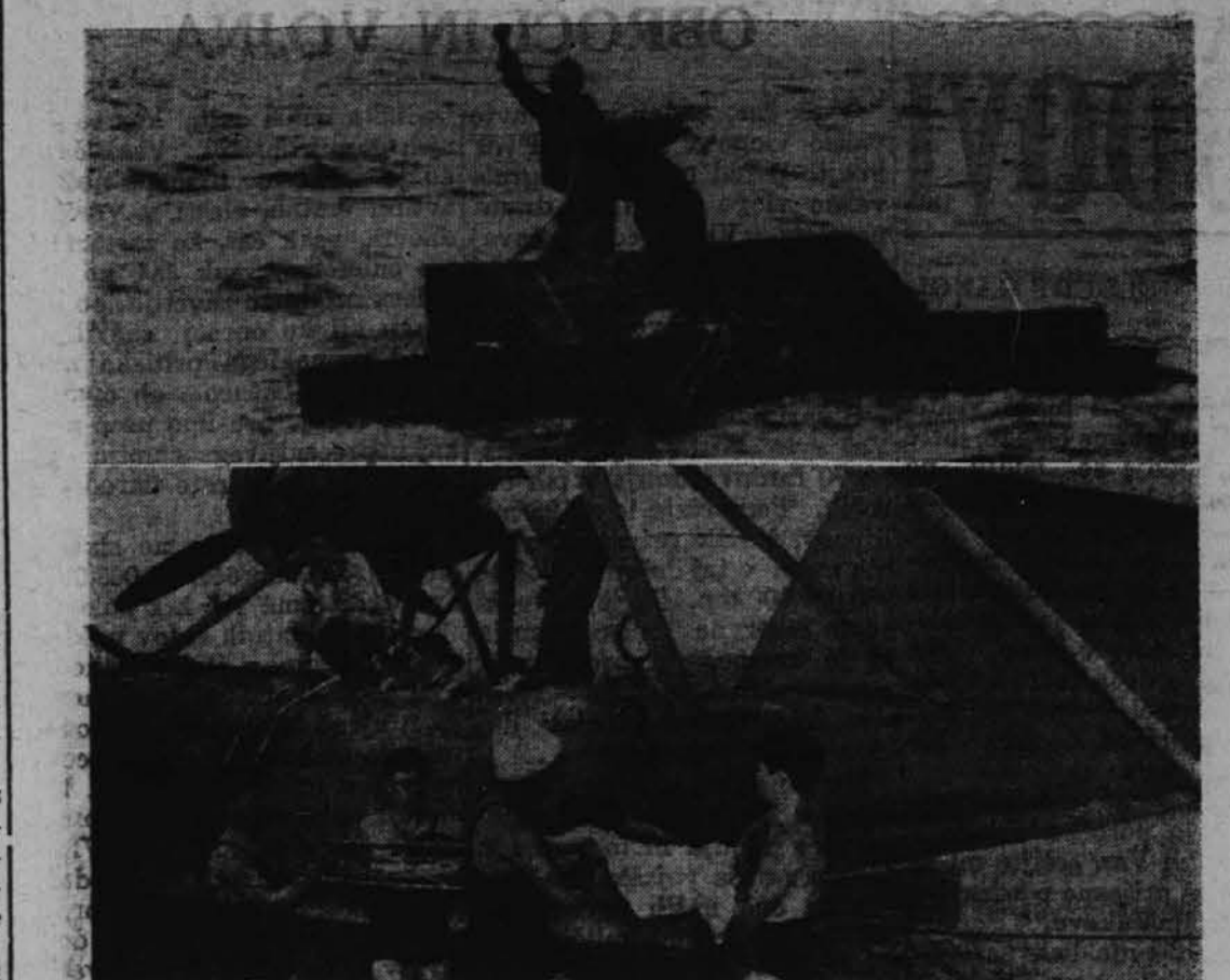
Dvanajst dni sta bila dva mor narja na splavu, ko je nek pa namski parnik potopila sovra-žna podmornica, slednjič pa ju je rešil nek ameriški patrolni aeroplan. — Na gorenji sliki mornarja čakata na aeroplan, na spodnji pa spravljajo eneg a mornarja s splava v letalo.

le, odkar se je omogočilo po-novno karteliziranje industrije razmere nekoliko ustalile. Me-talurški stroka je beležila v zadnjem desetletju pred seda-njo vojno znatno izpopolnitev in je bila pri zmanjšanem do-bišku in rentabilnosti še zado-voľljiva zaposlena. Velik na-predek so beležile industrije le-penke, papirja, kartonaže in grafične industrije. Slovenska premogokopna industrija ki se je po prevratu zelo razširila in modernizirala, je začela v zad-njih letih radi stalnega znanj-ševanja dohav državnim želez-nicam v težak položaj in je ob-ratovala pred sedanjo vojno le še s polovico nekdanjega šte-vil delavstva.