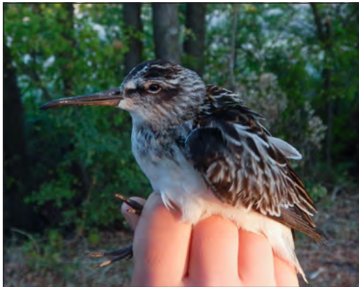
Slika 3: Ploskokljunec Calidris falcinellus, Sečoveljske soline, Portorož, Slovenija, 29. 8. 2017, obroček VC 410