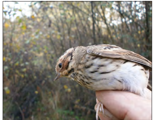
Slika 4: Mali strnad Emberiza pusilla, Bistrica, Šentrupert, Slovenija, 13. 10. 2017, obroček KV 33445