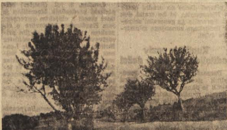
Mladi jablanov drevored ob cesti dobro uspeva

Kmetijska gospodarstva v lenarski občini so obnovila v zadnjih letih precej sadovnjakov. Med vodilnimi je bilo Zadržno kmetijsko gospodarstvo Selce, ki si je uredilo lastno drevnico. Obnovo sadovnjakov je namreč oviralo med drugim tudi pomanjkanje sadnih drevesc. Drevnice v Selcah pa ni krila vseh potreb v občini in od drugih jih tudi niso dobili dovolj. Zato je