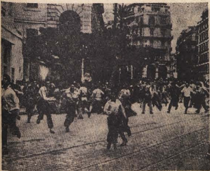
Protimuslimanske demonstracije evropskih študentov med nedavnimi progromi v Alžiru, ko je bilo ubitih in ranjenih na desetine domačinov

Izvenški komuniste, ki so odločno nastopili proti tem načrtom, se nobena politična skupina v načelu ni izrekla proti skupnemu trgu. V imenu nasprotnikov evropskega združevanja sta bivša ministrska predsednika Mendes-France in Edgar Faure opozorila na potrebo po odgoditvi uporabe teh načrtov sprčo velikih gospodarskih in finančnih težav, ki jih trenutno preživlja Francija. Pozornost je naposled vzbudila tudi izjava zunanjega ministra Pineaua, da bo Francija menila, da jo ne vežejo več obveznosti iz te pogodbe, če bodoča združena Nemčija ne bi hotela sodelovati v skupnem trgu.