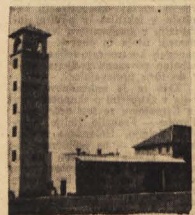
Gasilski dom v Murski Soboti je eden največjih v Sloveniji

Delavsko prosvetno društvo »Svoboda« v Murski Soboti bo letos poleti priredilo za prebivalce mesta in okolice več kul-