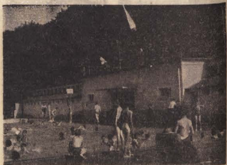
V letošnji hudi vročini je tudi v Javnem kopalšču v Rimskih Toplicah zmeraj polno kopalcev — letoviščarjev in domačinov

dja, temveč tudi razne škodljivce in opravila v sadovnjaku. Sadjarji so pokazali mnogo volje za ustrezno negovanje nasadov; a mnogi tega še ne znajo, zato grešijo pri škropljenju, sajenju, precepianju in drugih delih. Na takšni razstavi se sadjarji sicer ne bodo mogli naučiti vsega, opozorila pa jih bo na napake in jih spodbudila, da se bodo posvetovali s strokovnjaki. P.