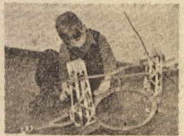
Matador — zelo priporočljiva igrača za dečke

Seveda pridejo v poštev tudi nekatere igrače, ki smo jih že prej našli, kakor lutke, tricikelj,