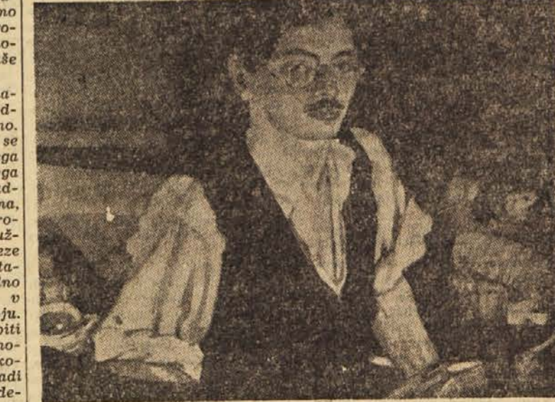
Avtoportret Moše Pijada, ki ima največji zaslug za izdajo prve številke »Komunist«