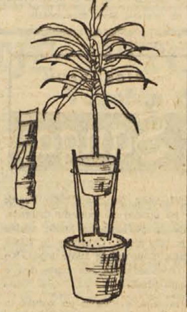
barvo. Listi so razporejeni okrog stebra, pri nekaterih vrstah listi spodaj hitro odpadajo. Ako se steblo preveč dvigne, ni rastlina več lepa, zavzame pa tudi mnogo prostora. Da nam dracenični rastlini ni treba grediti, jih pomladimo na svojetven način. Podobno razmnoževanje uporab-

Dracena, kordilino in juko so okrasne rastline z dolgimi ozkimi listi, ki so zelena, rdeča ali pa pisano