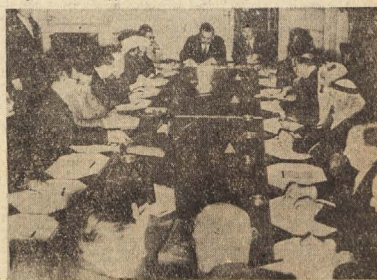
Z zadnjega zasedanja ministrskih predsednikov dežel Arabske lige, na katerem je izbruhnila kriza v Ligi zaradi napovedanega iraško-turškega obrambnega pakta

Pierru Pflimlinu pa se je vendarle posrečilo pri socialistih nekaj, kar se Pinaju ni. Pinay