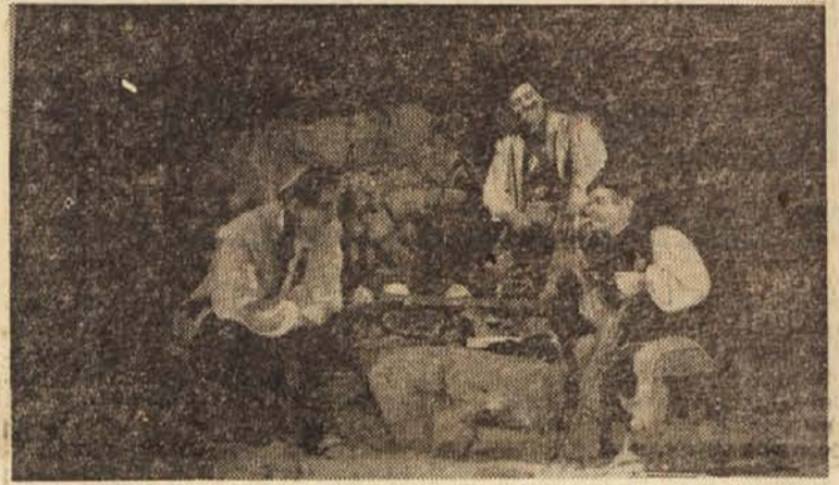
Prizor iz IV. dejanja Budakovega »Meteža«