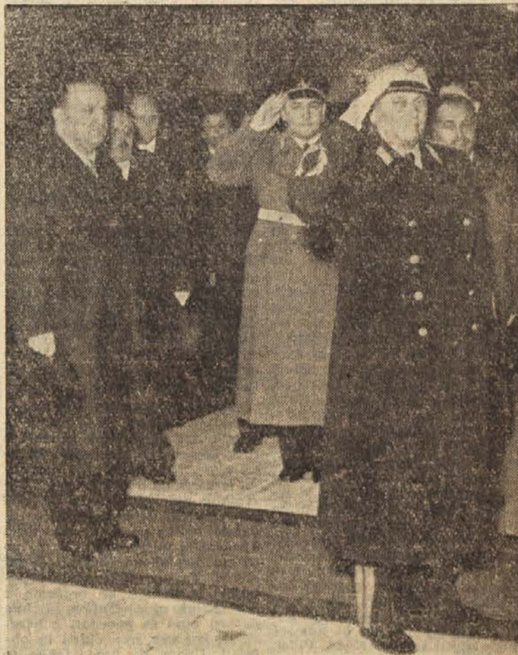
Med igranjem himne po prihodu v Zagreb

Mi se nikoli nismo bali, mi smo se borili proti mnogo močnejšim sovražnikom. Naše ljudstvo je bojevito ljudstvo in zna