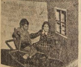
Gugalni stolček je otrokom v veliko veselje

Kot vse druge predmete, je treba tudi igrače kdati na kdaj teza materialu. Če so igrače izdelane iz lesa, jih očistimo s kerozinom, v vodi in milnici. Če jih očistimo v vodi in milnici, jih očistimo s kerozinom. Tako bomo na primer razne živali in lutke, izdelane iz raznovrstnih tkanin, očistili tako: najprej jih bomo oprali s kerozinom, nato s kerozinom in milnico. Če so igrače izdelane iz lesa, jih očistimo s kerozinom. Če so igrače izdelane iz tkanin, jih očistimo s kerozinom in milnico. Če so igrače izdelane iz belih tkanin, jih očistimo s kerozinom in salmijakom. Če so igrače izdelane iz belih tkanin, jih očistimo s kerozinom in salmijakom. Če so igrače izdelane iz belih tkanin, jih očistimo s kerozinom in salmijakom.