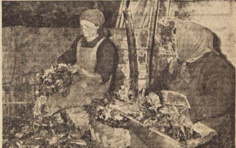
Ljudem v mestu pomeni rdeči radlič pozimi posebno poslastico. Kmetom, zlasti na Goriškem, kjer ga največ goje, pa daje srečni dela — pa tudi lepe denarce