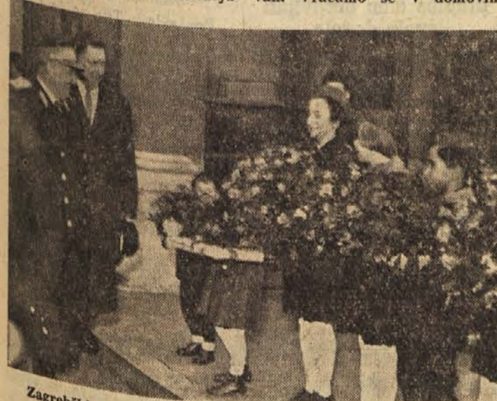
Zagrebski pionirji pozdravljajo predsednika republike Tita

Prav to sem hotel danes reči tu, da ni razlogov in da ne bi bilo pošteno sumničiti nas, da smo nekoga izdali. Mi ostanemo na istih pozicijah, na katerih smo bili doslej. Svoje stike z zahodnimi državami bomo krepili, toda to ni odvisno samo od nas. Seveda pričakujemo tudi od njih, da bodo storili isto. Mi smo neodvisna dežela in vsak poskus, da bi se vmešavali v naše notranje zadeve ali pritisk, da bi spreminili svojo orientacijo je absolutno odveč. Naši narodi so dokazali, da so zreli, da se sami upravljajo in ne samo da so zreli da se sami upravljajo marveč tudi, da so zreli, da sodelujejo v dogajanju na mednarodnem tirišču, da se tudi tam sliši njihov glas (odobranje). Čeprav nas je samo 17 milijonov, imajo naši narodi v moralnem oziru prav, da govorijo o mnogih važnih vprašanjih. (Nadaljevanje na 3. strani)