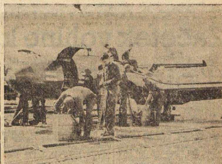
Pri umiku kuomintanških čet s Tačenskih otokov so sodelovala tudi ameriška letala. Na tajpeškem letališču se ameriško lovsko letalo pripravlja na polet proti kitajski obali

prave. Ker ne kaže obravnavati problema na javnih sejah v OZN, bo nemara »do nadaljnjega« odgodil to razpravo. Med delegacijami prevladuje mnenje, da bodo vprašanje obravnavali po diplomatskih kanalih in v stikih med predstavniki zainteresiranih držav v Pekingu in Washingtonu.