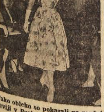
Tako obleko so pokazali na modni reviji v Parizu za letošnje poletje

Se slabše pa je z močnim iztepanjem. Gospodinja uporabi pri steno, ki se hrani s travo, deteljo in podobno, nosi jajca s rdečkasto rumenim rumenjakom. Če hrana vsebuje olnate snovi ali odpadke mesa, je rumenjak temno rumen, če pa se kokos hrani z ribjo moko, raznimi odpadki, zlasti pa s okvarjeno živalno hrano, bodo jajca, alaboga okusa, medtem ko bodo odličnega okusa. Če se bodo kokoši hranile s primerno mešanico žita, koruze, otrobov in nekaj mlečnega mesa.