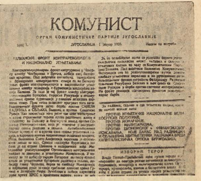
Faksimile naslovne strani prve številke »Komunist«