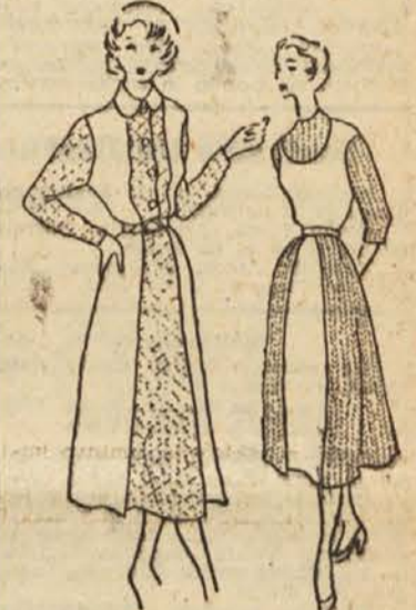
Takole lahko predelamo stare obleke

Razen teh zunanjih znamenj nedohranjenosti imamo pa tudi nevidno nedohranjenost, pri kateri dojenčkova teža ni vselej najboljše merilo. Mnogi dojenčki so namreč na pogled rejeni in kažejo znamenja nezdrave debelosti. To pride najboljše do izraza, ko otrok zbolí in ko nezdravo debeli dojenček izgubi v nekaj dneh velik del svoje teže. Zato je treba stalno paziti tudi na to, kakšno hrano dojenček uživa. Otrok, ki ne prične pravočasno uživati vitaminov, rumenja-