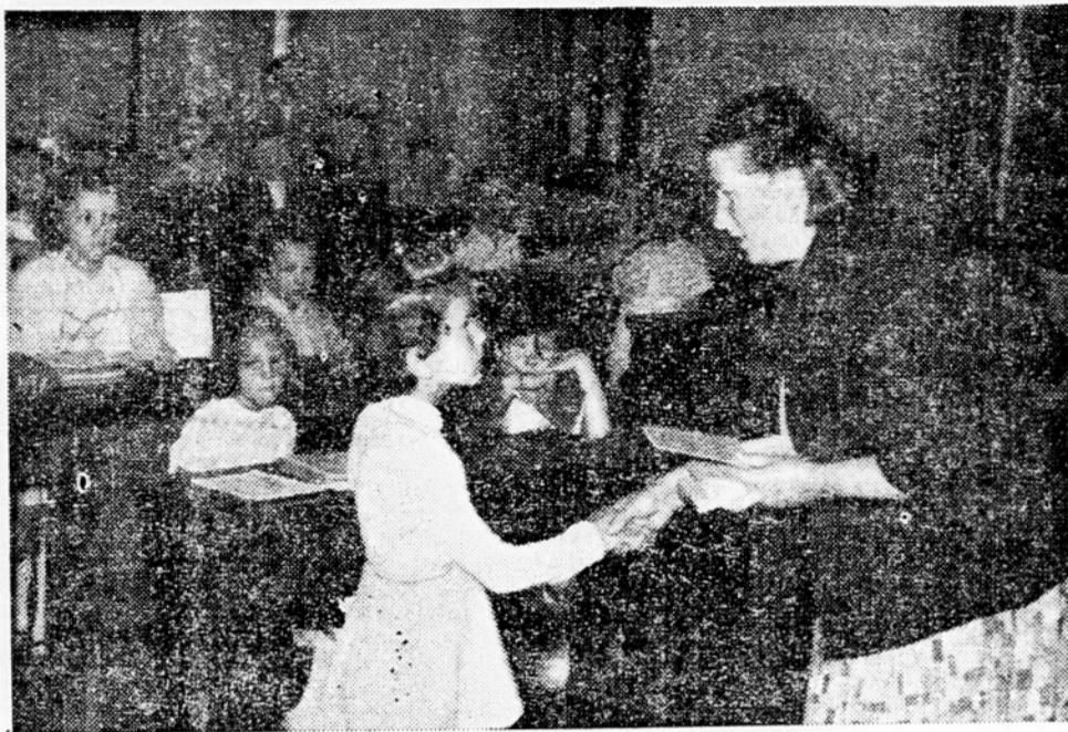
(Solska vrata so se zaprla) — Mnogi odličnjaki so prejeli pri znanja za svoj trud v šol. letu