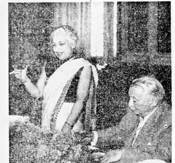
Gospa Lakšmi Pandit na svečanem kosilu, ki ga je priredil njej na čast predsednik Ljudske skupščine tov. Moša Pijade.

V Beogradu izražajo zadovoljstvo, ker delo mešanih komisij poteka hitro in uspešno. Sestale se bodo 28. junija v Atinah in izdelale skupni predlog, ki ga bodo nato poslali grški, turški in jugoslovanski vladi v končno odobritev.