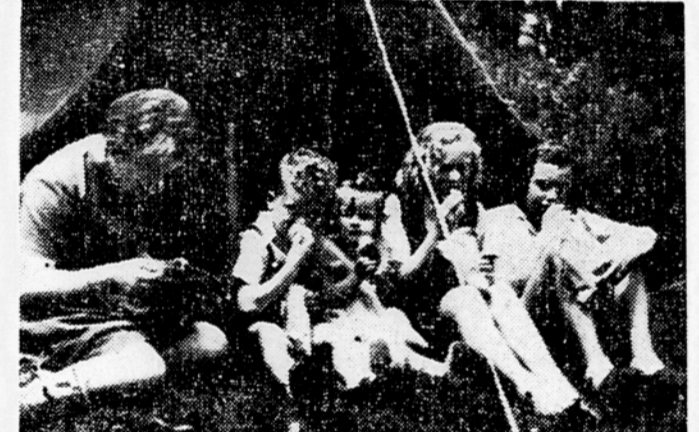
Malim tabornikom vse izvrstno tekne