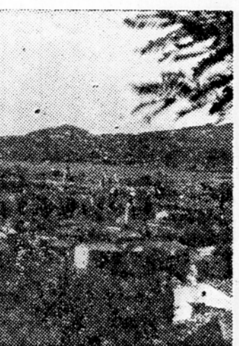
Golaki in Kucelj, ki so znani po lepih očiščah. Ti hribi nudijo krasen razgled čez vso Vipavsko dolino in Kras, tja do Jadranskega morja. — J.P.

Turizem na zadnji lestvici V Ajdovščini ne pozostajo turizmu nobene posebnosti. Vendar ima Ajdovščina mnogo pogojev za njegov uspešen razvoj. Poleg raznih domačih zanimivosti so tu še lepe izletniške točke, tako Veliki rob,