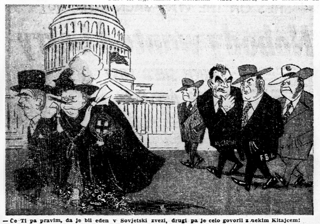
— Ce Ti pa pravim, da je bil eden v Sovjetski zvezi, drugi pa je celo govoril z nekim Kitajcem!

Ko so ga vprašali o skupnih problemih azijskih držav, je Cu En Laj dejal, da mir in varnost čedalje bolj ogroža »agresivna politika, katere smoter je ločitev azijskih držav v nasprotne vojaške bloke«. Izrazil je mnenje, da bi se morale azijske države posvetovati in določiti skupne ukrepe za ohranitev miru v Aziji in na svetu.