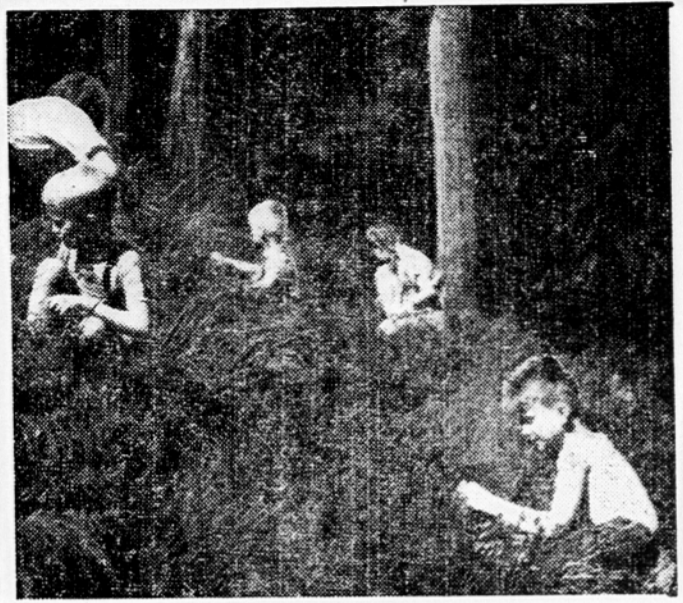
Borovnice so že dozorele. Otroci tekmujejo, kdo bo več nabral

Toda, nenadoma zaslišim presunljiv jok in kričanje. Pri