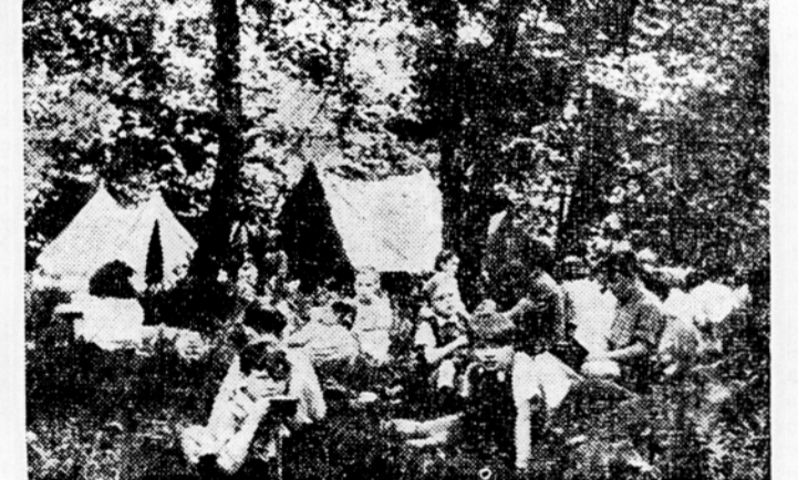
V gozdu je taborjenje prijetno

sta, kaj pa vi, ko ste na kmetih. Kaj kmalu se bo pokazalo, da so naši otroci osamljeni, da se jih kmečki otroci ogibljujejo in da med njimi ni tistega otroškega veselja, ki bi moralo biti. Otroku moramo razložiti, da je tako širokoustenje nesmiselno in ned vredno dobrega pionirja pa bo med kmečkimi in mestnimi otroci vzpostavljeno velik prijateljstvo, ki je zlasti pri otrocih tako prisrčno in brez predsodkov. V igrah po gmajni, otrok ob potoku se bo naš otrok razvil in okreplil. Pri tem pustimo otroka, da se docela sprosti in ne vpjimo neprestano nad njim, ne smeš to, ne smeš ono! Otroku uživaj, da sme svobodno stopiti na travo, da ni nikjer čuvaja, ki bi zapisal globo itd. itd. In prav zaradi tega so počitnice za otroka še