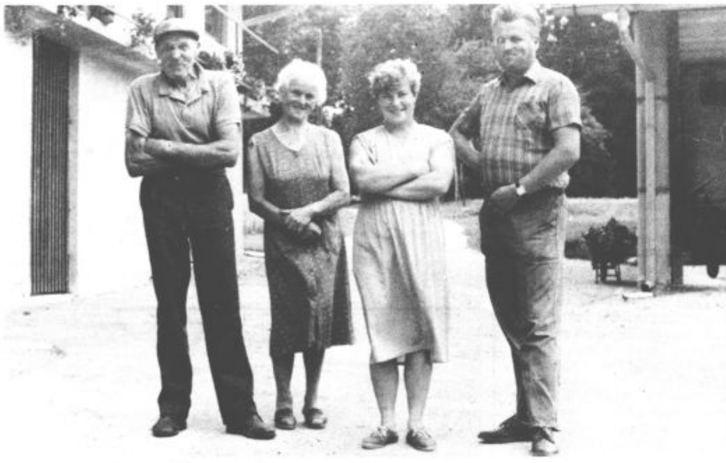
Stoparjevi so resnično skrbni gospodarji