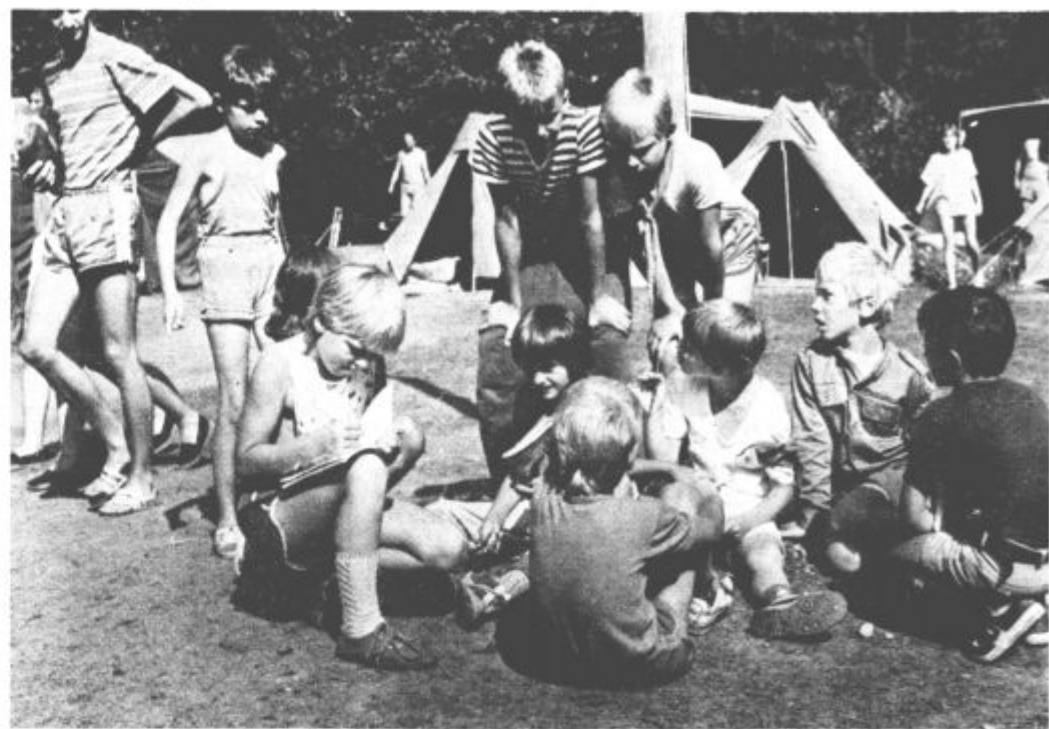
Med sproščeno igro se mladi taborniki veliko naučijo