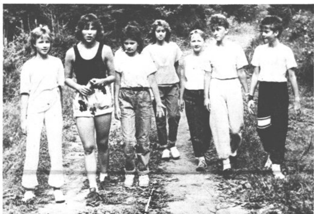
Delo je organizirano v vodovih koticčkih