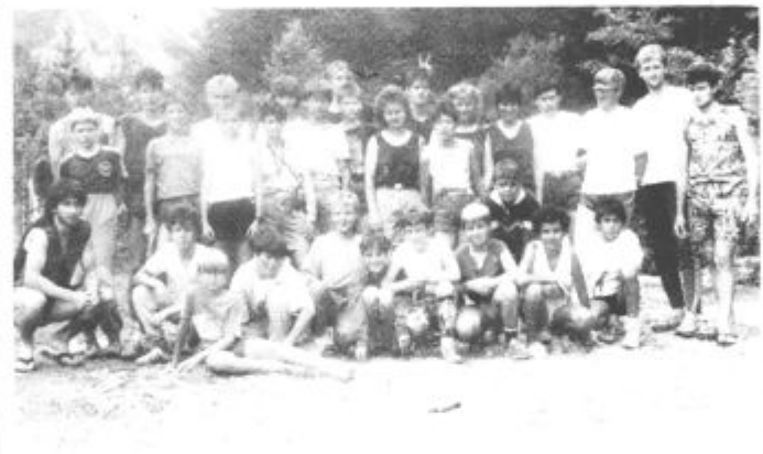
Tečajniki v svojem taboru