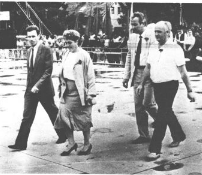
Skrbno izbran korak