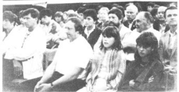
Nedeljske slovesnosti se je udeležilo precej gostov

Tudi do konca tega srednjeročnega obdobja ne bodo smeli stati križem rok, če hočejo vse zapisano tudi uresničiti. Do leta 1990 naj bi namreč posodobili krajevni cesti Šaleška magistrala — Donik, Šaleška magistrala — Sevnikar — Robotnik, opravili nekatera obnovitvena dela na domu družbenopolitičnih organizacij, že v tem času se marljivo pripravljajo na začetek del za ureditev kanalizacije. Krajanje so optimisti. Pravijo namreč, da so doslej vsak z referendumom zbrani dinar znali vnovčiti. Če ga bodo oplemenitili še z veliko udarniškega dela, uspehi resnično ne bi smeli izostati.