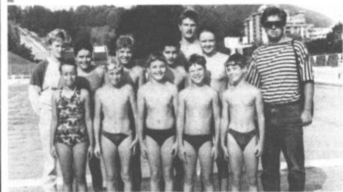
Mlajši tekmovalci so že sklenili sezono, starejše pa še čakajo tekmovalna