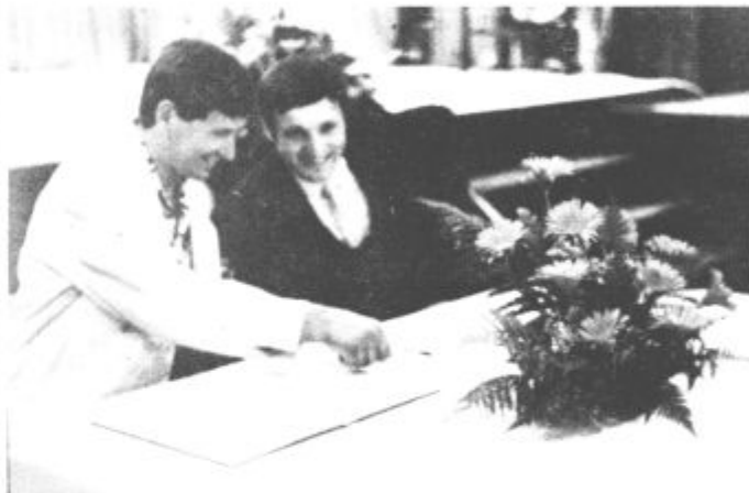
Predsednika krajevnih konferenc SZDL obeh krajevnih skupnosti nista mogla skriti zadovoljstva

Veselili so se torej krajanje Lokovice prejšnjo nedeljo. Še bolj veseli bodo gotovo čez dober mesec, ko naj bi predali svojemu namenu posodobljena odcepa v