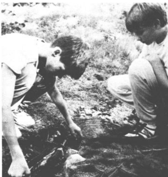
Neokrnjena narava daje veliko možnosti — ob potoku so mladi taborniki postavili mlinček