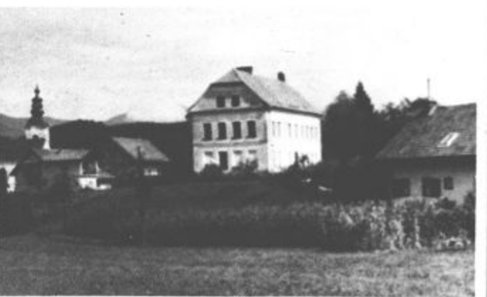
Krajani bodo za nekdanjo šolo poskrbeli sami in preprečili njeno nadaljnje propadanje

služil za spominsko sobo, v kateri bo predstavljen splošni razvoj v Zadrečki dolini, čas NOB in dogodki povojnih let, kletne prostore bo uporabljala zelo aktivna osnovna strelska organizacija, poleg bo še skladišče za potrebe Rdečega križa in stanovanje za hišnika. Za vzdrževanje bo skrbel krajevna skupnost skupaj z uporabniki prostorov, zato je brezplačen prenos pravice uporabe šolske stavbe na krajevno skupnost več kot upravičen.