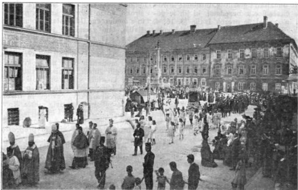
Prošnja procesija v Ljubljani. Odhod od Sv. Jakoba.