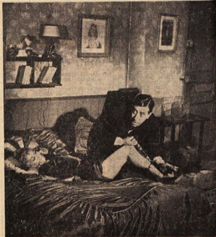
Fernandel v humoristični kriminalki »Fuga na klarinet«.

Cinerama je zelo drag sistem in se menda prav zaradi tega še ni uveljavil tako, kot so pričakovali njegovi iznajditelji. Doslej so posneli samo en film v tem sistemu: »To je Cinerama«. Pravzaprav je to le vrsta prizorov, ki zgovorno kažejo prednosti cinerame. Z gotovostjo lahko trdimo, da se ta sistem še ne bo tako kmalu uveljavil. Vprašanje je, ali mu bo sploh uspelo izriniti navadni, barvni in cinemascope film.