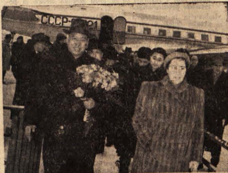
Priloh kitajskih parlamentarcev v Beograd. V ospredju slike podpredsednik stalnega odbora Vsekitajskega kongresa ljudskih predstavnikov in podpredsednica Zvezne ljudske skupščine Lidija Sentjuro

Sklenjeni sporazum določa menjavo v vrednosti 7 milijonov funtov, to je za nad 40% več kakor v lanskem letu.