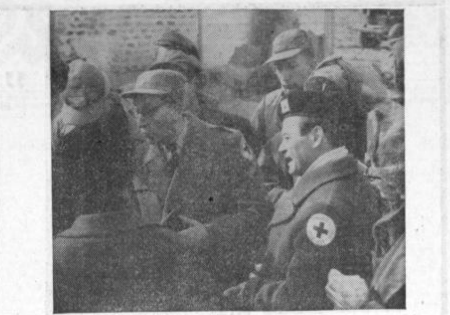
V skladu z interesi Združenih narodov je tudi Zdruzeno poveljstvo na Južni Koreji izvedlo program zdravstvene pomoči civilnemu prebivalstvu in vojaštvu, da tako omili posledice za dve leti trajajočo vojno in prepreči razširitev nalezljivih bolezni. Rdečemu križu, tej neodvisni mednarodni organizaciji je omogočen velen in povsod nadzor nad zdravstveno službo. Edino Severnokorejci in Kitajci nasprotujejo temu človekoljubnemu namenu. — Zgoraj: Člani komiteja RK, ki so prišli pri Panmunjom na pogajanja o možnosti obiska severnokorejskih tajnih taborišč, katere so pa Severnokorejci zavrnilli.

V zadnji številki našega lista smo čitali, da bo Celje tudi kar se tiče razsvetljave naredilo vidnejši korak naprej. V strogem centru mesta bodo namreč instalirali javna fluorescentna razsvetljava. Vsakogar hvaljevredna gesta, ki bo tudi pripomogla k čim lepšemu praznovanju petstoletnice mesta Celja. Sedaj pa se javna razsvetljava z druge plati: Če gremo po Mariborski cesti skozi Gaberje, je svetilniški čudež, če gorijo vse žarnice, ki so krvavorede jakosti, tako da mimoidoče samo pod svetilko lahko spoznajo. No Bežigrajske cesti, ki gre za Tovarno emaljirane posode in Tovarne sadnih sokov naprej proti Bukovikulu, je bila instalirana javna razsvetljava že v stari Jugoslaviji. Ta razsvetljava je imela vsega samo