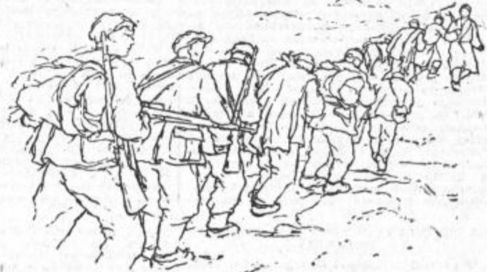
ČETA NA POHODU