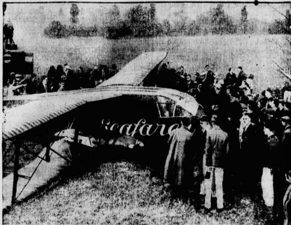
Das englische Fliegerehepaar Jim und Amy Mollison, das mit dem Flugzeug „Sea-farer“ von London nach New York fliegen wollte, erlitt schon beim Start auf dem Londoner Flugplatz Croydon Bruchschaden. Die Maschine mußte abmontiert und zur Reparatur gegeben werden. Das Ehepaar ist ohne Verletzung davongekommen.