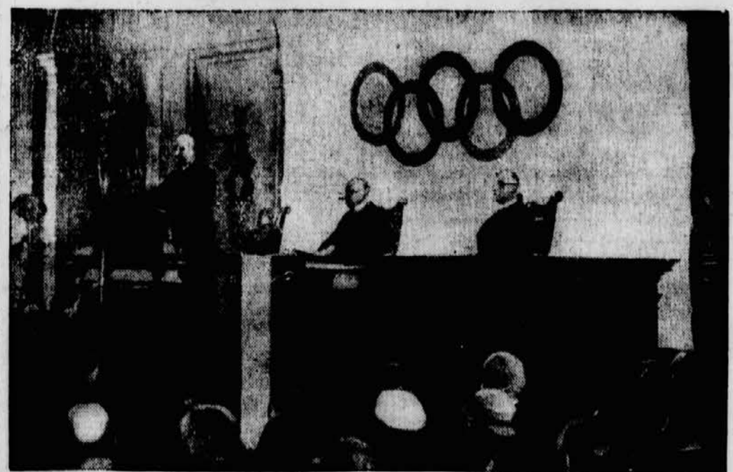
Bundespräsident Miklas bei der Eröffnungsansprache; in der Mitte: Graf Baillet-Latour, der Präsident des Internationalen Komitees; rechts: Vizepräsident Baron Monay.

Im Festsaal der Akademie der Wissenschaften in Wien tagt der Kongreß des Internationalen Olympischen Komitees, der u. a. über die näheren Bestimmungen für