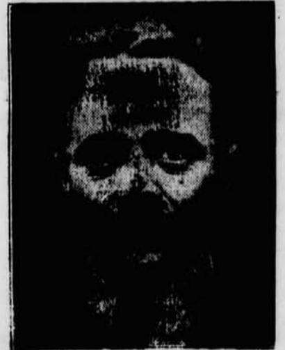
Bundeskanzler Dr. Dollfuß.

polizei in sämtlichen Braunen Häusern Wiens Hausdurchsuchungen durchgeführt, worauf die Parteihäuser der Nationalsozialisten versiegelt wurden. Bei dieser Gelegenheit wurden zahlreiche Uniformstücke und Akten beschlagnahmt. Gleichzeitig wurden mehrere reichsdeutsche Agitatoren der NSDAP verhaftet und nach Deutschland abgeschoben. Ein Rekurs gegen die Ausweisung ist nicht möglich. In den Abendstunden wurden mehrere Nationalsozialisten festgenommen, da man Hoffte, die Bombenwerfer der Weidlinger Hauptstraße leichter erziehen zu können. Ein Ministerrat unter dem Vorsitz des Bi-