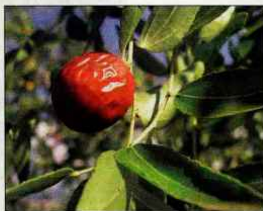
Zrela žizola spominja na datelj.

Z največjimi nasadi kakija ( Diospyros kaki ), ki izvira iz vzhodne Azije in velja za japonski nacionalni sadež, se pri nas lahko pohvali strunjska dolina. Oranžno rdeči, paradižnikom podobni sadeži z okusom po medu, sicer krasijo večino vrtov od Izole do Goriške. Kakiju na čast v Strunjanu prirejajo celo praznik kakijev, bolj znan kot kakijada. Letos se ga lahko udeležite med 7. in 11. novembrom. Naučili se boste kakijev na ta ali oni način, nemara pa domov odnesli tudi gajbico kakijev. Plodovi so zimski sadeži in visijo na drevsih še, ko listje že odpade, kar je zanimiv prizor za oči. Ne zreli so zelo trпки, uživajmo jih, ko se omedijo in postane meso mehko kot žele, sladko in na moč okusno. Kakije poberejo, ko še niso zreli. Dozorevanje bomo pospešili, če jih pustimo nekaj dni na sobni temperaturi. Največkrat se uživanja lotimo kar z žličko, odlično pa se obnese tudi v jesenskih sadnih pogrnjkih, skupaj z jabolki, hruškami, grozdem, bananami ... Kaki je bogat vir provitamina A in vitamina C, vsebuje tudi baker, kalij in glukozo. Velja za sadež, ki organizmu hitro podari energijo. Izjemno se obnese v prehrani dojenčkov in otrok, kjer mu pripisujejo