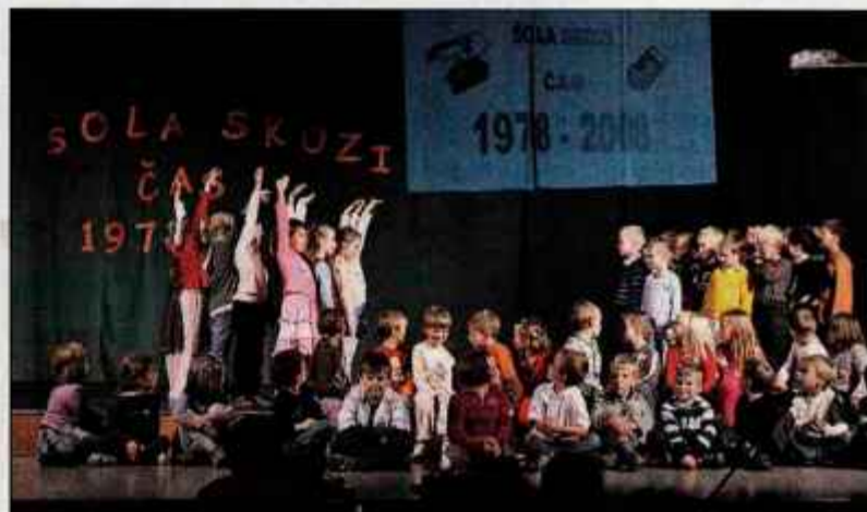
Dom krajanov Primskovo je bil na prireditvi poln do zadnjega kotička.

Šola je imela več prelomnih trenutkov, med njimi je bilo leto 1966, ko je začela delovati kot podružnična šola pod