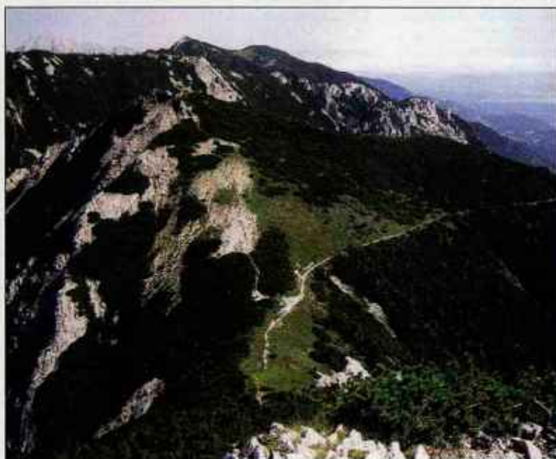
Bašeljski vrh s poti s Storžiča

Po makadamski cesti se vzpnete do razpotja, greste levo, prečkate potoček in nadaljujete po gozdni poti. Kmalu prečkate dve gozdni cesti, vaša markirana pot pa se ves čas vzpenja. Po približno pol ure hoje pridete na pot, ki se kot italijanska vojaška mulatjera vije po gozdu. Po prvem