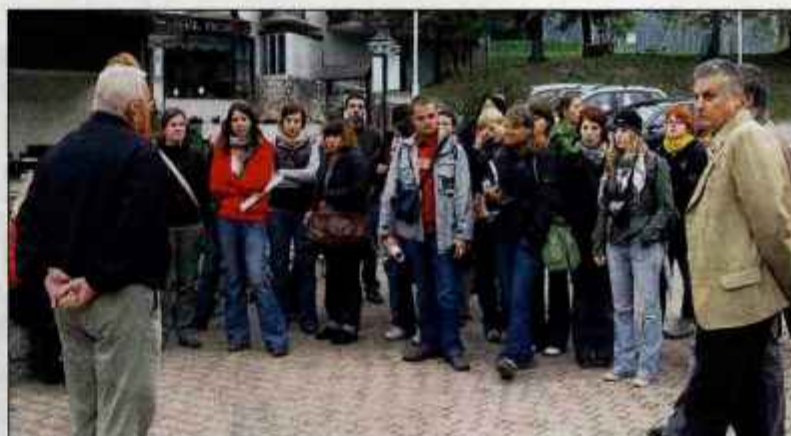
Študentje krajinarstva bodo prispevali sveže zamisli za ureditev Preddvora.