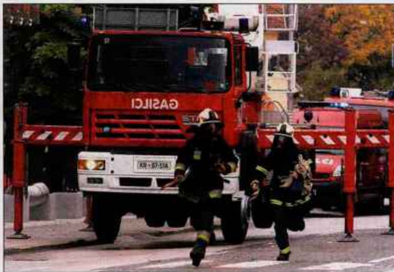
Ceprav je bila vaja gašenja v podzemni garaži in evakuacije napovedana, je šepalo pri obveščanju med intervencijskimi službami, odpovedal pa je tudi povsem nov sistem prezračevanja.

Vaja, v kateri je sodelovalo 56 gasilcev (poklicnih in prostovoljnih), pripadnikov civilne zaščite, reševalcev in policistov, je pokazala na več pomanjkljivosti. Prva je bila slabo obveščanje o domnevnem požaru, saj je nekdo pozabil obvestiti policiste, ki imajo svoje prostore streljaj od prizorišča vaje. Ker je bila ta napovedana, so se potem močje v modrem kar sami "povabili" nanjo in z zamudo opravili svoj del nalog. Po