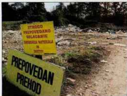
Table s prepovedmi niso mar tistim, ki vozijo odpadke kamorkoli.