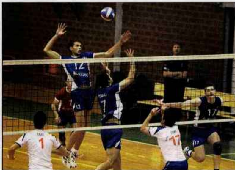
Odbojkarji Asteca Triglava (v temnejših dresih) so se svojim navijačem predstavili z zanesljivo igro in zmago proti škofjeloški ekipi Knauf Insulation.