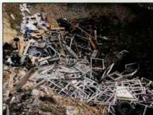
Gradbeni in drugi odpadki so razsuti daleč po brežini in gozdu.