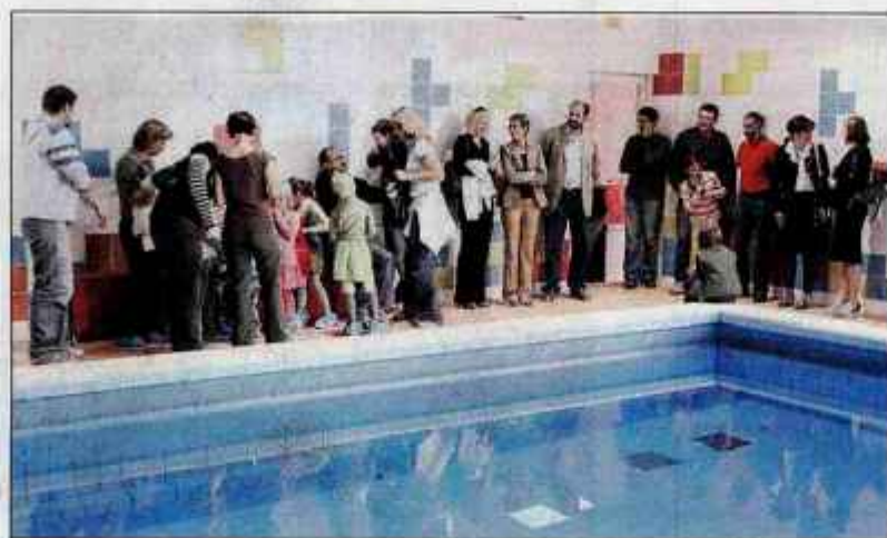
Odprli so bazen v Stari Loki.

Dela so se začela julija, pri njih je sodelovalo 21 izvajalcev, med njimi tudi vrsta loških podjetnikov, nekdanjih in sedanjih športnikov, ki so z veliko mero solidarnosti odlično opravili svoje delo. Je