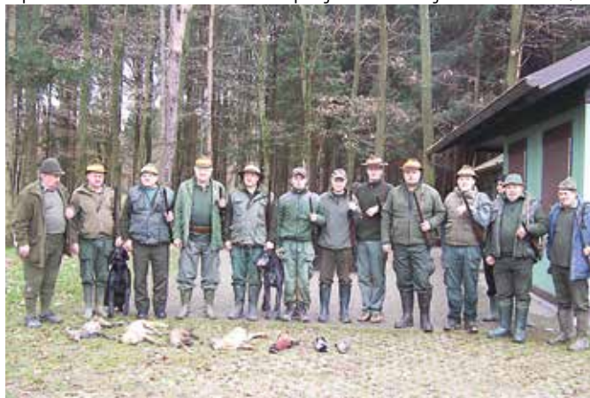
Lovci LD Mlajtinci po končanem nedeljskem jesenskem lovu