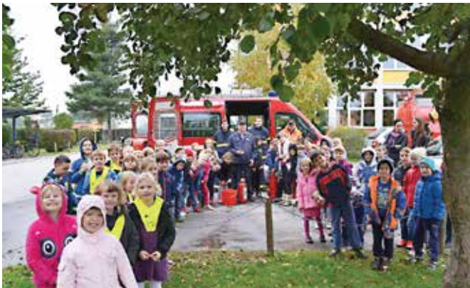
Gasilska vaja v vrtcu in Osnovni šoli Bogojina