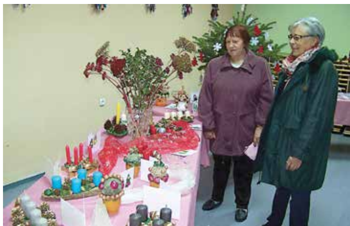
Bogata in pisana paleta adventnih venčkov in aranžmajev v Martjancih