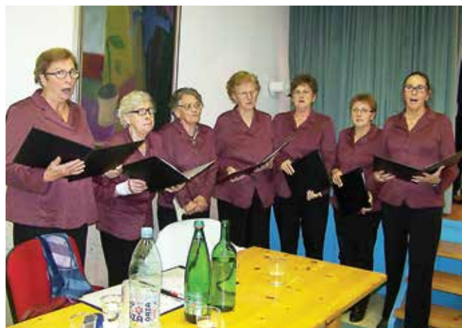
Martinov večer so v Filovcih popestrili domače ljudske pevke