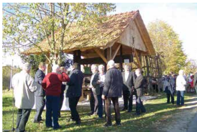
Martinova nedelja v Filovskem Gaju

Lepa sončna Martinova nedelja, 8. novembra je med vinograd v Filovski Gaju nad vasjo Filovci privabila številne vinogradnike in ljubitelje vin ter ostale obiskovalce, ki spoštujejo naravo in kulturno dediščino, med njimi so bili tudi gostje iz sosednje države Madžarske in ostalih prekmurskih vinogradniških društev. Osrednji vinogradniški dogodek je bil posvečen 15. letnem