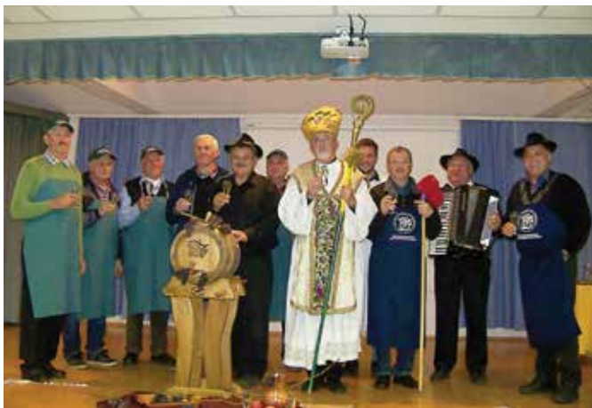
Martinovanje s škofom v Filovcih