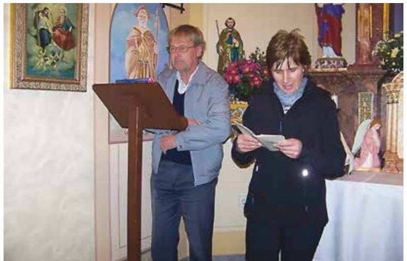
Na duhovno- kulturnem večeru so na Bukovnici obudili spomine na gradnjo sedanje 110- let stare kapele