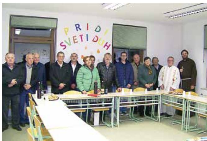
Na Martinovo so blagoslovili vino v Martinovem domu v Martjancih