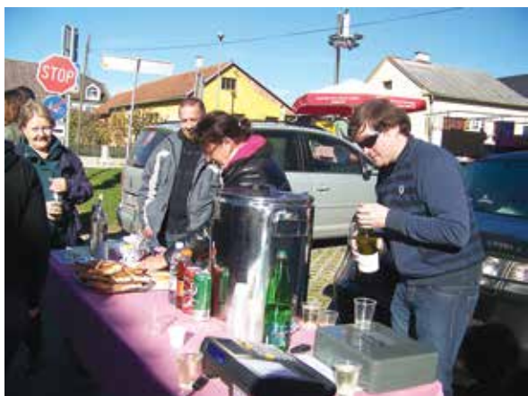
Predstavilo se je tudi Turistično društvo Martin Martjanci.