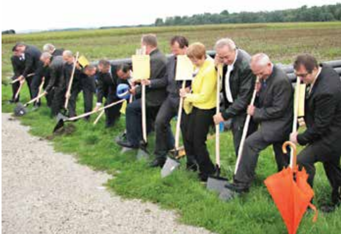
Septembra 2013 je bila simbolično zasajena lopata, s katero so župani in takratni minister za kmetijstvo in okolje Dejan Židan potrdili uradni pričetek gradnje pomurskega vodovoda krak B.

Javno podjetje VODOVOD SISTEMA B d.o.o., Kopališka ulica 2, Murska Sobota bi naj z dnem 01.01.2016 prevzel in pričel izvajati gospodarsko javno službo »oskrba s pitno vodo« na oskrbovalnih območjih določenih z vsakokrat veljavnim odlokom o oskrbi s pitno vodo v Občini Moravske Toplice. Več o vsebini seje pa v 142. številki Lipnice.