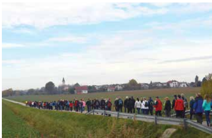
Zdrav duh v zdravem telesu na sončno martinovo soboto

TIC Moravske Toplice se ob koncu prav vsem skupaj zahvaljujemo za doprinos pri izvedbi prireditve, še posebej soorganizatorju KS Sebeborci z društvu in članom Turističnega društva Martin Martjanci za pripravo pogostitve.