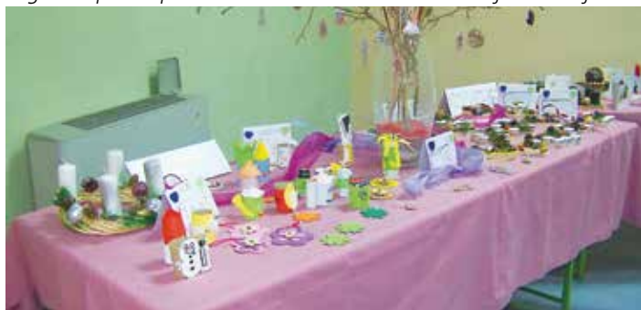
Svoj kotiček so na adventni razstavi v Martjancih imeli so tudi najmlajši