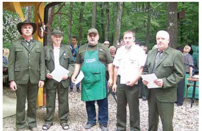
Lovci lovske družine Bogojina prejeli lovska odlikovanja z znakom za lovske zasluge