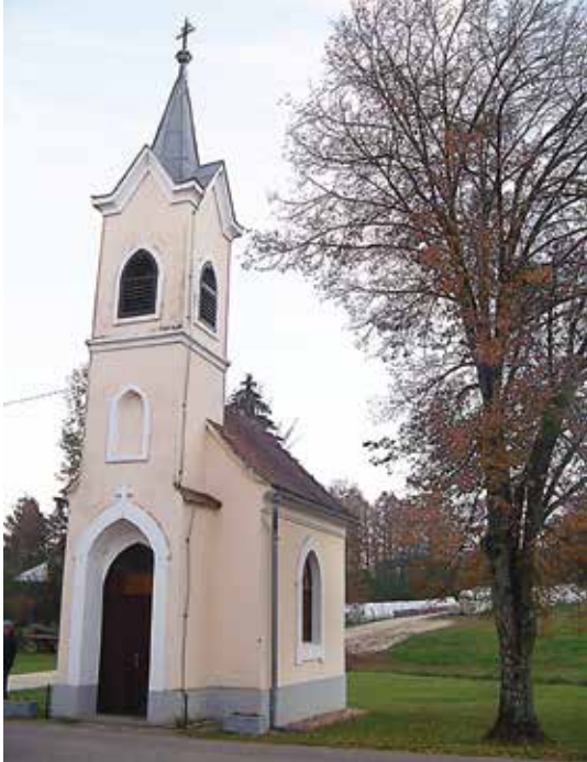
Kapela na Bukovnici s častitljivo 110 – letnico.

Na duhovno- kulturnem večeru so na Bukovnici obudili spomine na gradnjo sedanje 110- let stare kapele