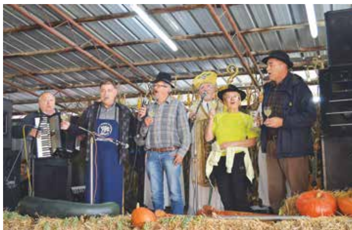
Krst mošta (TD Dobrovnik) s prostovoljci