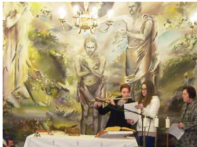
Duhovno kulturni večer na Ivancih