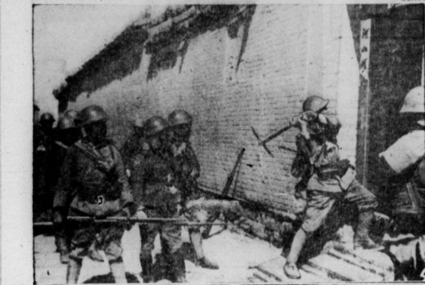
Japonski vojaki udirajo v hiše, v katerih se skrivajo kitajski strelci. Vsekega, ki ga dobe, ustrelje.

bi vam dal na razpolago imenik članov, ki so interesirani v njo in v njene knjige ter liste, bi se čudili — tako jih je malo. V tej okolici je tisoče rojakov. Pri čitalnici jih je le kakih 50. Njihov sej se udeležuje kakih 10 članov.