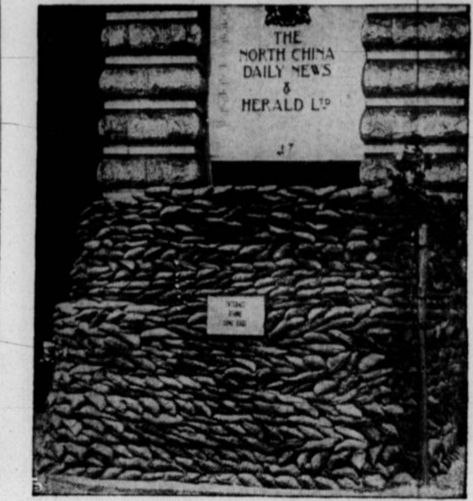
Časopisi na Kitajskem imajo zdaj strah ne samo pred cenzuro, ampak tudi pred bombami. Mnogo časniških poslopij je bilo že porušeni. Na tej sliki vidite urad časopisa, ki ima vhod zabarikadiran.