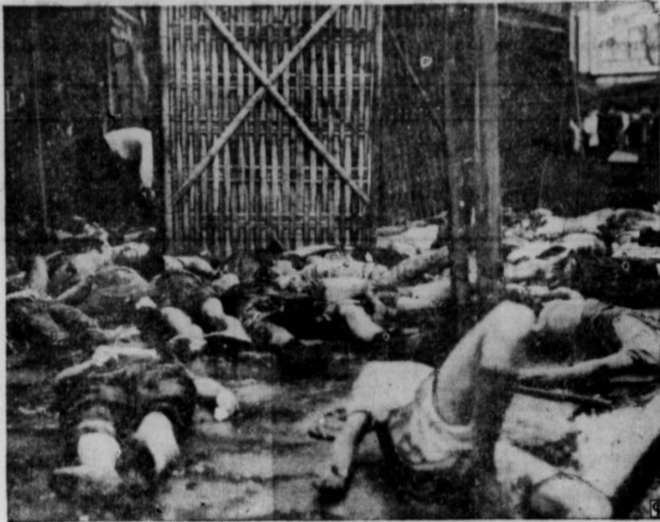
Ulica v Sanghaju posuta z mrličmi — posledica japonskega bombardiranja iz aeroplanov.