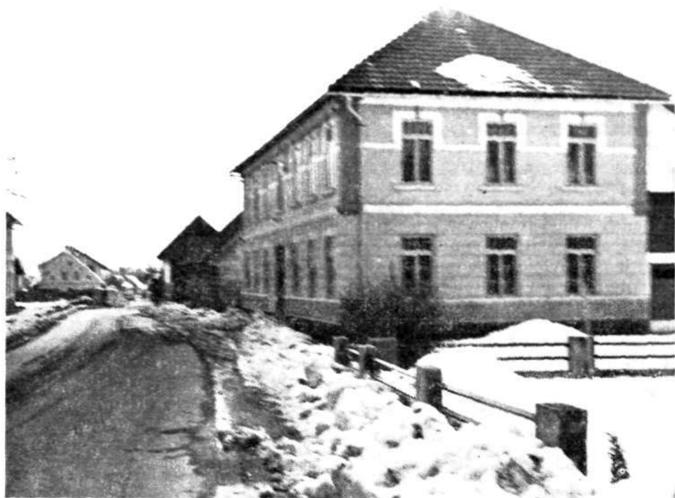
Primer stavbe čevljarских zadrug pred 2. svetovno vojno