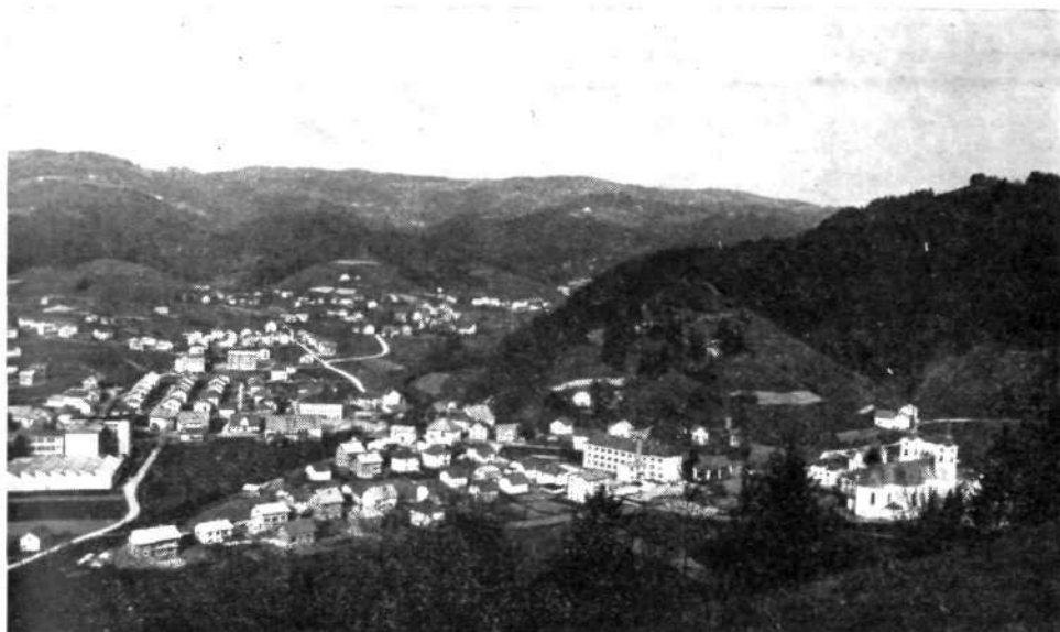
Ž i r o v s k a k o t l i n i c a

V žirovski županiji je bilo leta 1318 na novo naseljenih 77 hub, leta 1500 jih omenja urbar že 88 in 6 kajžarjev. Rovtarska kolonizacija je po številu močno preseгла prvo. Podatki iz urbarja leta 1630 kažejo, da se je število grun-tarjev dvignilo na 103, poleg tega je še 52 polgruntov in 37 tretjinskih gruntov. Močan je porast kajžarjev. Do leta 1825 se je število gospodarstev kljub kon-čani kolonizaciji močno spremenilo. Rovtarji so si s krčenjem gozdov večali posestva tako, da se je veliko število polgruntov ali celo kajžarjev razvilo na