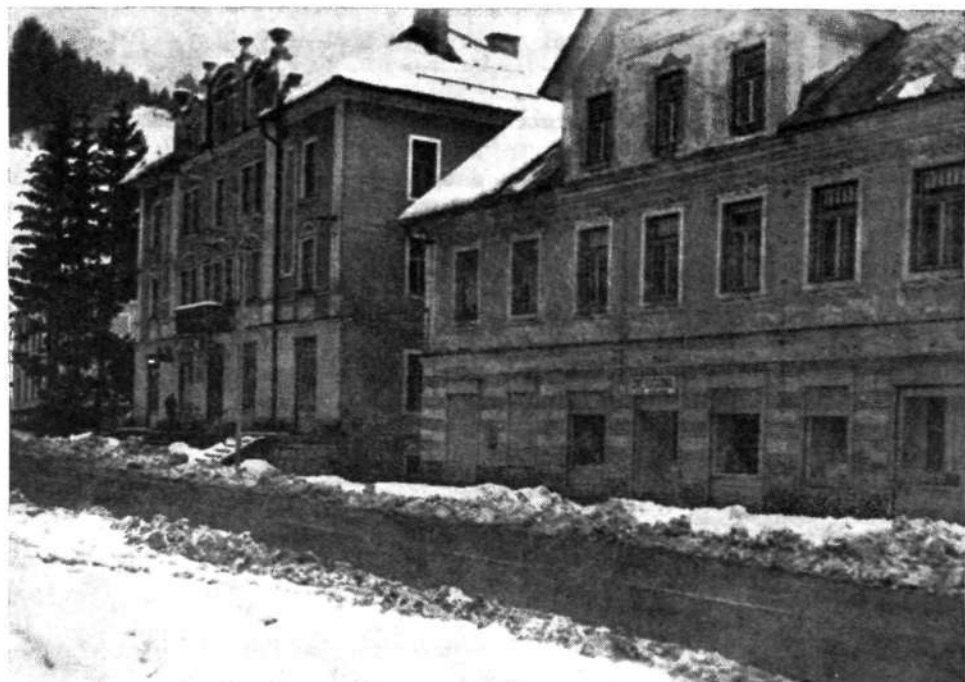
Stanovanjski hiši starega tipa s trgovskimi prostori v pritličju